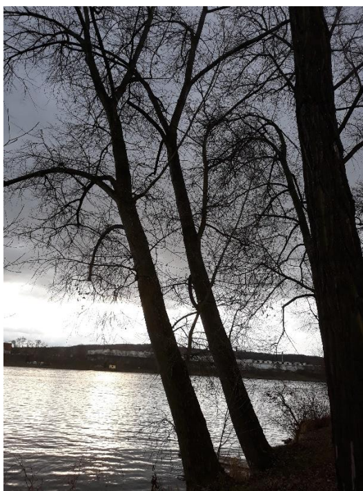
Topoly jsou výrazně vychýlené z osy růstu.