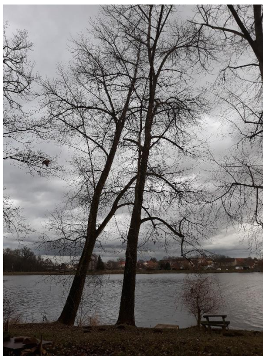
V prostoru pod topoly je odpočinková zóna.