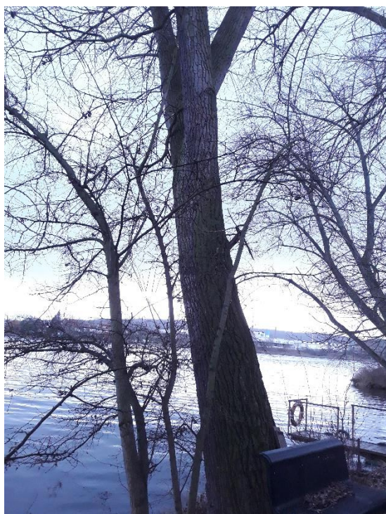
Topol č. 4 nahradí dřeviny z podrostu.