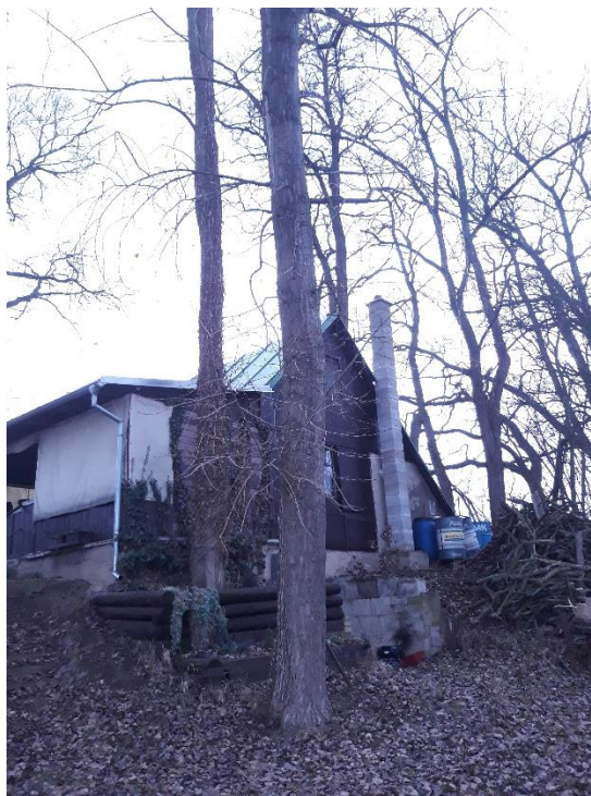
Topol situovaný v blízkosti rekreačního objektu.

Tento posudek slouží pro potřeby správních jednání při správě a údržbě vodního toku.