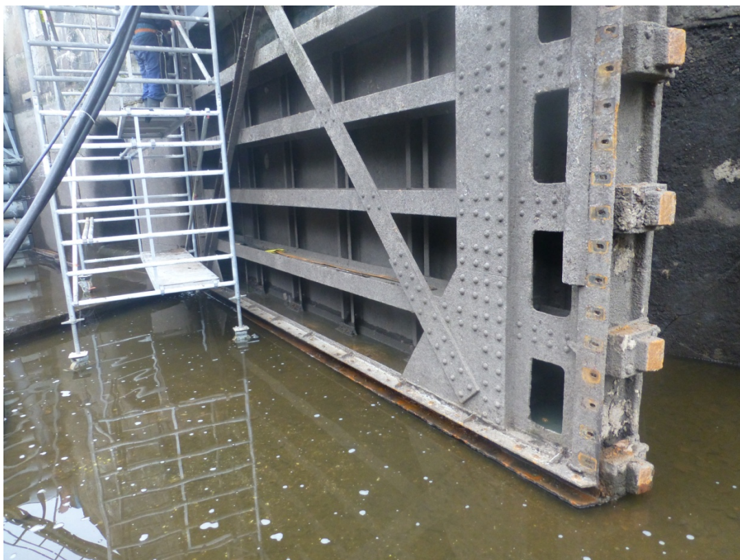
Pravá vráťeň DO