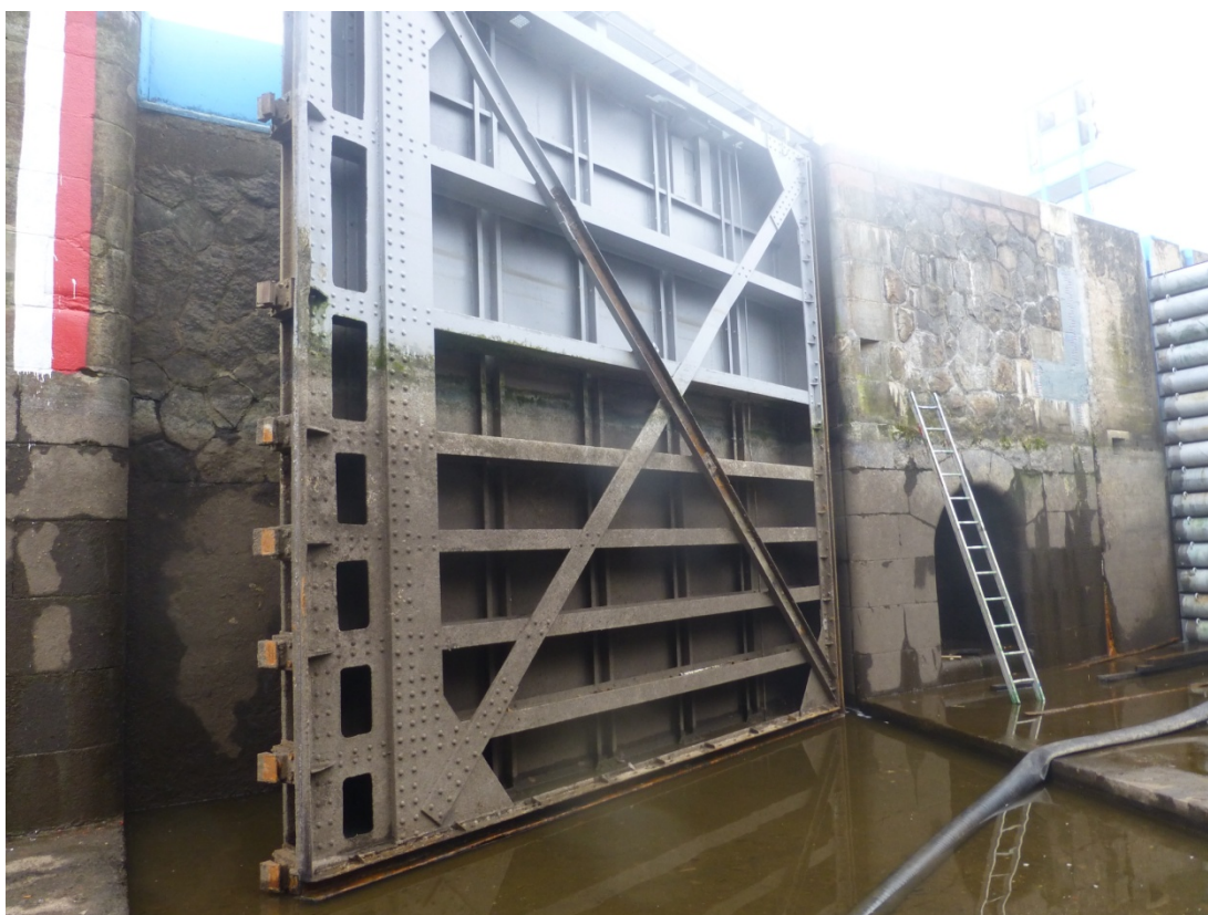
Levá vráťeň DO