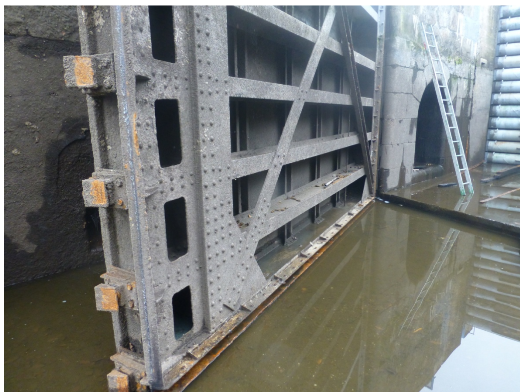
Levá vráťeň DO