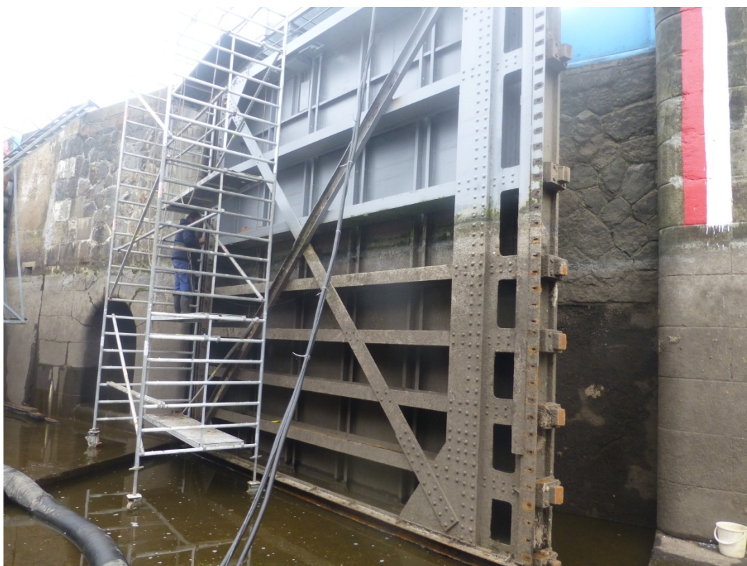
Pravá vráťeň DO