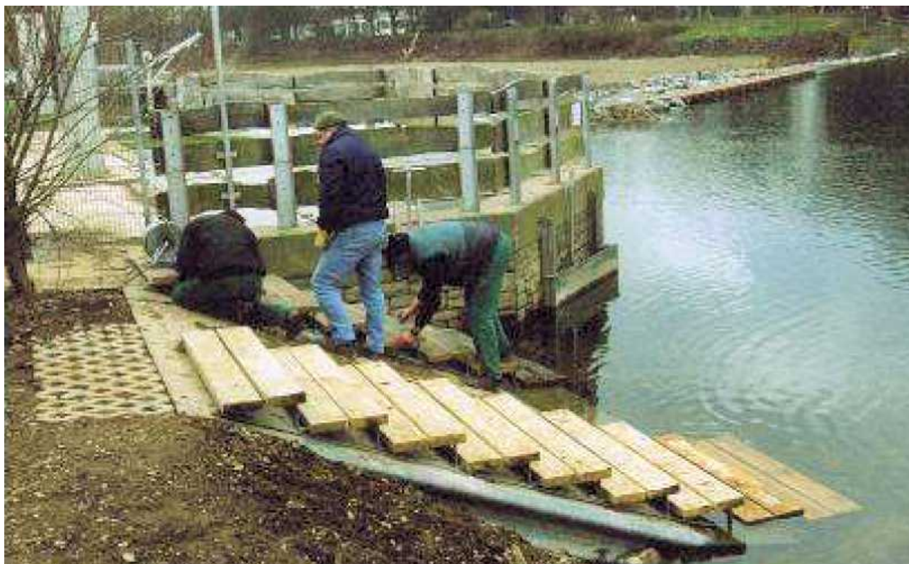
Ilustrace možnosti schodů v břehovém opevnění