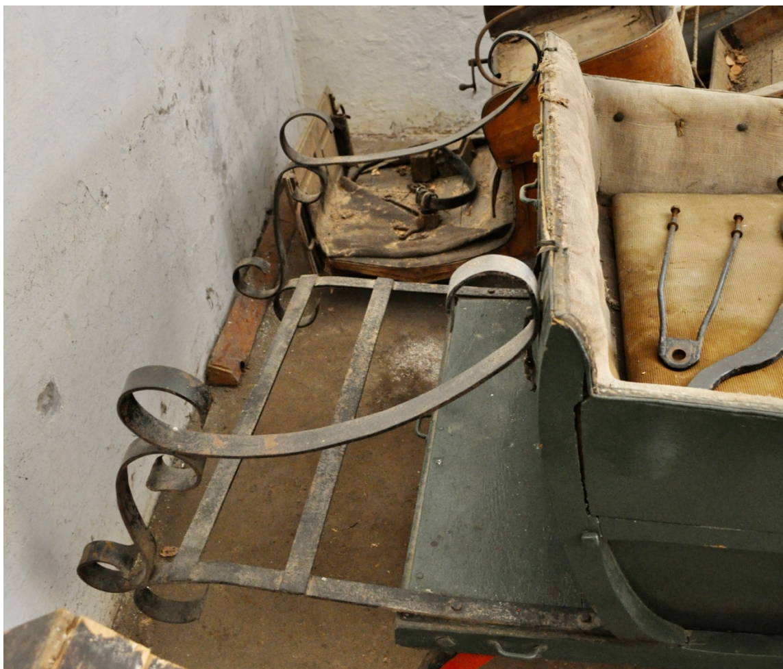
Obr.č.11. Na snímku pohled na prodloužení nosiče zavazadel. Jedná se pravděpodobně o pozdější druhotnou úpravu. (svažování ve spojích, neodpovídající stylizace odpovídá pojetí ze 60-70 let 20.stol., použití šroubů s šestihrannou hlavou).