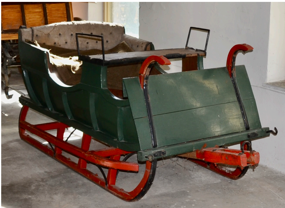
Obr.č.3. Na snímku celkový pohled na saně – přední část, stav před restaurováním. Patrné rozsechnutí přední stěny před kočím.