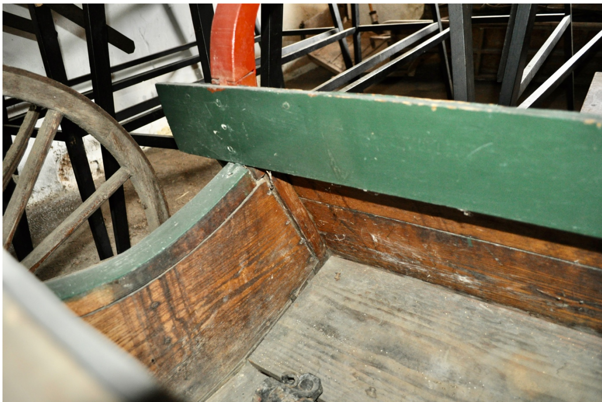
Obr.č.9. Na detailním snímku pohled na vnitřní část. Patrné fermežování vnitřní části.