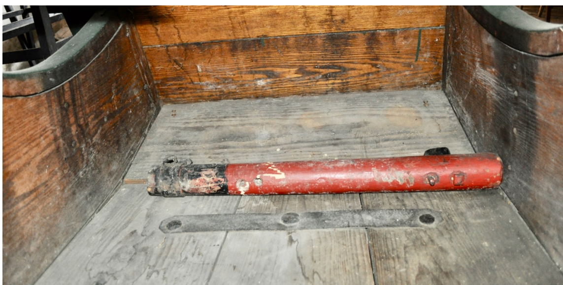
Obr.č.12. Na detailním snímku pohled na vnitřní část saní, podlaha je vyrobená z jedlového dřeva a bočnice jsou ze dřeva jasanového. Na bocích je patrná původní povrchová úprava fermežováním. Na snímku je zachycena pravděpodobně část chybějící vah nebo přední část oje.