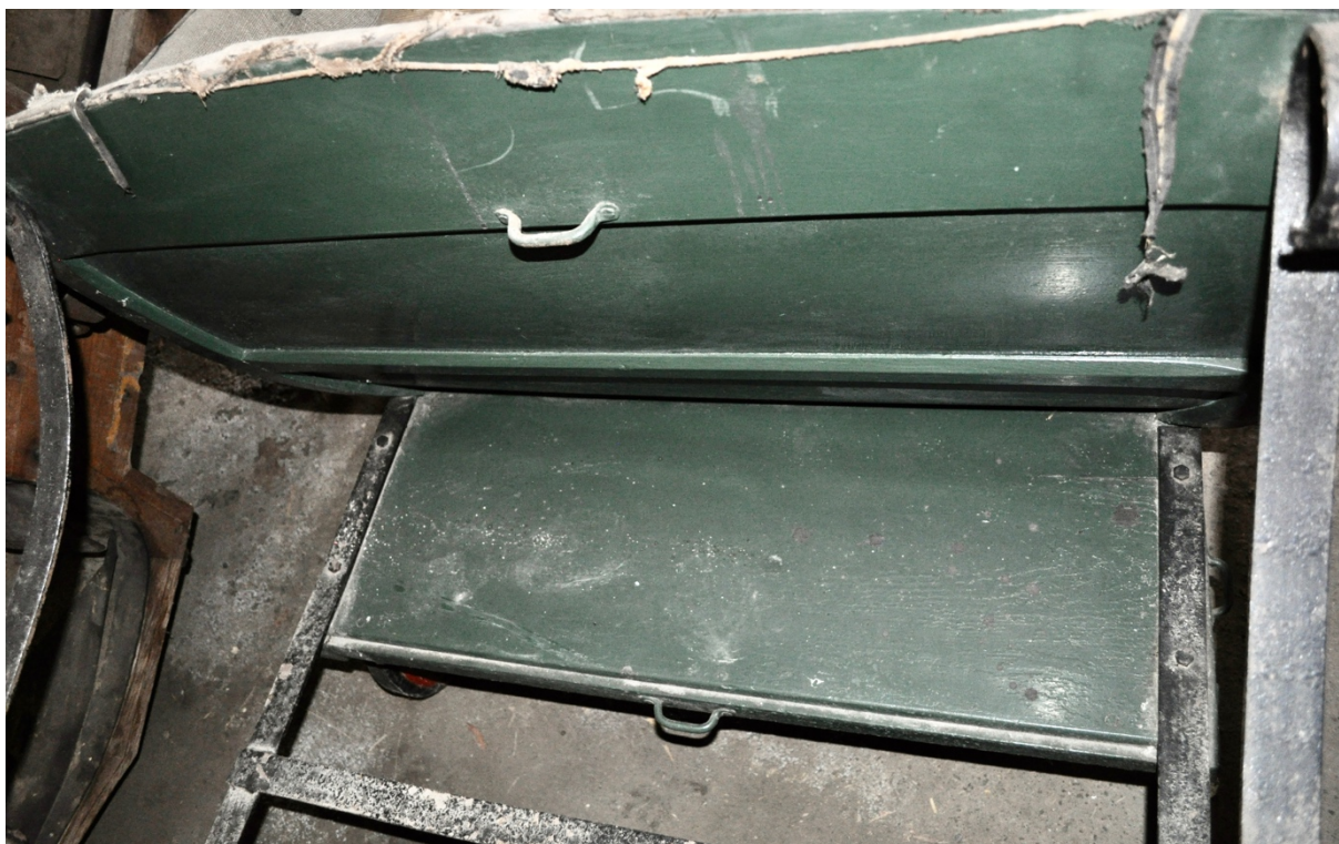
Obr.č.5. Na snímku je zachycena původní zadní část prostoru pro zavazadla. Patrná poutka pro řemeny na upevnění zavazadel.