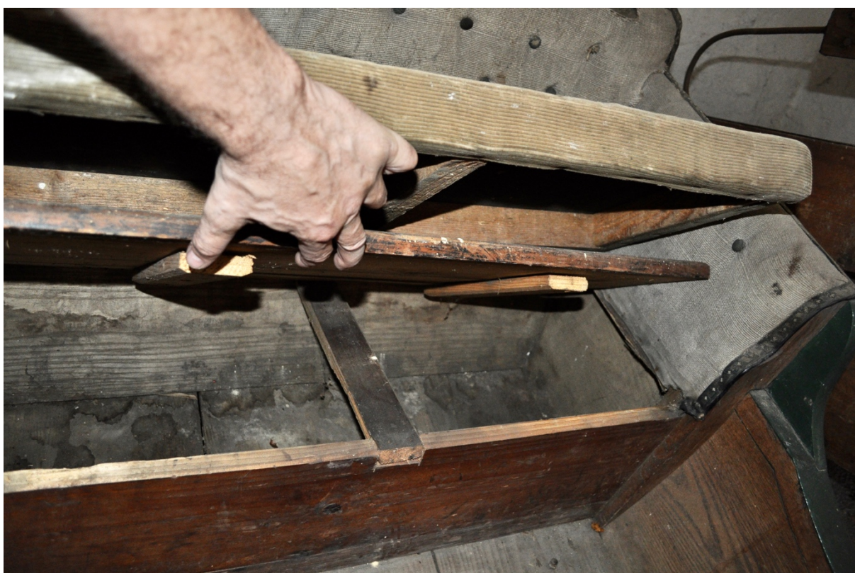
Obr.č.6 Na snímku pohled na úložný prostor pod cestujícími, patrné úpravy prostoru v podobě příčných latí. Nutný doplňující průzkum.