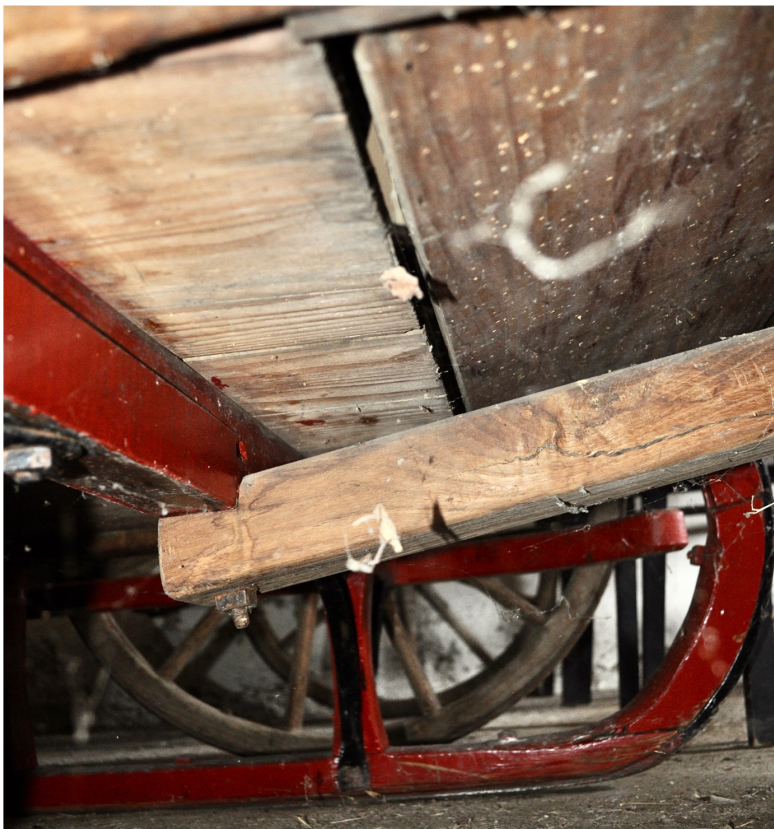
Obr.č.13. Na snímku pohled na spodní část, na kterém je patrné napadení dřevokazným hmyzem, patrné neodborné přetření barvou.