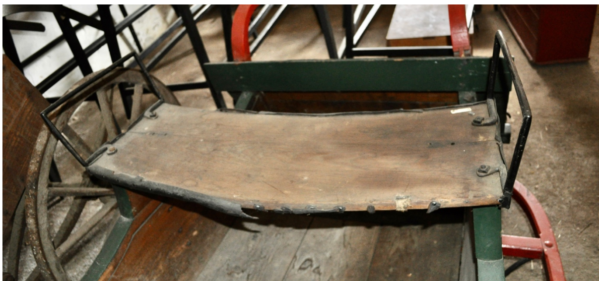
Obr.č.10. Na snímku pohled na poškozený kozlík kočího. Patrné poškození koženého lemu.