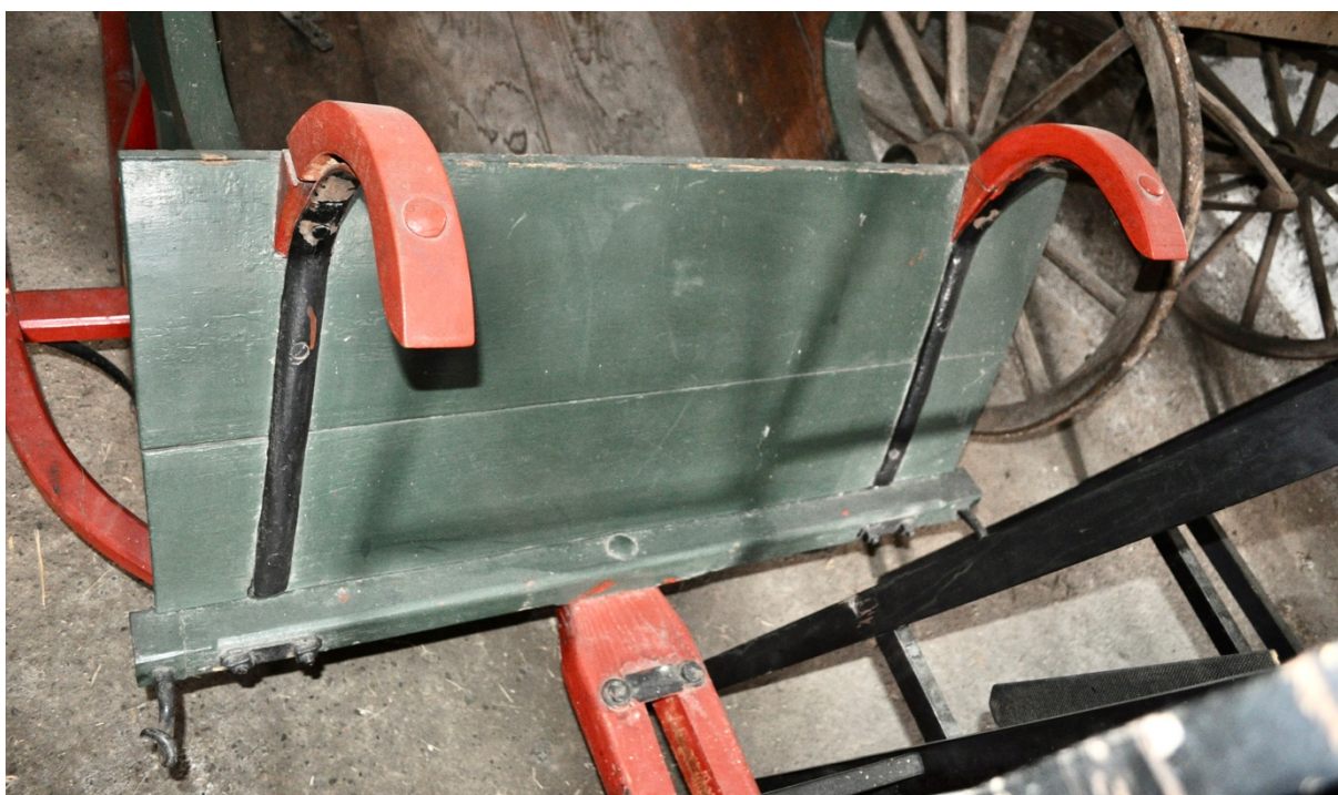
Obr.č.4. Na detailním snímku pohled na přední část saní. Na snímku patrné neodborné přetření barvou především u červené barvy- nevyhranění, přetření do zelených ploch apod.