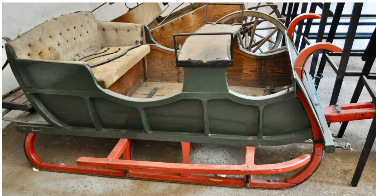
Obr.č.2 Celkový pohled na saně zachycuje původní čalounění -stav před restaurováním.