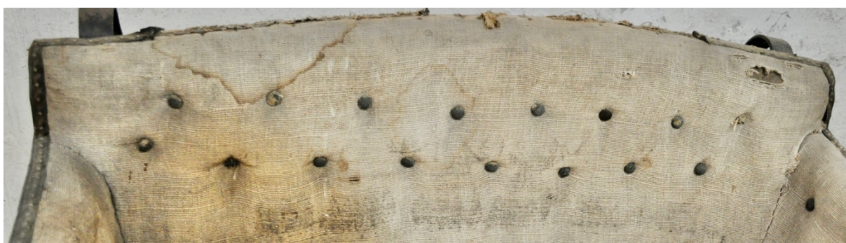
Obr.č.18. Na detailním snímku pohled na poškozené čalounění opěradla.