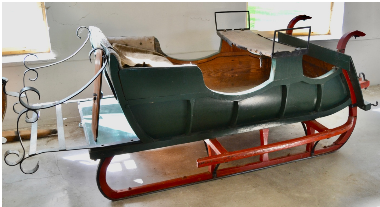
Obr.č.1. Celkový pohled na saně - stav před restaurováním.