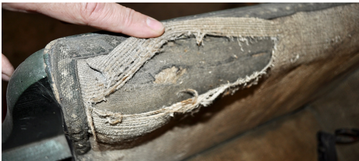
Obr.č.20. Na snímku mechanické poškození horní hrany područky, pod potahovou látkou je patrná pravděpodobně podkladová textilie. Detailně jsou zde patrné původní zdobené borty.