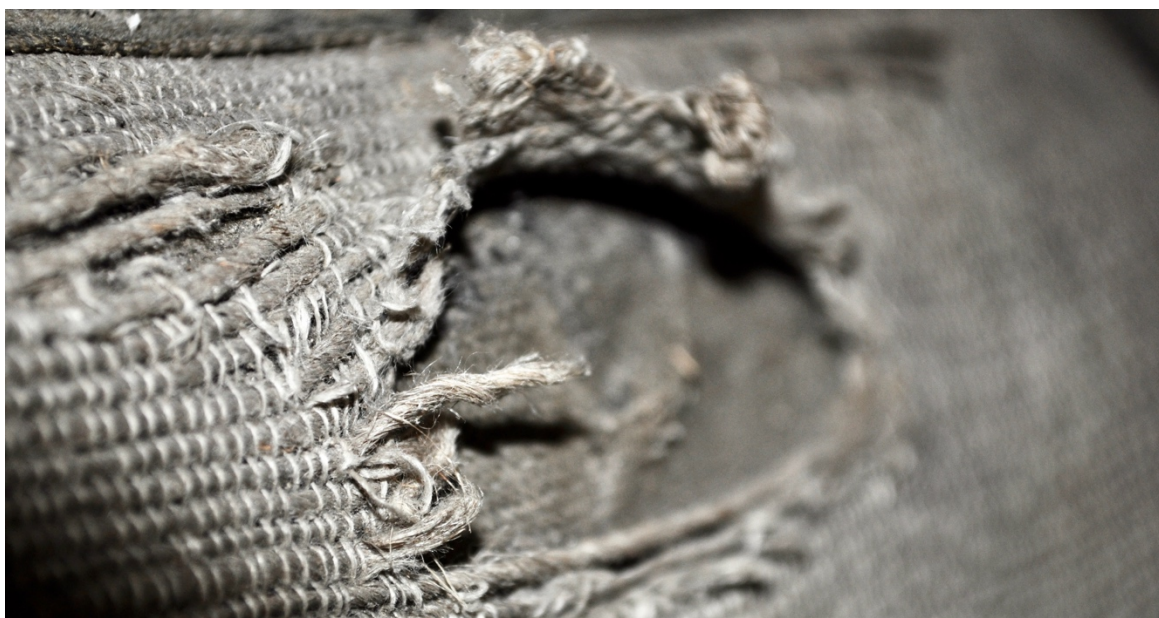
Obr.č.21. Na snímku detail poškození potahové látky. Snímek zachycuje charakter potahové látky.