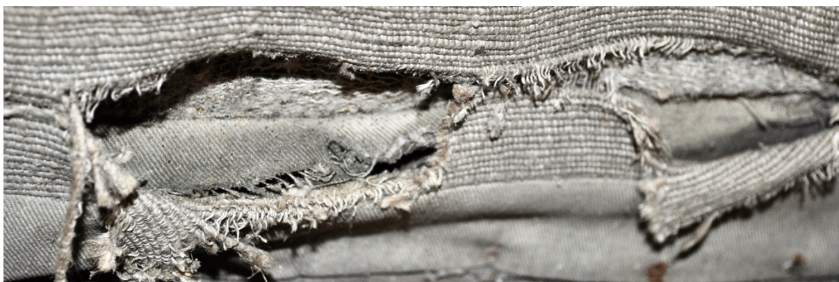
Obr.č.19. Na snímku detailní pohled na masivní poškození původního čalounění, jedná se o poškození na hraně restaurovatelnosti.