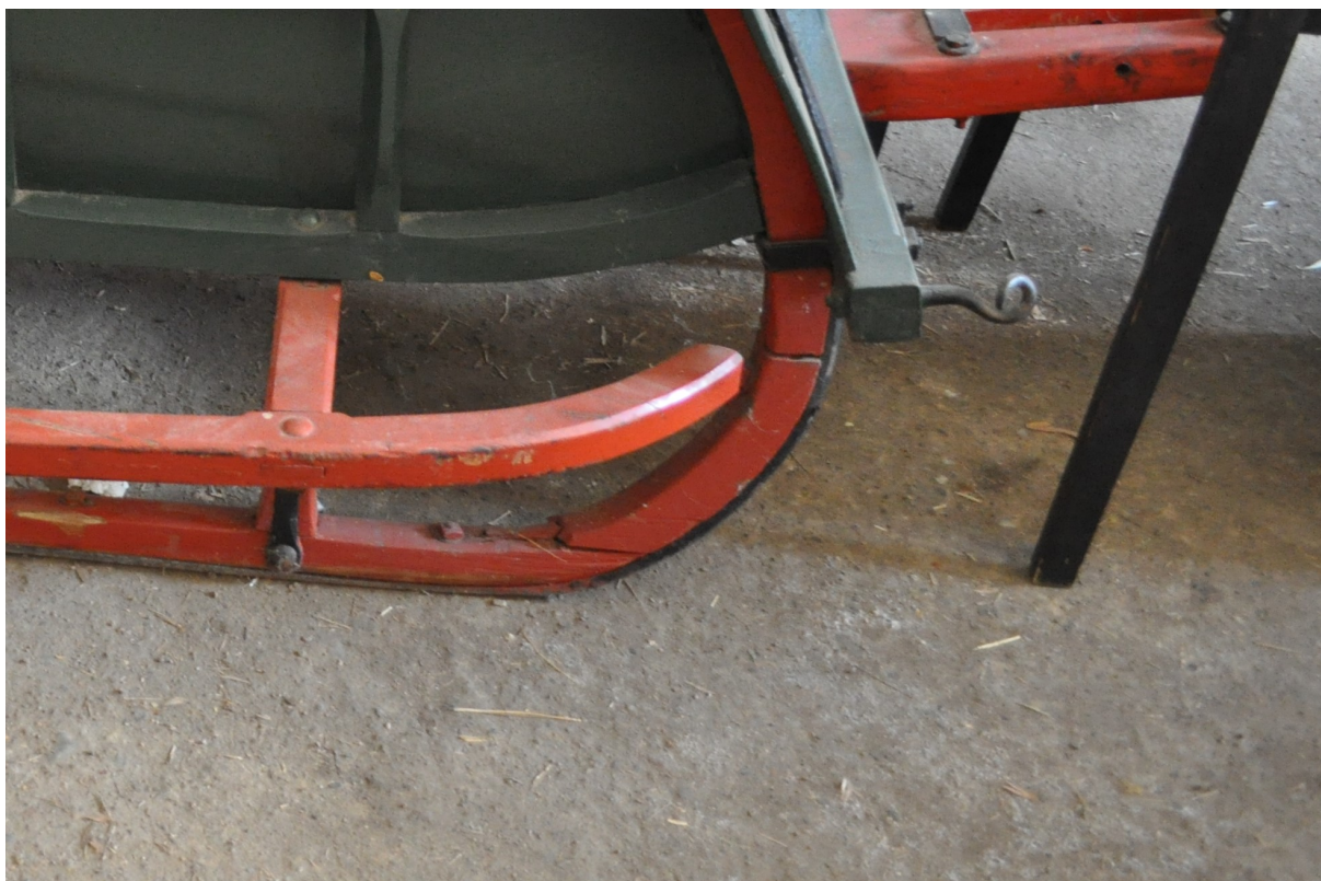
Obr.č.15. Na snímku pohled na dřevěné skluznice s patrným rozlomením ve spojích, napojení ohýbané části do rovné a další rozlomení skluznice v ohybu.