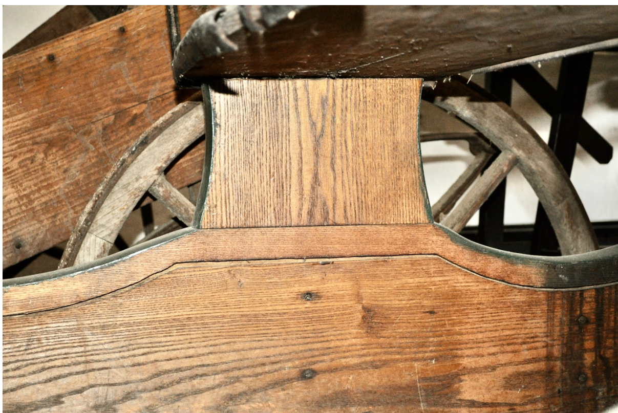
Obr.č.8. Na detailním snímku další pohled na vnitřní část saní - pod kozlíkem. Patrné neodborné přetření zelenou barvou-přetoky na hranách.