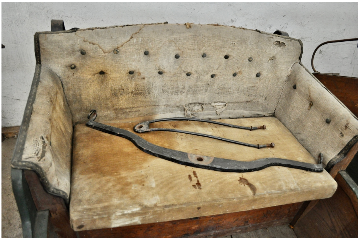
Obr.č.17. Na snímku celkový pohled na vnitřní vyčalounění. Patrné původní dochované čalounění vnitřního prostoru pro cestující (původní opěradlo, boky a volně ložený sedák). Patrné masivní poškození potahové látky-rozsáhlá skvrna v levé části.