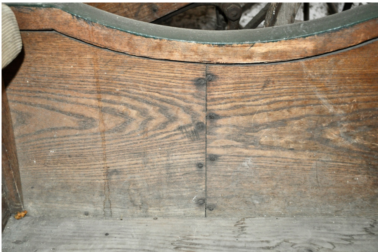
Obr.č.7 Na snímku detailní pohled na vnitřní část saní. Patrné neodborné přetření zelenou barvou-přetoky na hranách.