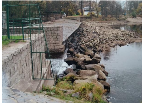
Původní opevnění pod výtokem za ŠP