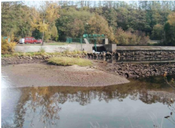
Původní opevnění podjezí