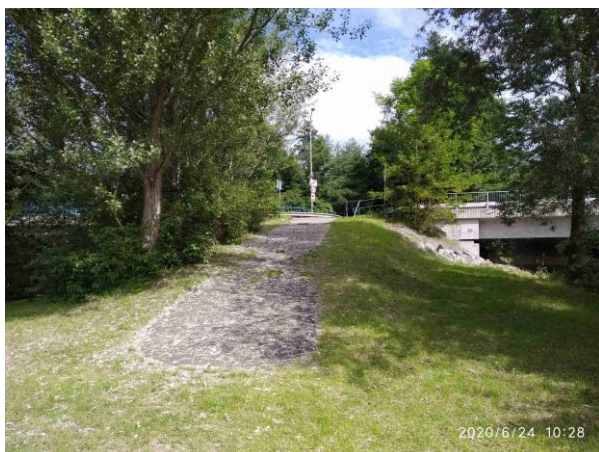
Přístup na stavbu