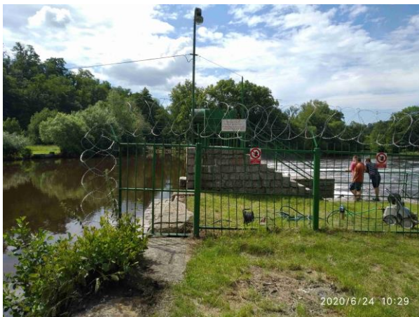
Oplocení přístupu k ŠP