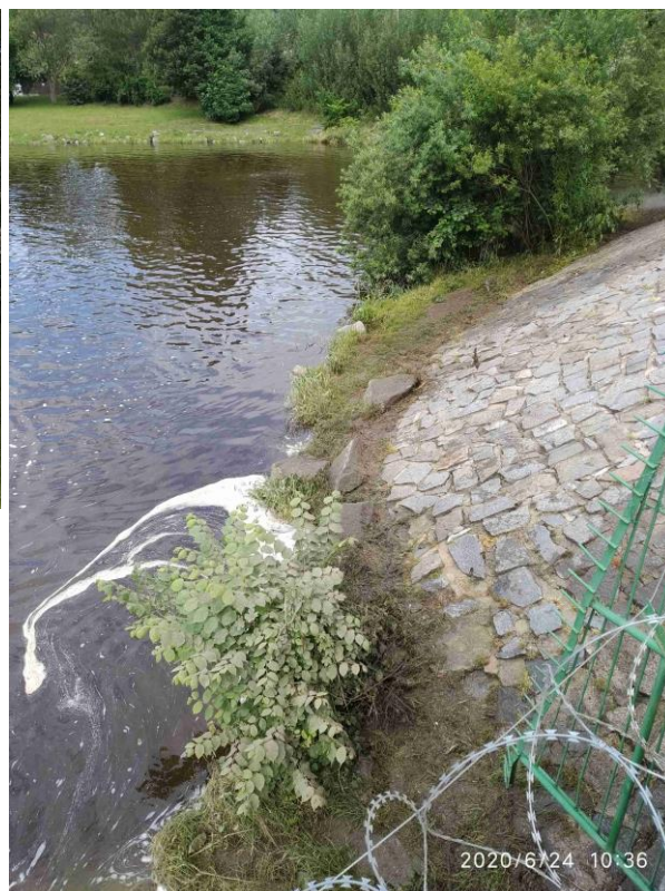
Opevnění břehu v místě navrženého sjezdu