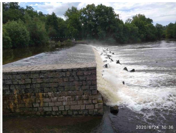
Opevnění pod pevným jezem