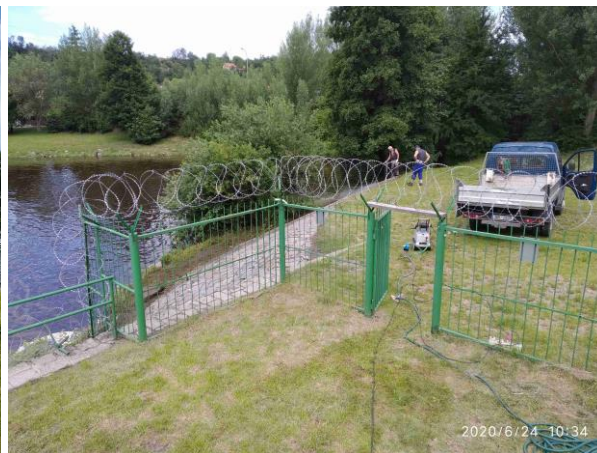
Oplocení přístupu ke ŠP