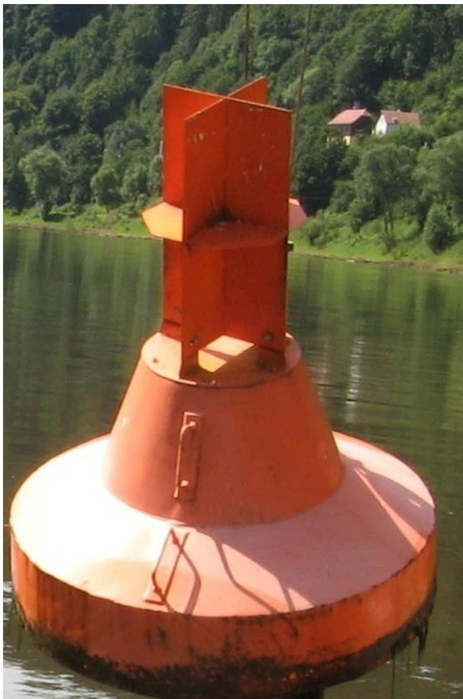
Příloha č. 2: Fotografie bóje určené pro regulovaný úsek