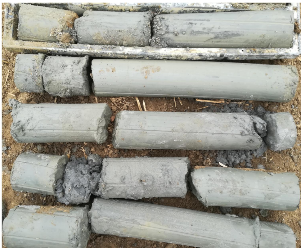
Foto 29 - Profil vrtu SV-16 - úsek 10 - 12 m, počátek vrtu vlevo nahoře