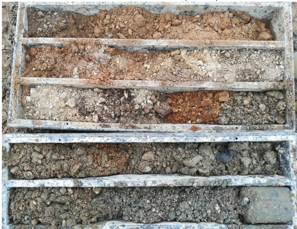
Foto 28 - Profil vrtu SV-16 - úsek 5 - 10 m

208.15 m n. m. Foto 27 - Profil vrtu SV-16 - úsek 0 - 5 m, počátek profilu vlevo nahoře