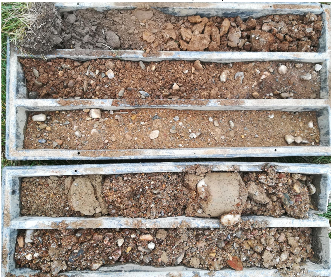
Foto 4 - Profil vrtu SV-3 - úsek 5 - 9 m

209.42 m n. m. Foto 3 - Profil vrtu SV-3 - úsek 0 - 5 m, počátek profilu vlevo nahoře