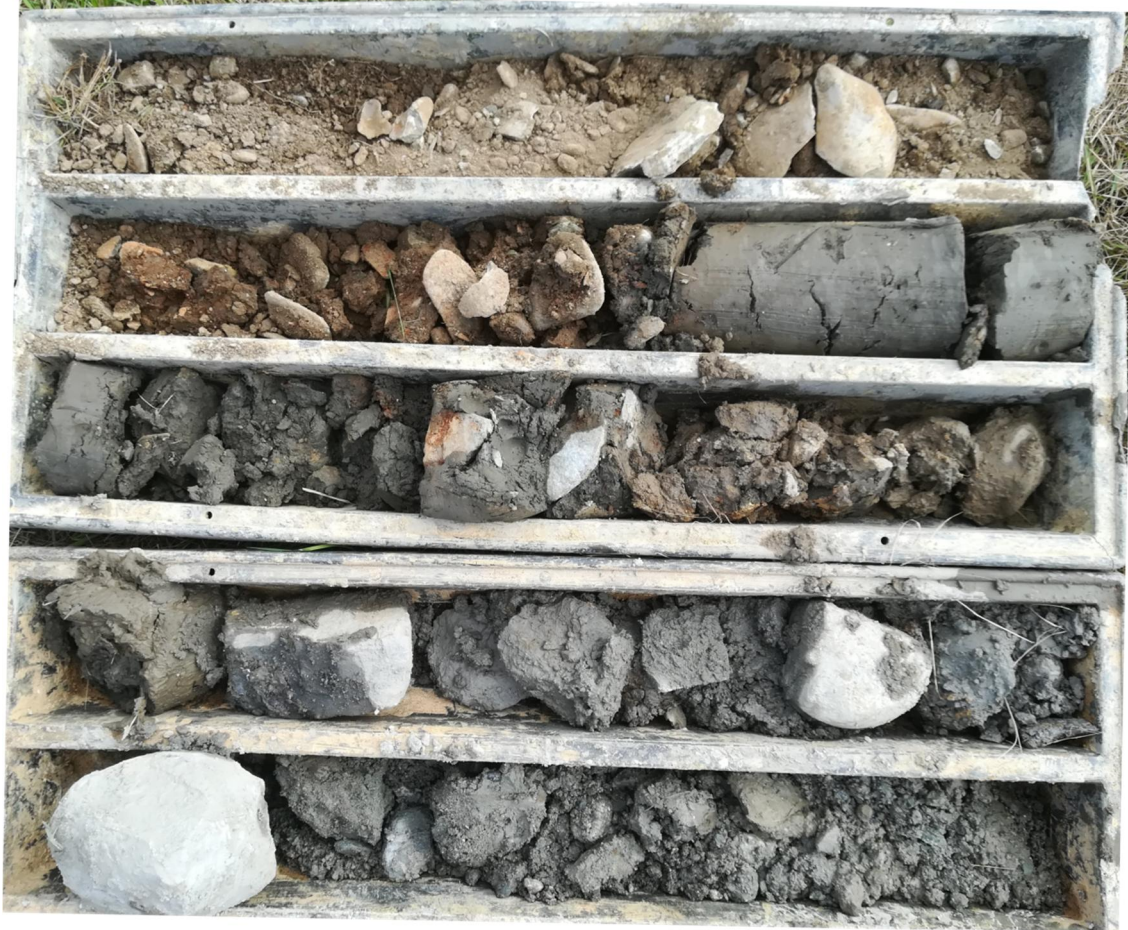
Foto 24 - Profil vrtu SV-13 - úsek 5 - 10 m

208.56 m n. m. Foto 23 - Profil vrtu SV-13 - úsek 0 - 5 m, počátek profilu vlevo nahoře