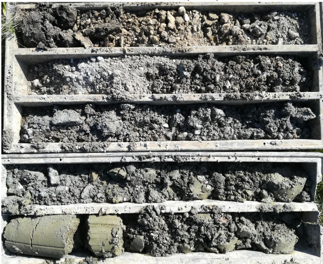
Foto 10 - Profil vrtu SV-7 - úsek 5 - 9 m

208.97 m n. m. Foto 9 - Profil vrtu SV-7 - úsek 0 - 5 m, počátek profilu vlevo nahoře