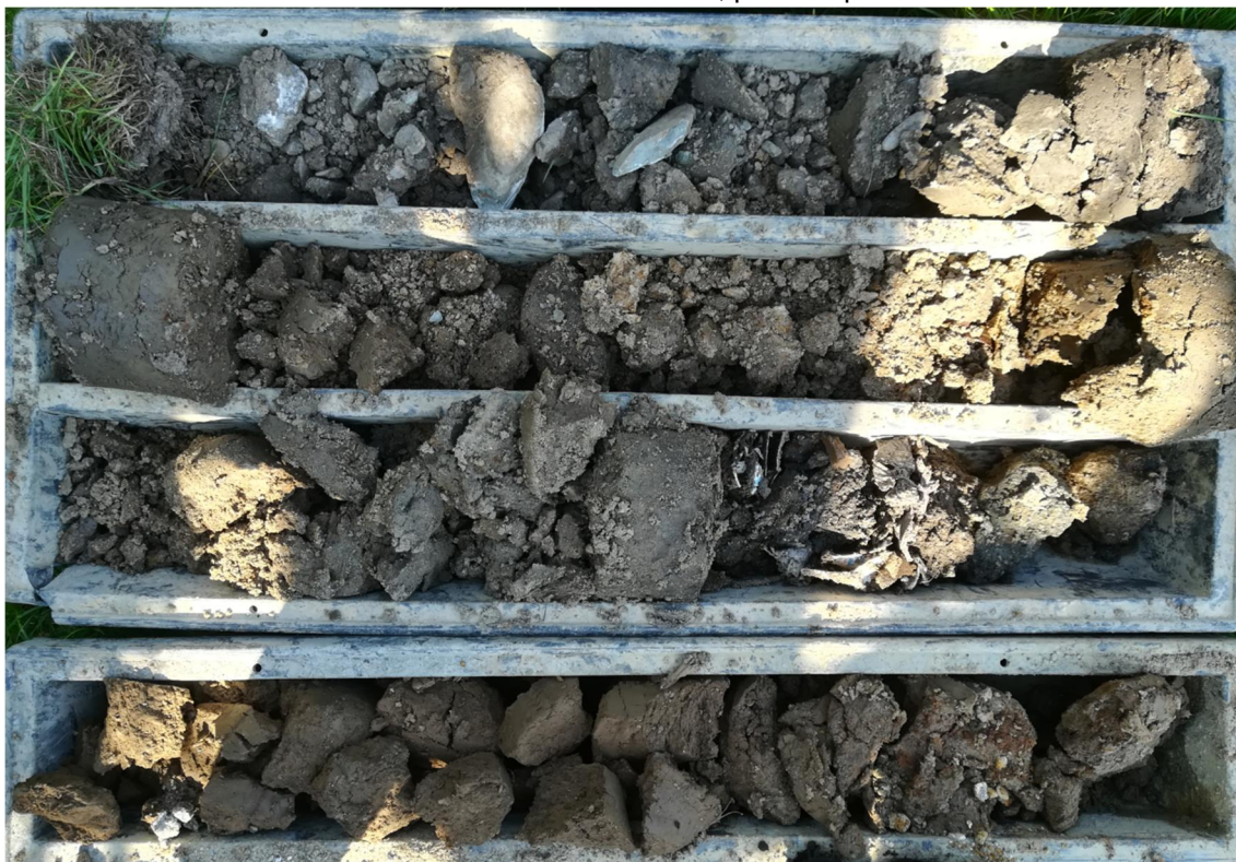
Foto 14 - Profil vrtu SV-9 - úsek 4 - 9 m

209.94 m n. m. Foto 13 - Profil vrtu SV-9 - úsek 0 - 4 m, počátek profilu vlevo nahoře