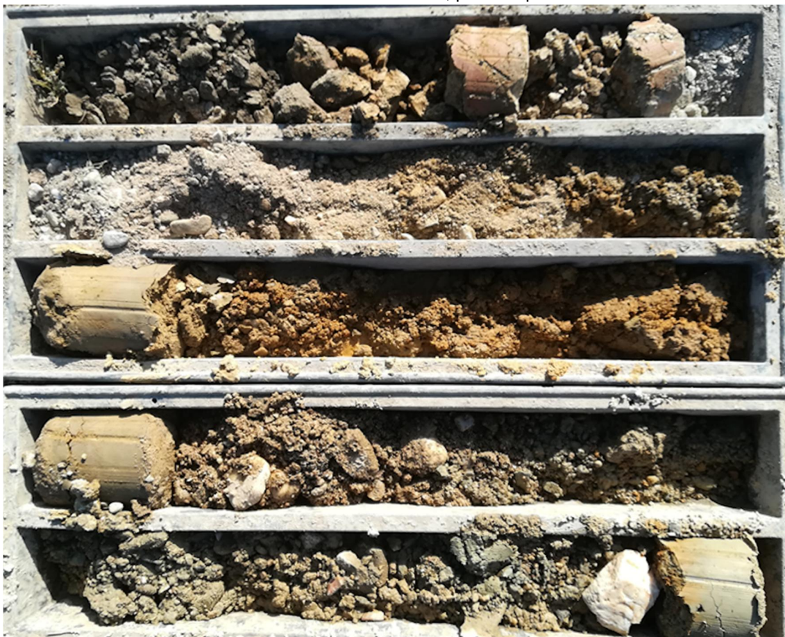
Foto 6 - Profil vrtu SV-4 - úsek 5 - 9 m

208.72 m n. m. Foto 5 - Profil vrtu SV-4 - úsek 0 - 5 m, počátek profilu vlevo nahoře