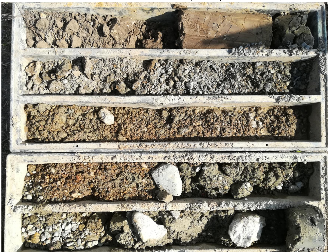
Foto 8 - Profil vrtu SV-6 - úsek 5 - 9 m

208.77 m n. m. Foto 7 - Profil vrtu SV-6 - úsek 0 - 5 m, počátek profilu vlevo nahoře