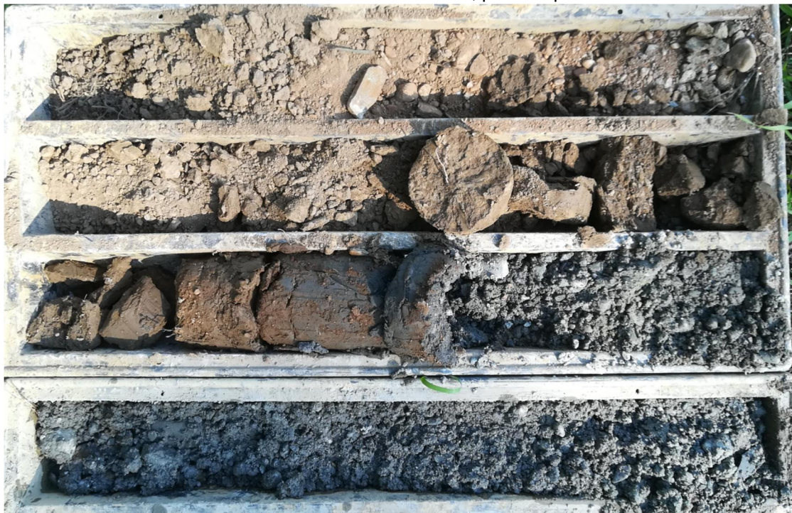
Foto 18 - Profil vrtu SV-11 - úsek 4 - 7 m

207.59 m n. m. Foto 17 - Profil vrtu SV-11 - úsek 0 - 4 m, počátek profilu vlevo nahoře