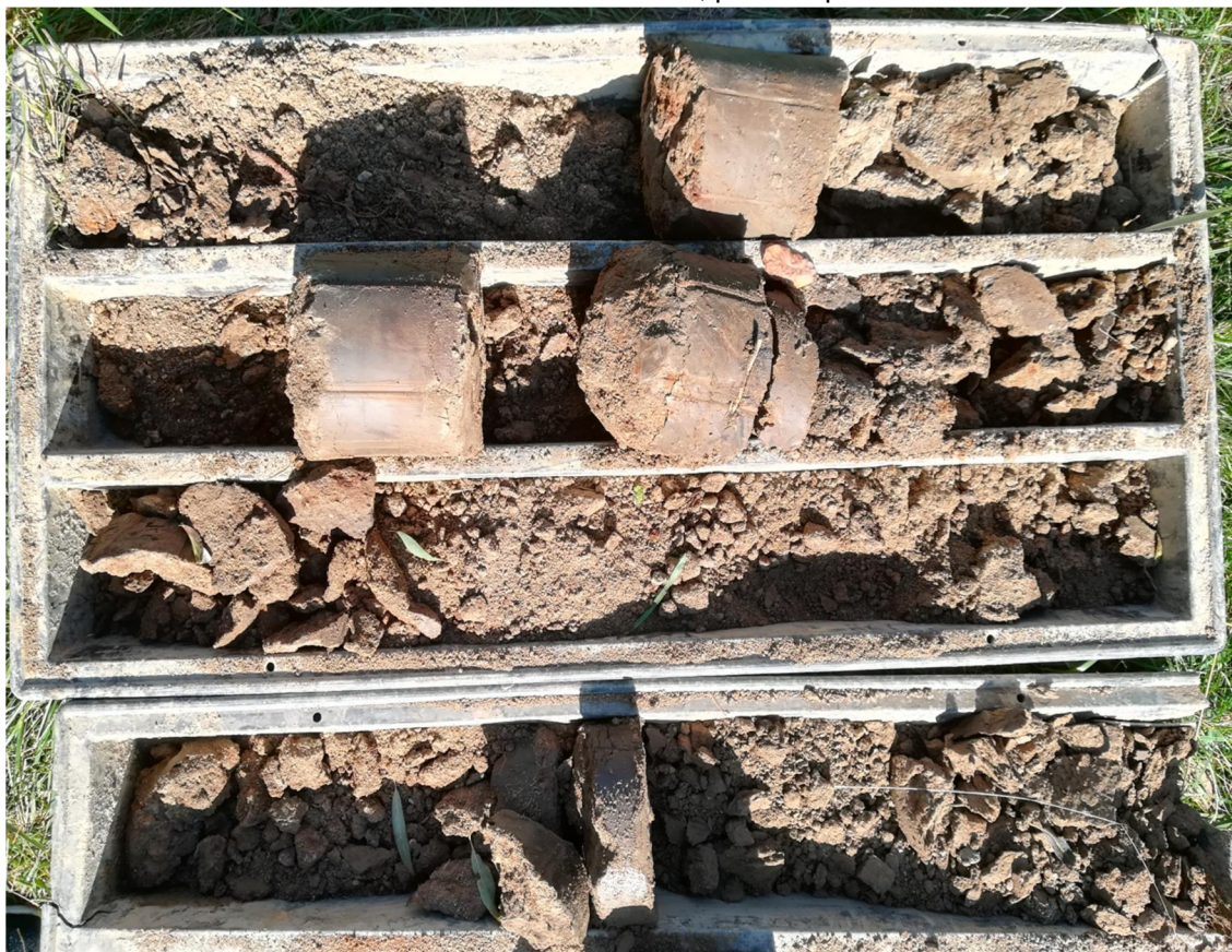
Foto 12 - Profil vrtu SV-8 - úsek 4 - 8 m

210.11 m n. m. Foto 9 - Profil vrtu SV-8 - úsek 0 - 4 m, počátek profilu vlevo nahoře