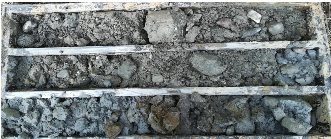
Foto 22 - Profil vrtu SV-12 - úsek 6 - 10 m