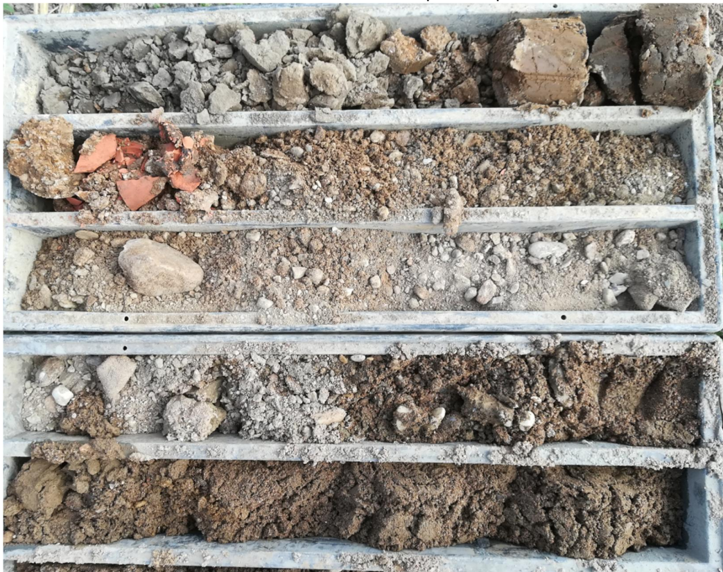
Foto 2 - Profil vrtu SV-1 - úsek 5 - 10 m

209.52 m n. m. Foto 1 - Profil vrtu SV-1 - úsek 0 - 5 m, počátek profilu vlevo nahoře