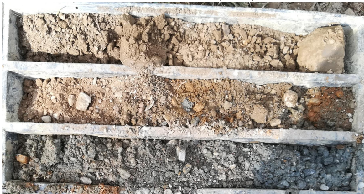
Foto 21 - Profil vrtu SV-12 - úsek 3 - 6 m

207.07 m n. m. Foto 20 - Profil vrtu SV-12 - úsek 0 - 3 m, počátek profilu vlevo nahoře