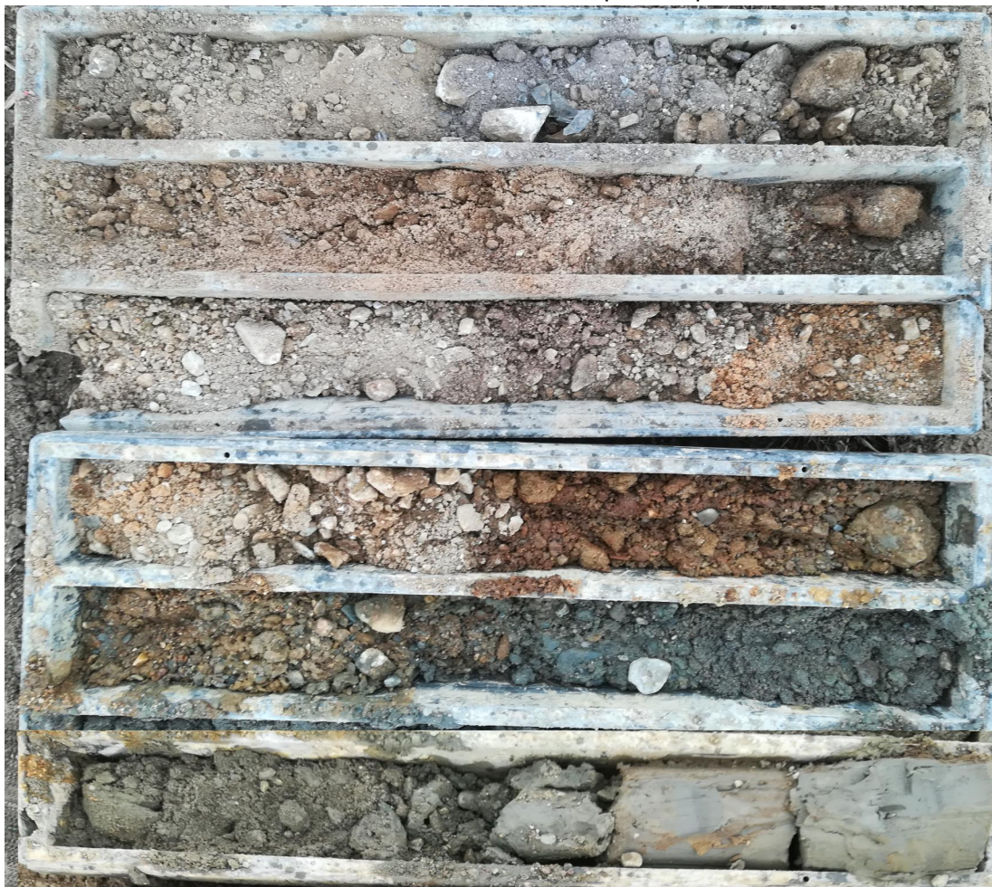
Foto 26 - Profil vrtu SV-14 - úsek 6 - 12 m

209.04 m n. m. Foto 25 - Profil vrtu SV-14 - úsek 0 - 6 m, počátek profilu vlevo nahoře