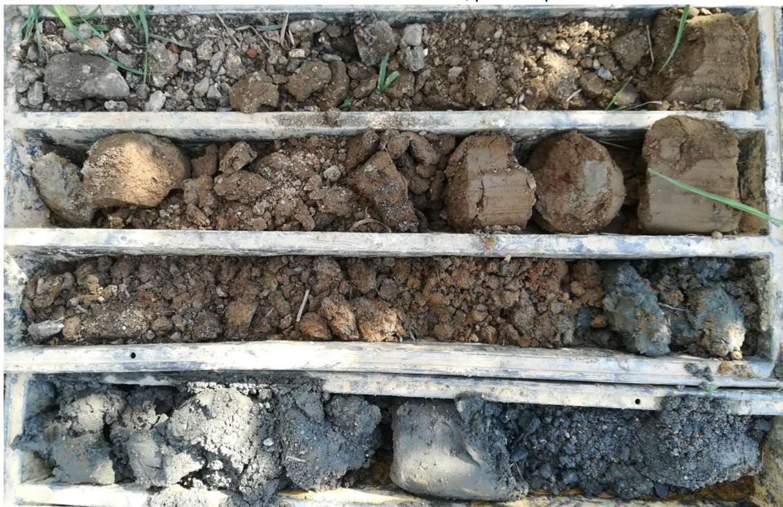
Foto 16 - Profil vrtu SV-10 - úsek 4 - 8 m

207.91 m n. m. Foto 15 - Profil vrtu SV-10 - úsek 0 - 4 m, počátek profilu vlevo nahoře