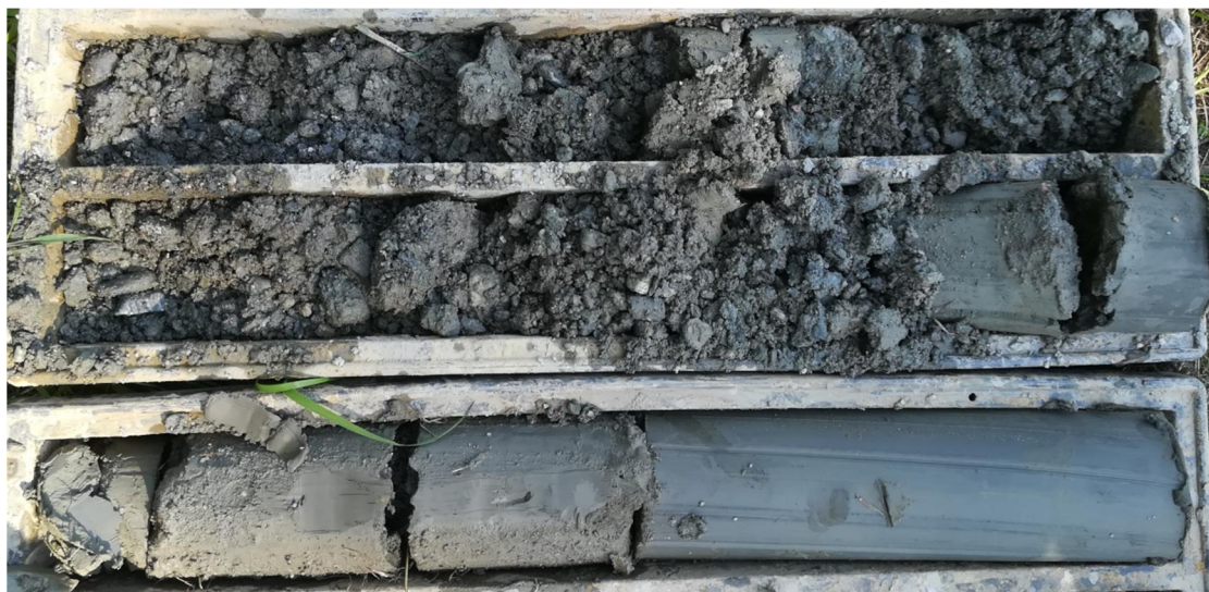
Foto 19 - Profil vrtu SV-11 - úsek 7 - 10 m