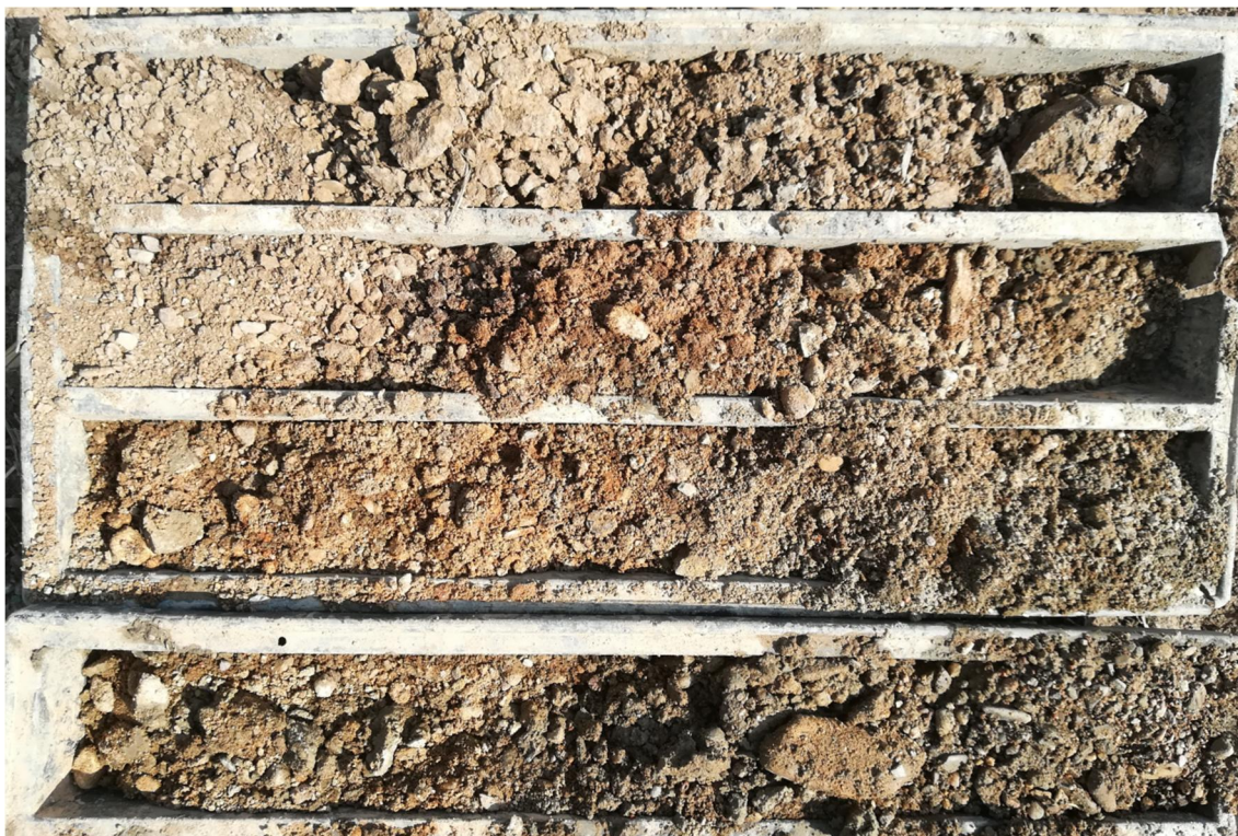
Foto 31 - Profil vrtu SV-18 - úsek 4 - 8 m

208.98 m n. m. Foto 30 - Profil vrtu SV-18 - úsek 0 - 4 m, počátek profilu vlevo nahoře