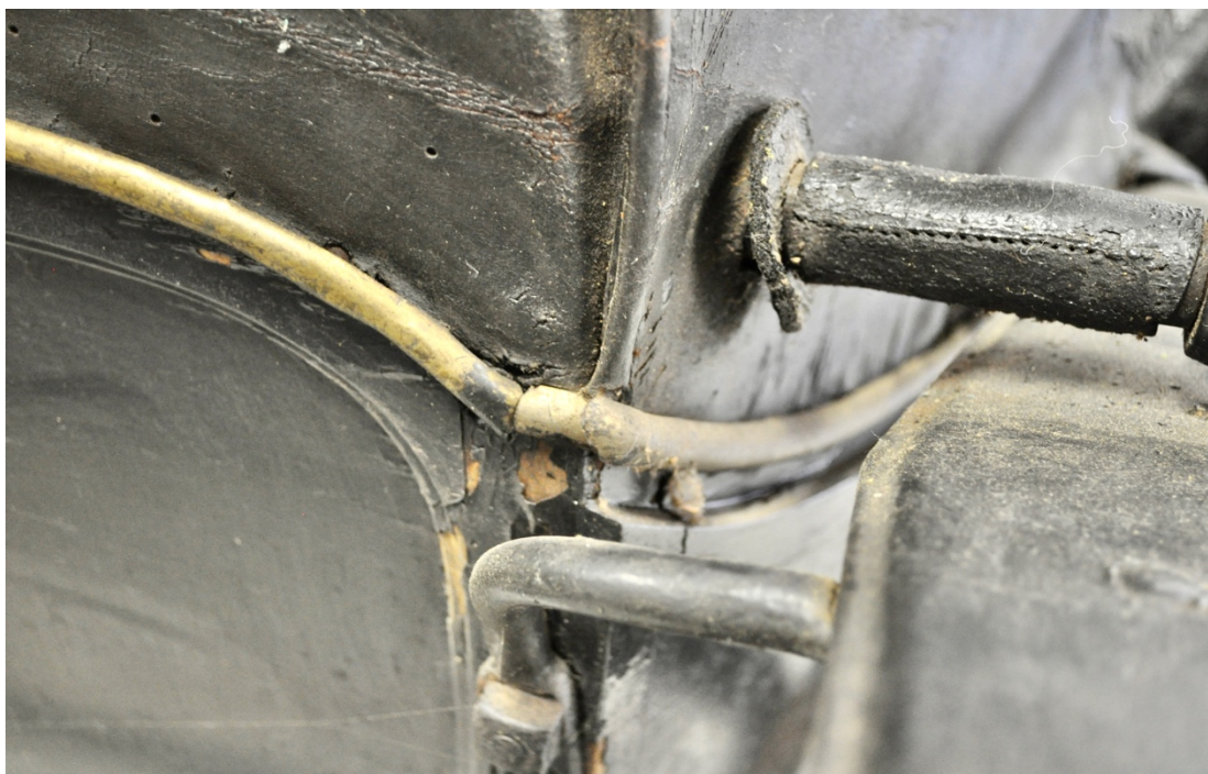
Obr.č.17. Na snímku detailní pohled na ozdobné mosazné lišty, snímek dále zachycuje poškození lakové vrstvy na zadní straně kočáru.