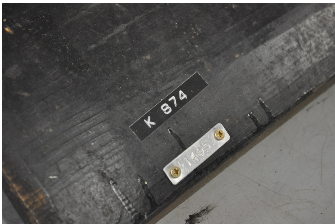
Obr.č.31. Na snímku detail evidenčního čísla na vnitřní straně dveří kočáru.