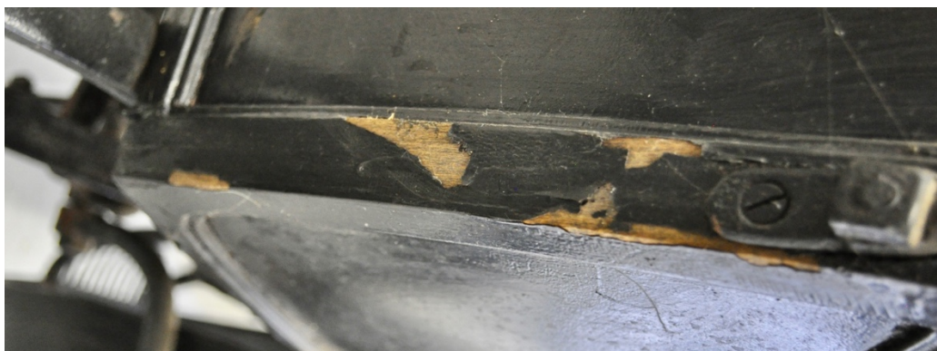
Obr.č.27. Na detailním snímku pohled na poškození zadní části kočáru, odlupování lakové vrstvy.