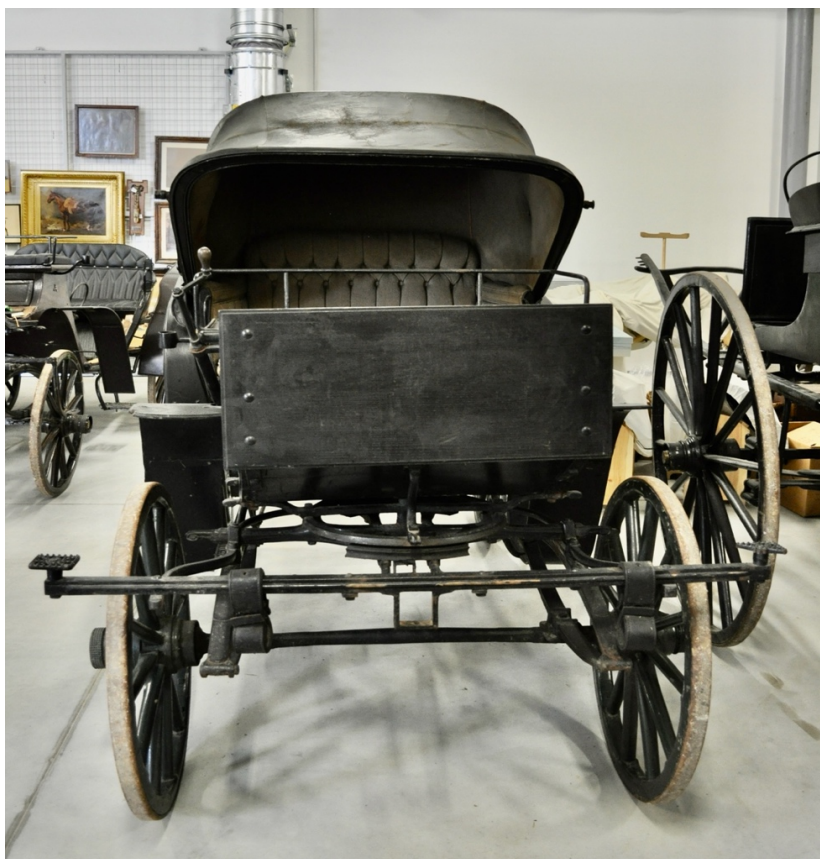
Obr.č.3. Na snímku celkový pohled na kočár – přední část, patrné chybějící váhy.