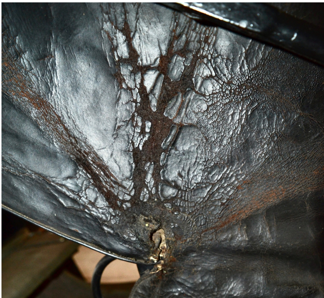
Obr.č.14. Detailní snímek zachycující poškození kožené střechy, odlupující se vrchní část usně, Viditelné poškození v místě kloubu.