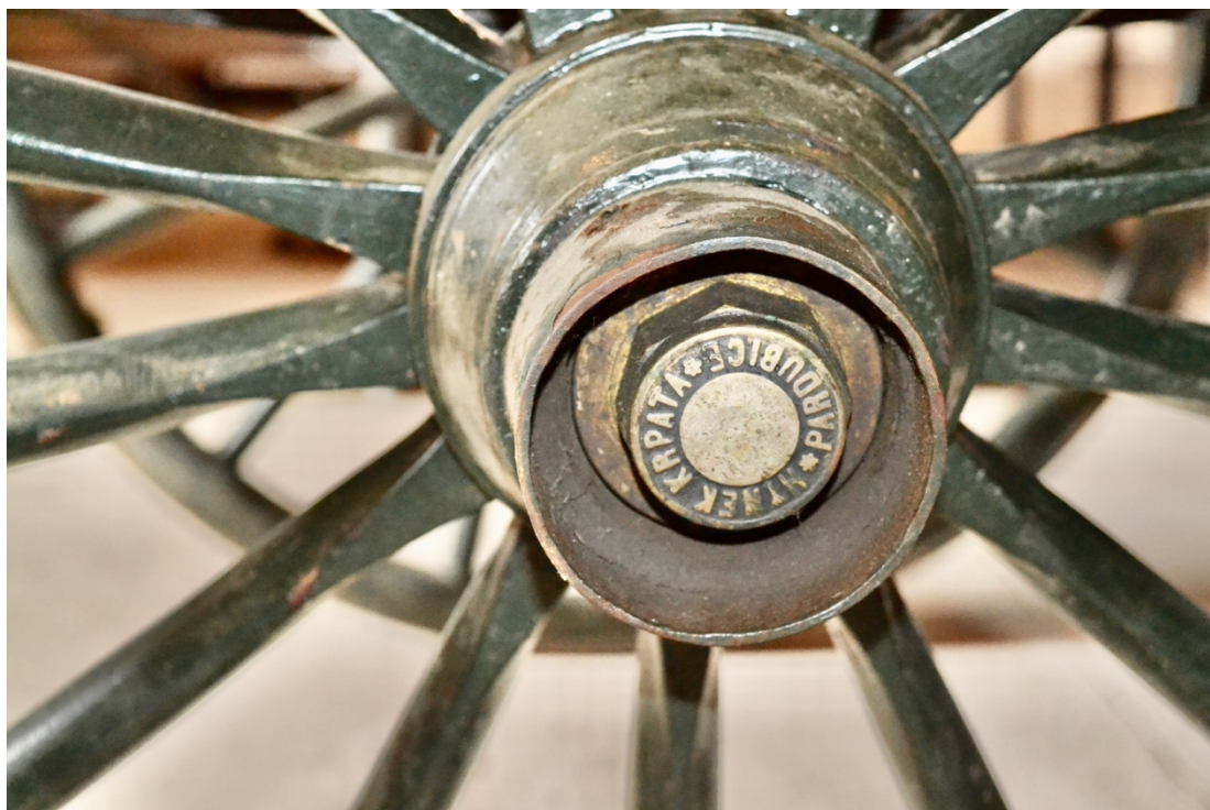
Obr.č.30. Detailní snímek zachycuje pohled na středy kol se zdobenými matky.