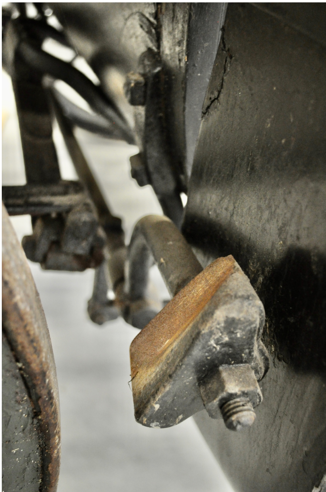
Obr.č.25. Na snímku detailní pohled na poškození železných brzdových špalků.