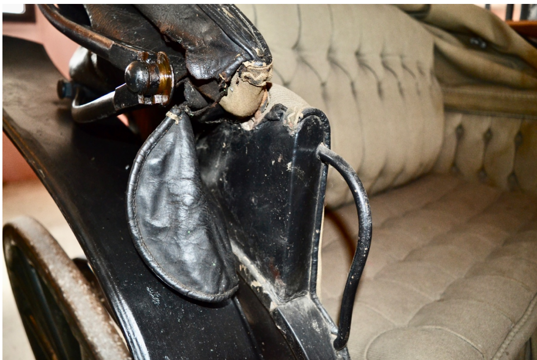
Obr.č.16. Na detailním snímku pohled na poškození kožené střechy, střecha ve složeném stavu odhalující poškození.