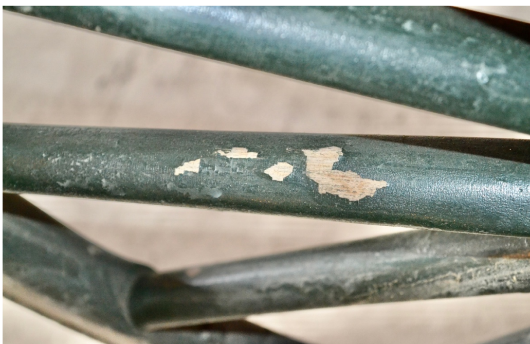
Obr.č.28. Na snímku detailní pohled na poškození lakové vrstvy na špicích kol.