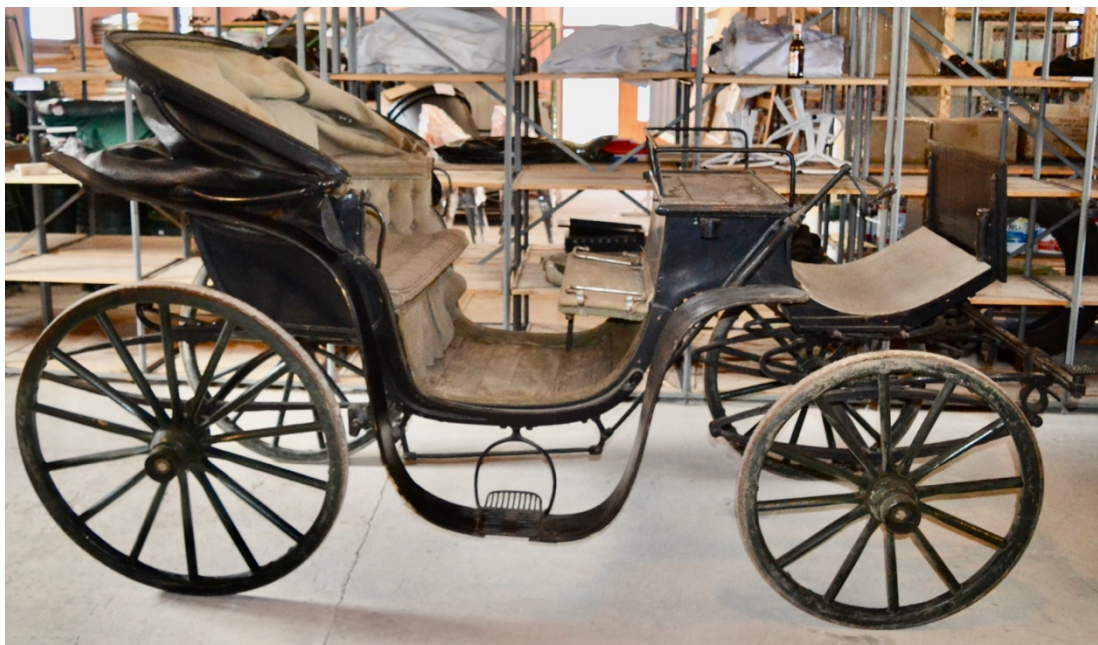
Obr.č.2 Celkový pohled na kočár stav před restaurováním se složenou střechou.