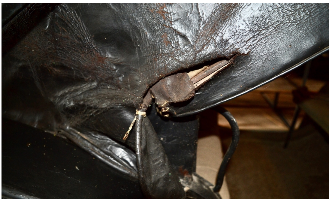
Obr.č.15. Detailní snímek zachycující další poškození kožené střechy, odlupující se vrchní část usně, Viditelné poškození v místě sklápějícího mechanismu.