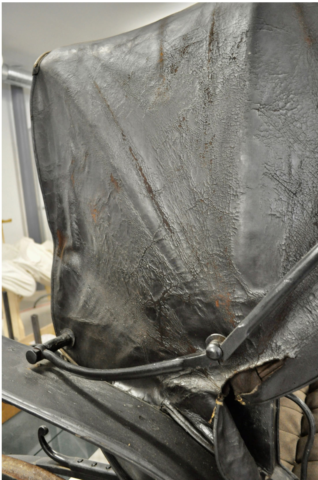
Obr.č.13. Na snímku celkový pohled na koženou střechu a její masivní poškození.