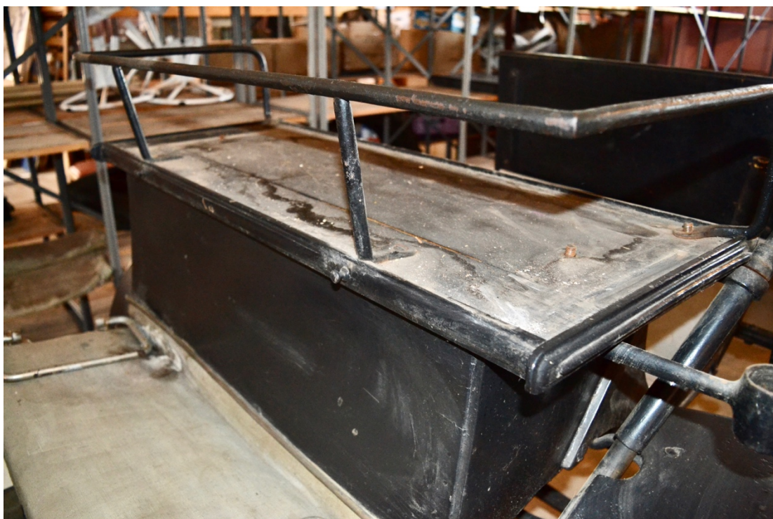
Obr.č.5. Na detailním snímku kozlík kočího s chybějícím podsedákem.