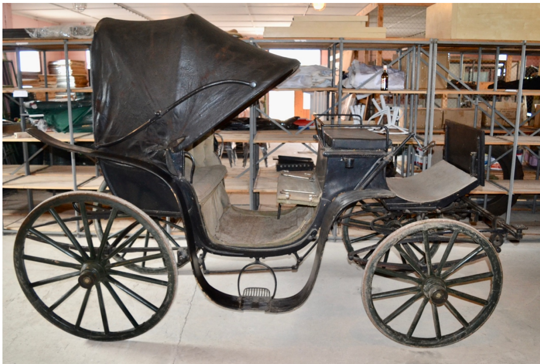
Obr.č.1. Celkový pohled na kočár stav před restaurováním s napnutou střechou.