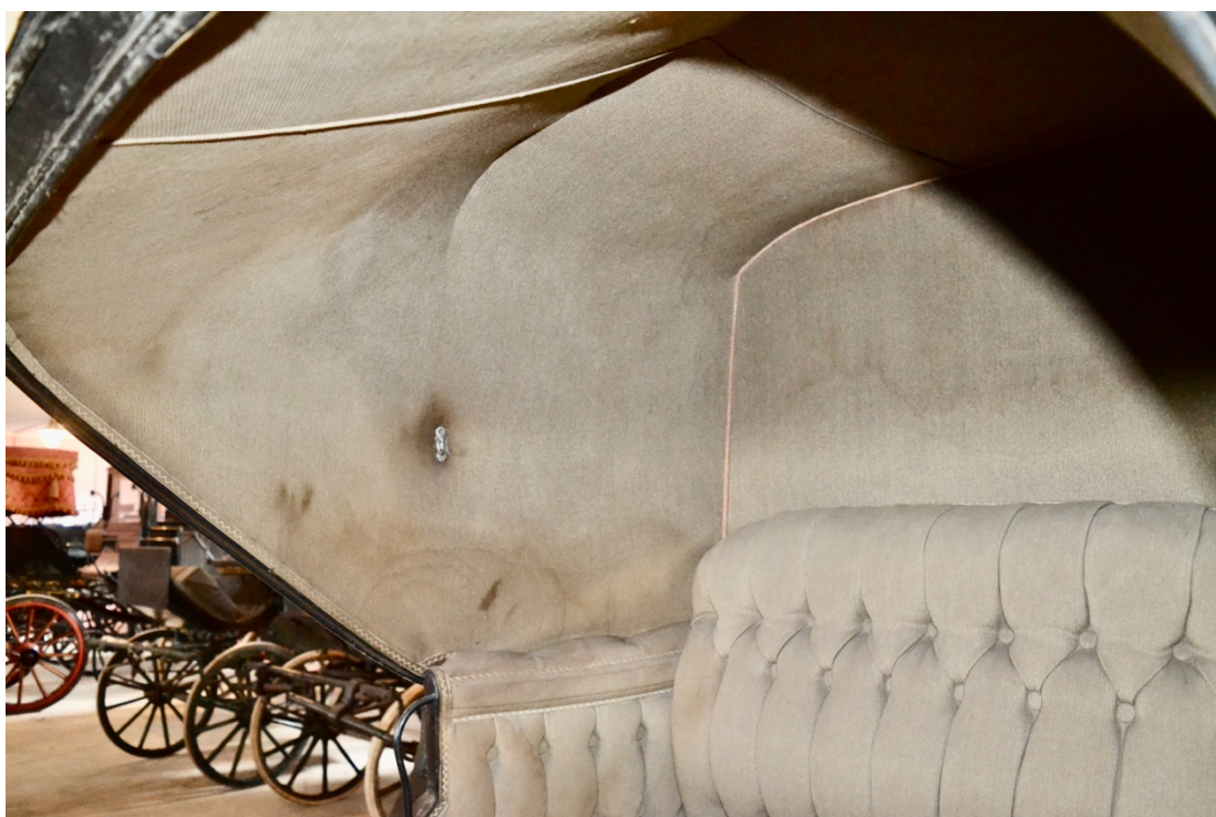
Obr.č.10. Na detailním snímku pohled na původní čalounění kožené střechy. Viditelné poškození od zatečení vodou a masivní znečištění prachovým depotem. Ve střední části snímku je patrný háček pro uchycení koženého tabliéru.