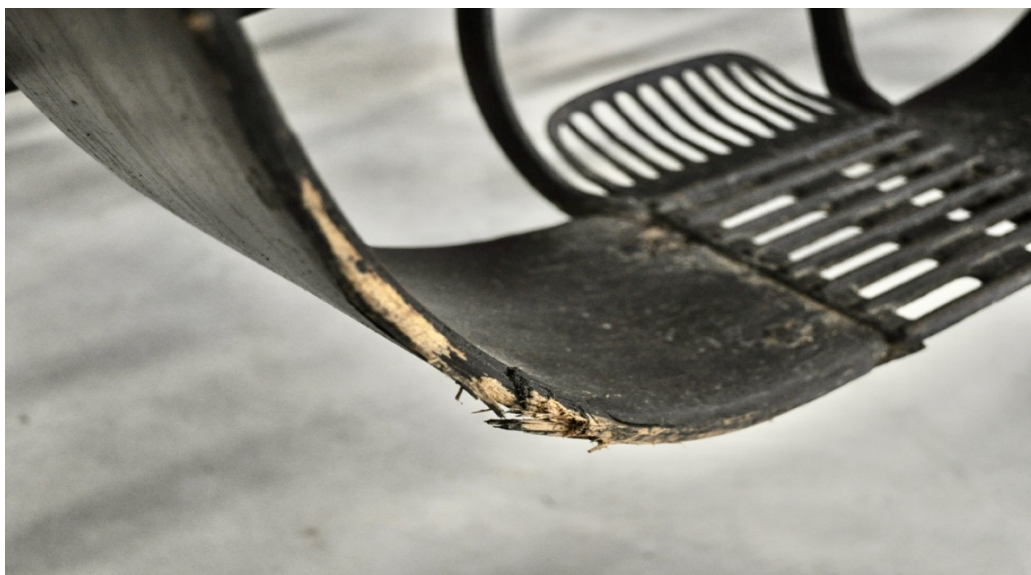
Obr.č.26. Na snímku detailní pohled na mechanická poškození ohýbaných blatníků.