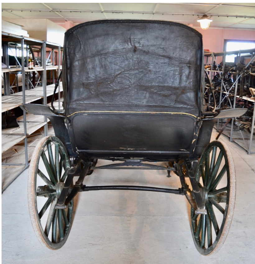
Obr.č.4 Na snímku celkový pohled na kočár – zadní část, patrné rozsáhlé poškození kožené střechy.