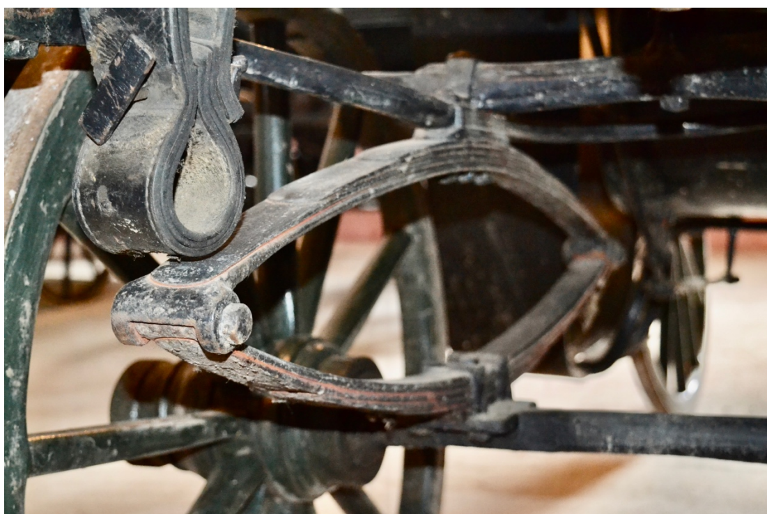
Obr.č.24. Na detailním snímku zachyceno poškození předních listových pér kočáru, snímek zachycuje rozsah poškození těchto podvozkových částí.