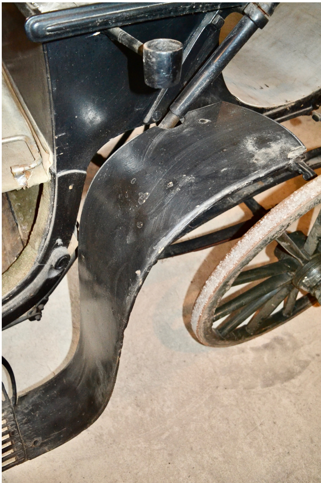
Obr.č.29. Na snímku celkový pohled na ohýbaný dřevěný blatník, na němž jsou patrná četná mechanická poškození. V horní části snímku držák nesoucí chybějící kočárové lampy.