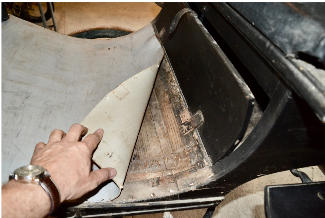
Obr.č.7. Na detailním snímku pohled na původní podlahu prostoru kočího, patrné nepůvodní panty dvířek pod kočím. Pod linoleem původní kožené lemy.