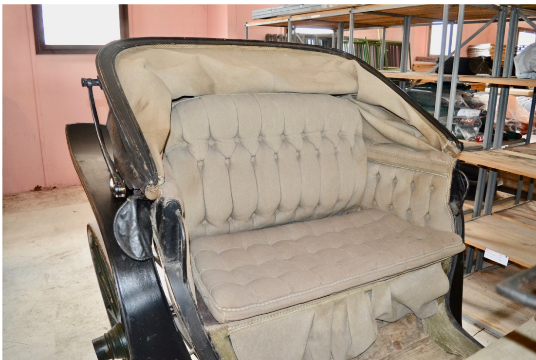
Obr.č.11. Na snímku pohled na prostor pro cestující s původním čalouněním, stav se složenou střechou.