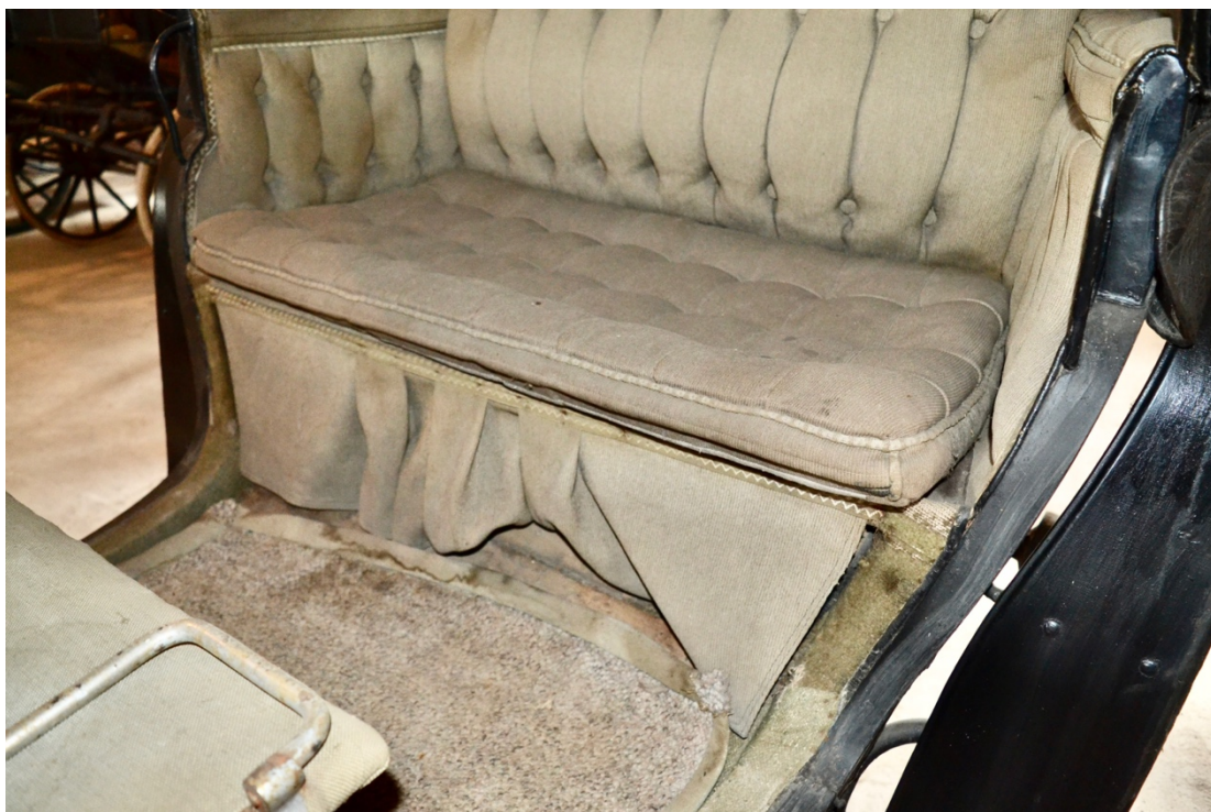
Obr.č.12. Na detailním snímku pohled do prostoru pro cestující, pod sedákem pro cestující je patrný původní koberec.