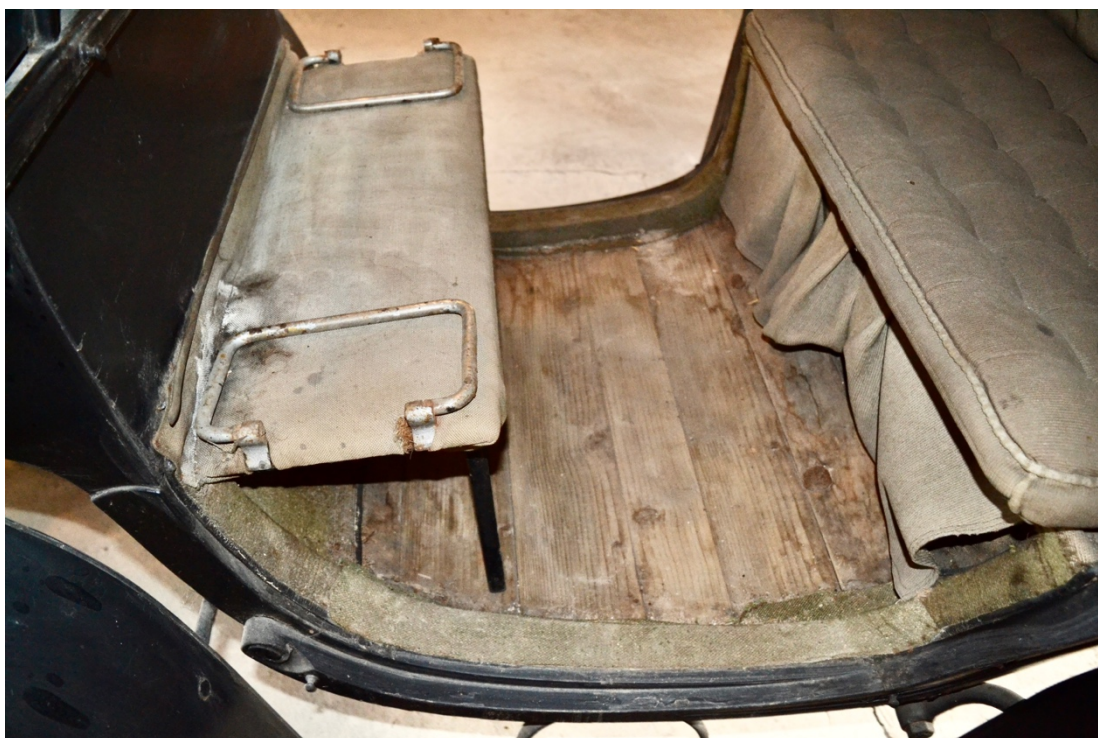
Obr.č.8. Na detailním snímku pohled na prostor před cestujícími, chybějící kočárové linoleum a vkládací koberce. Patrný rozsah poškození dřevěné podlahy a patrné nepůvodní čalounění pomocného sedátka, v levém a pravém rohu snímku jsou patrné fragmenty původních koberců.