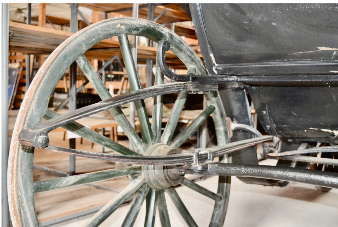
Obr.č.22. Na snímku jsou zachycen detail zadního pérování, viditelné pravděpodobné prověšení zadních pér.