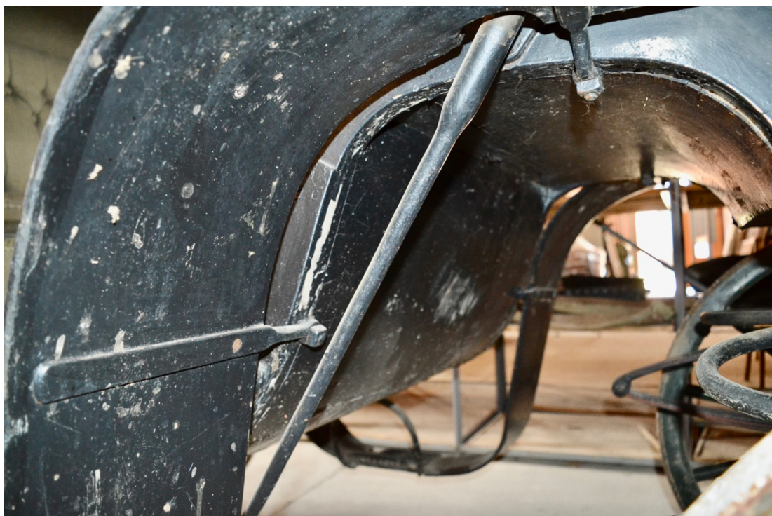
Obr.č.23. Na snímku detail dřevěného ohýbaného blatníku, na kterém jsou viditelné četné mechanické poškození, odlupování lakové vrstvy.