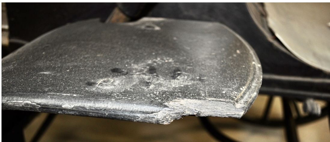
Obr.č.18. Na detailním snímku je zachyceno poškození hrany zadního blatníku - mechanické poškození způsobené odlomením.