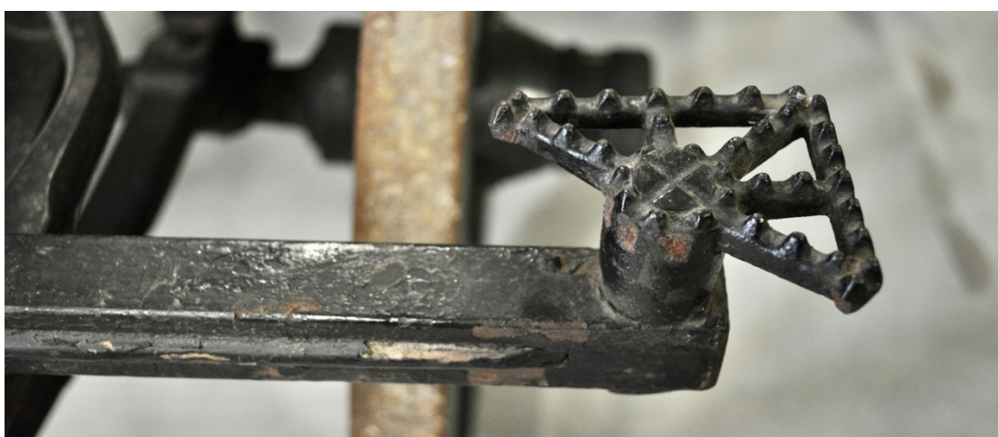
Obr.č.19. Na snímku detail poškození odlomené stupačky.