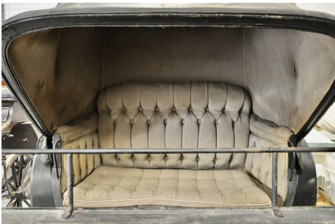
Obr.č.9. Na detailním snímku pohled na prostor pro cestující s původním čalouněním.