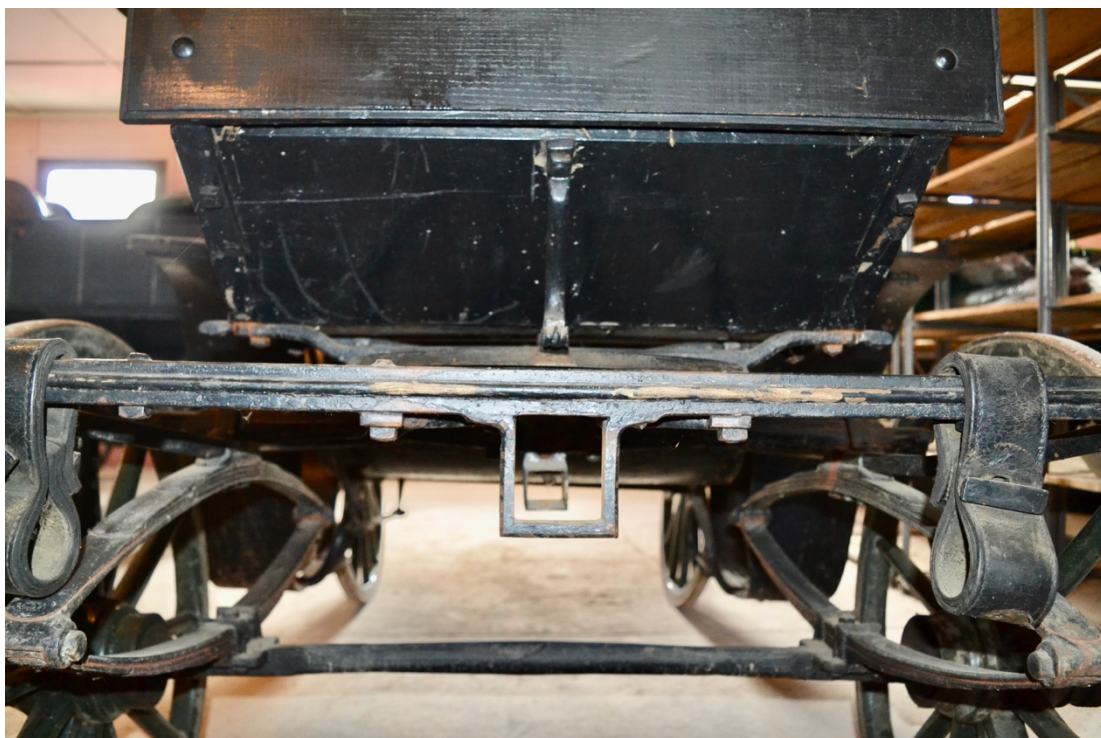
Obr.č.21. Na detailním snímku je zachyceno přední část kočáru a jeho poškození. Na snímku viditelné původní kožené řemeny držící váhy.