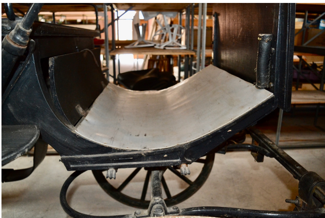
Obr.č.6. Na detailním snímku pohled na podlahu prostoru kočího, nepůvodní novodobé linoleum.