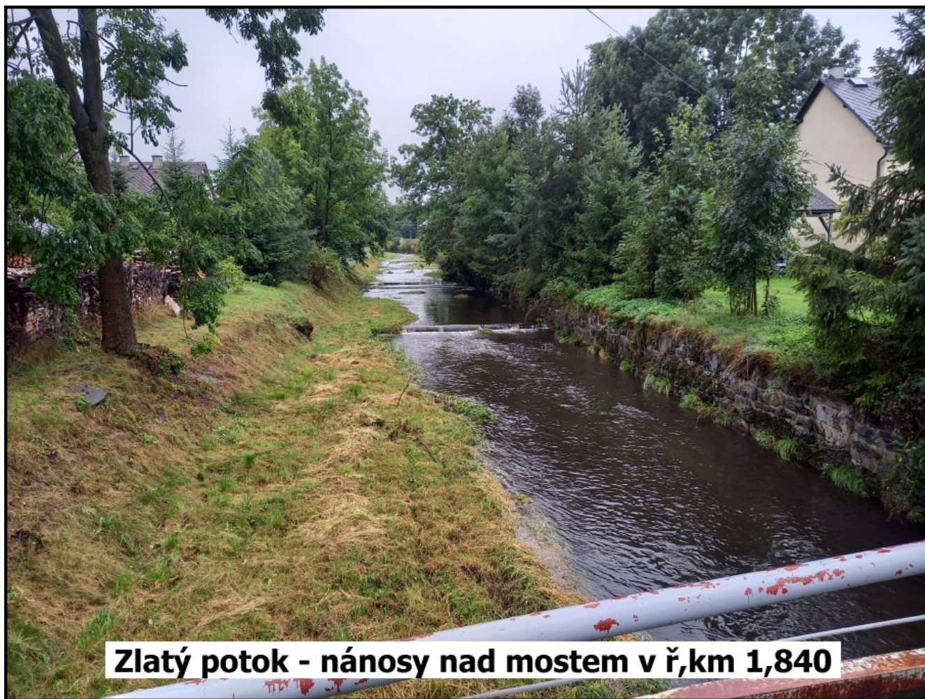
Zlatý potok - nánosy nad mostem v ř,km 1,840