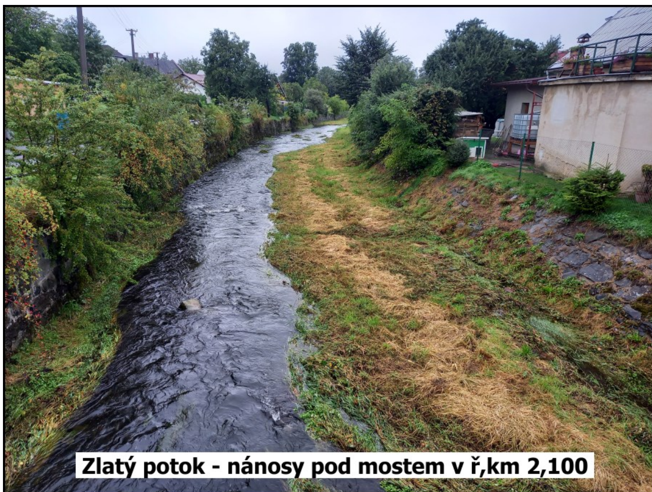
Zlatý potok - nánosy pod mostem v ř,km 2,100