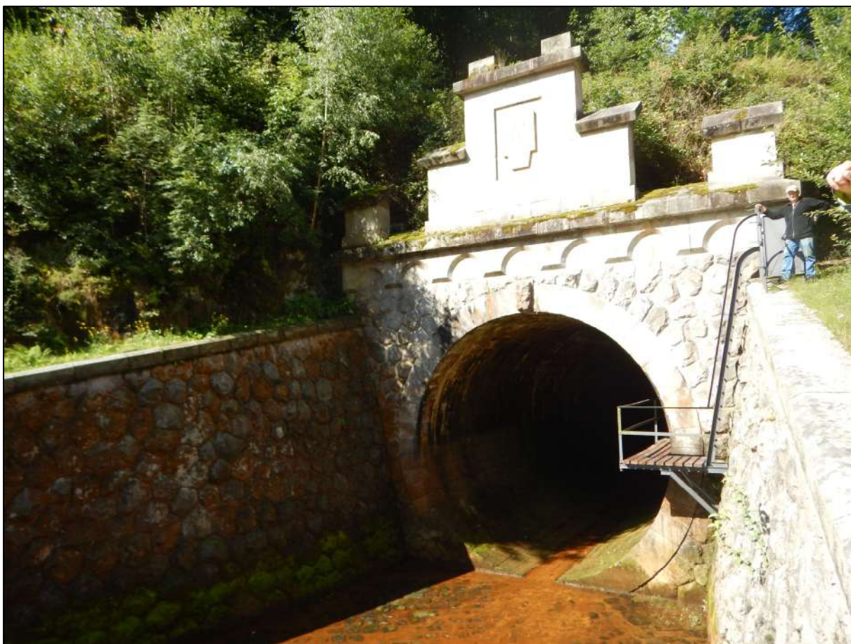
Obr. 1: Celkový pohled na portál tunelu a přístupovou lávku