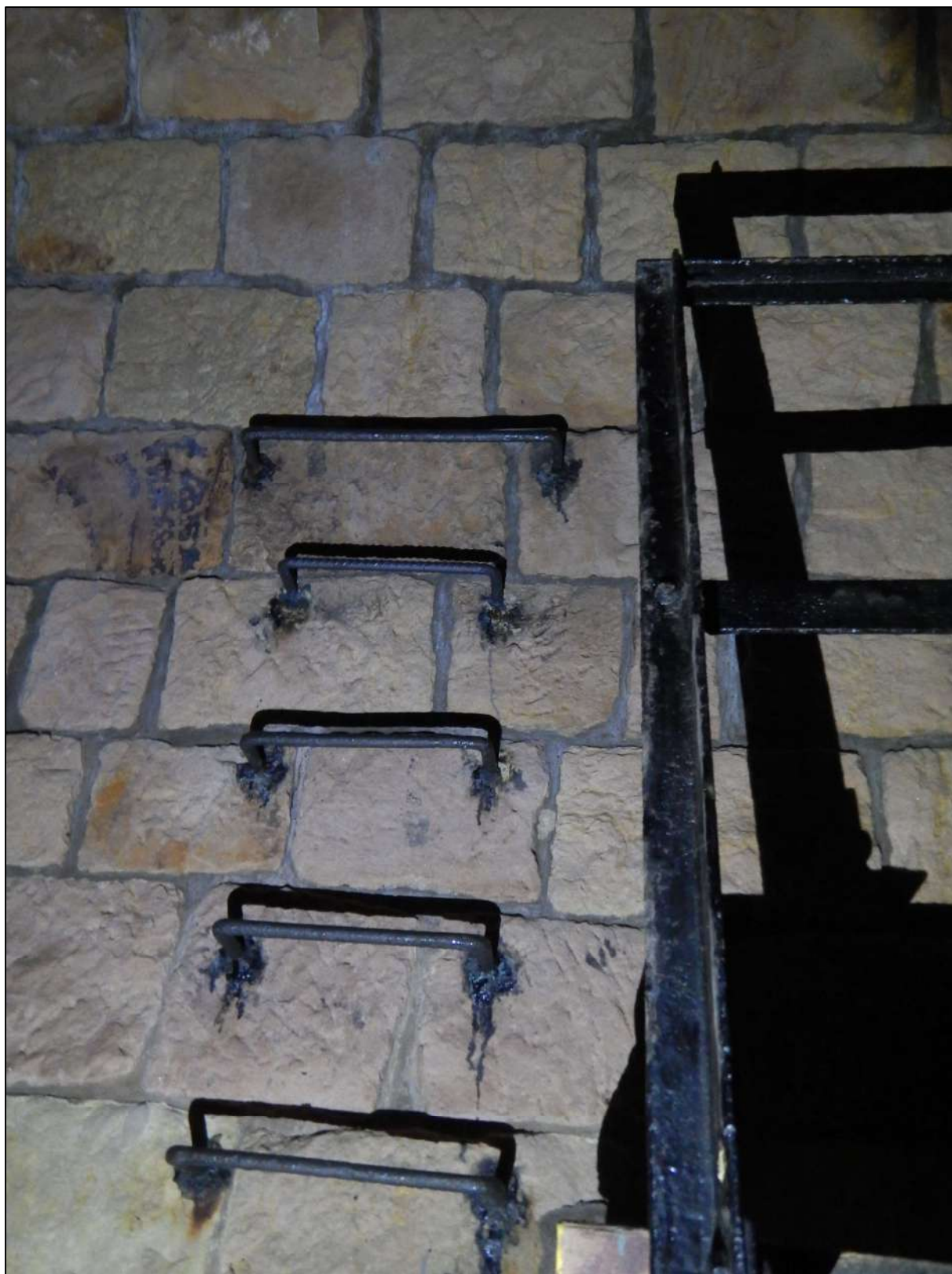
Obr. 3: Stávající stupadlový žebřík na konci lávky