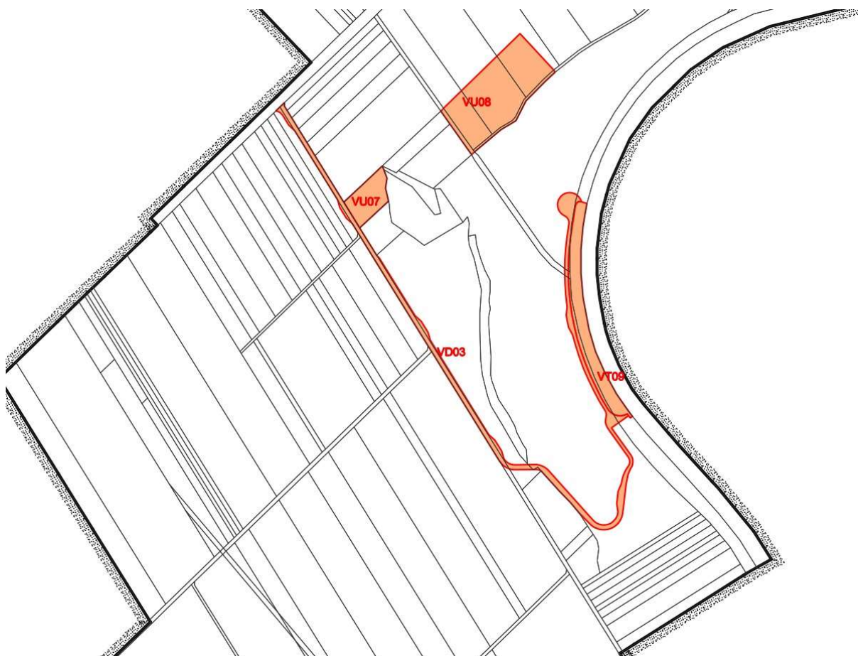
Obrázek 3: Územní plán řešeného území (výkres veřejně prospěšných staveb)

Projektová dokumentace je zpracována v souladu s vyhláškou č. 501/2006 Sb., o obecných požadavcích na využití území, v platném znění.