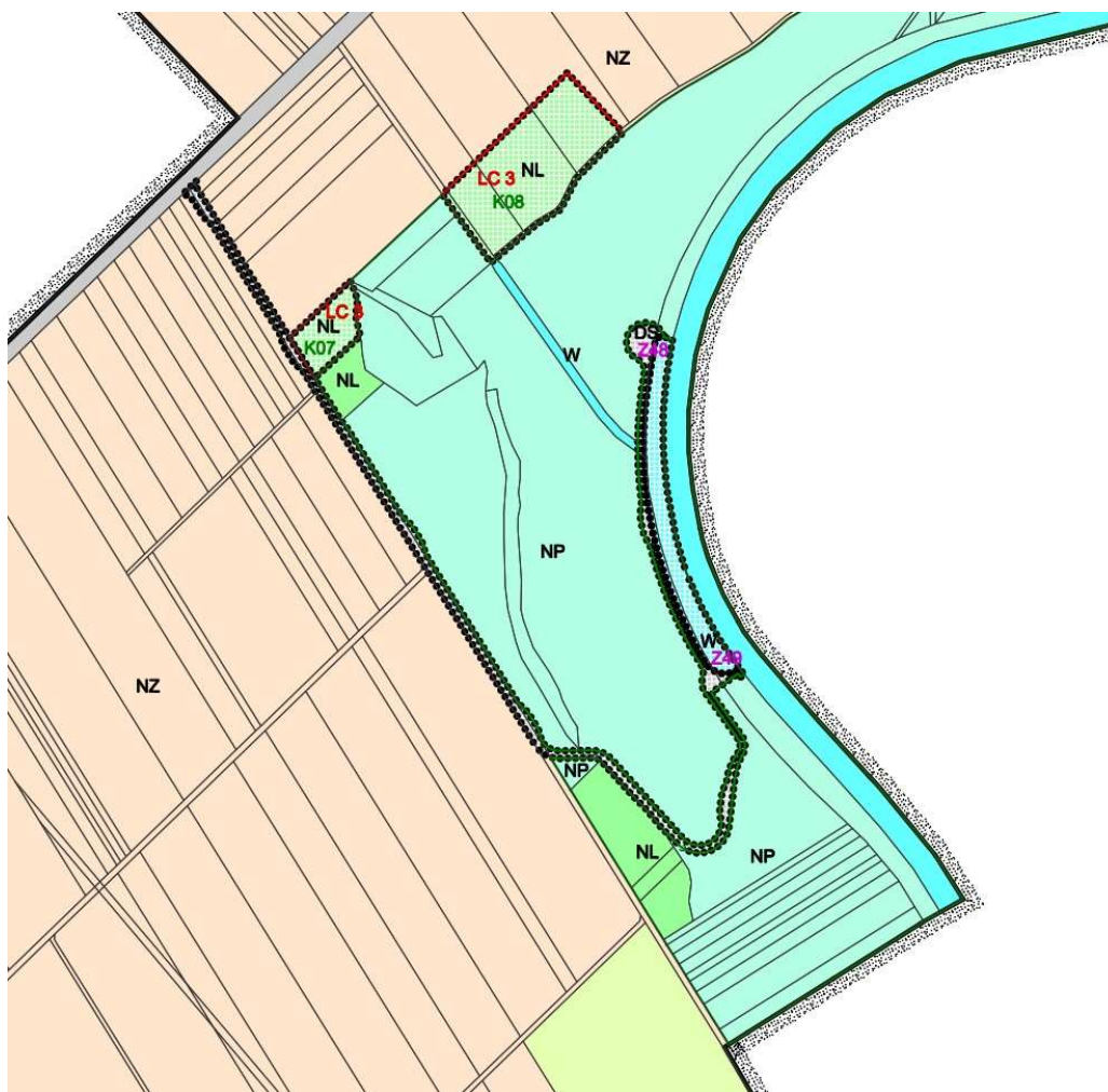
Obrázek 2: Územní plán řešeného území (hlavní výkres)

Umístění stavby je v souladu se schválenou územně plánovací – Územním plánem obce Prosenice. Navržená stavba se podle územního plánu nachází v plochách změn DS – dopravní infrastruktura – silniční a W – plochy vodní a vodohospodářské. Plochy DS jsou určeny jako pozemky silniční dopravy a plochy W mají jako hlavní využití vodní plochy a koryta vodních toků a pozemky. V těchto plochách je umístění stavby dle vyhlášky č. 501/2006 Sb., o obecných požadavcích na využívání území, ve znění pozdějších předpisů, přípustné.