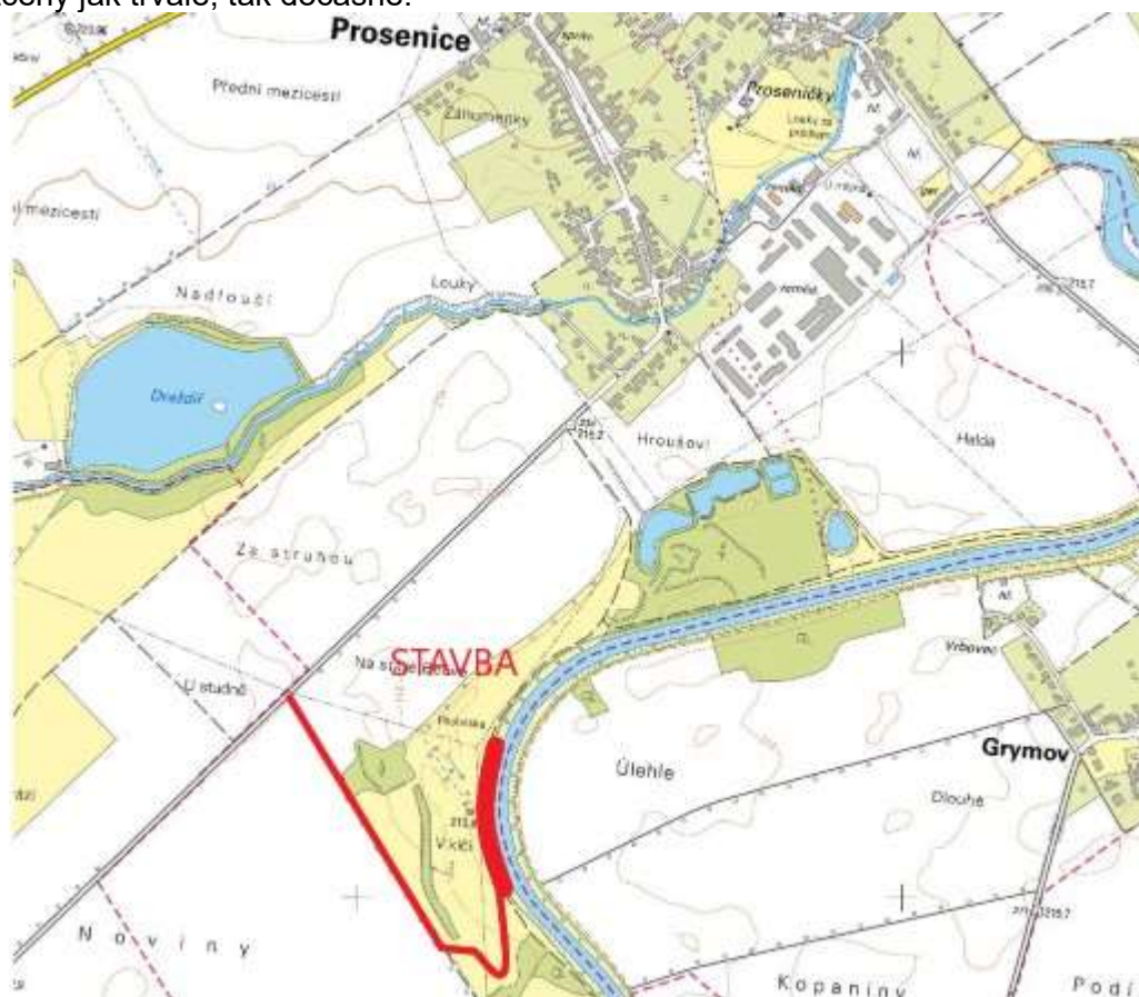
Obrázek 1: Lokalizace řešeného území

Zájmové území se nachází v Olomouckém kraji, okrese Přerov, v katastrálním území Prosenice. Zájmová lokalita se nachází v jižní části katastru, na pravém břehu konkávního oblouku řeky Bečvy. Přístupová komunikace je navržena ze silnice č. III/04724. Navržená opatření se nachází v území nezastavěném, charakteru trvalý travní porost, ostatní plochy, vodní plocha. Dotčené pozemky budou z důvodu provedení výstavby a přístupu na stavbu dotčeny jak trvale, tak dočasně.