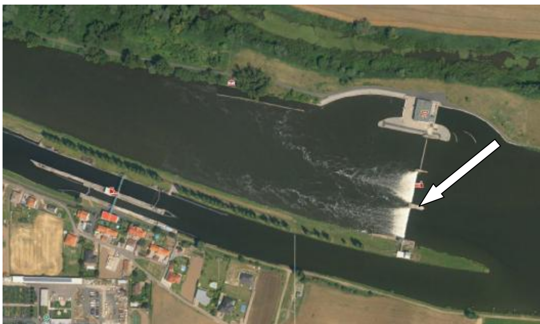
VD Dolní Beřkovice . ortofotomapa vodního díla