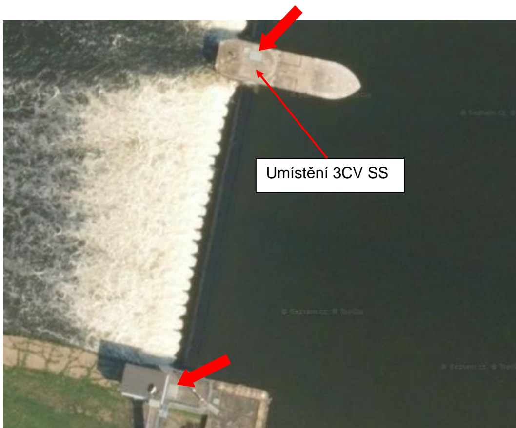
HSJ České Kopisty – přístup do jezu