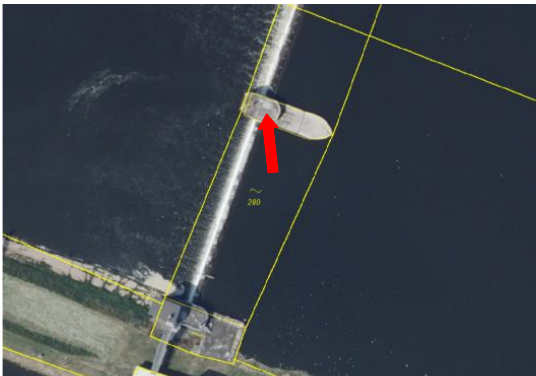
st.p.č.280, k.ú. České Kopisty