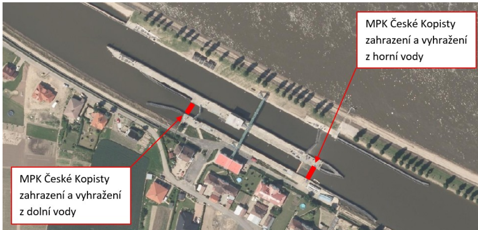
Příloha 24.3 – Rozsah potápěčských prací