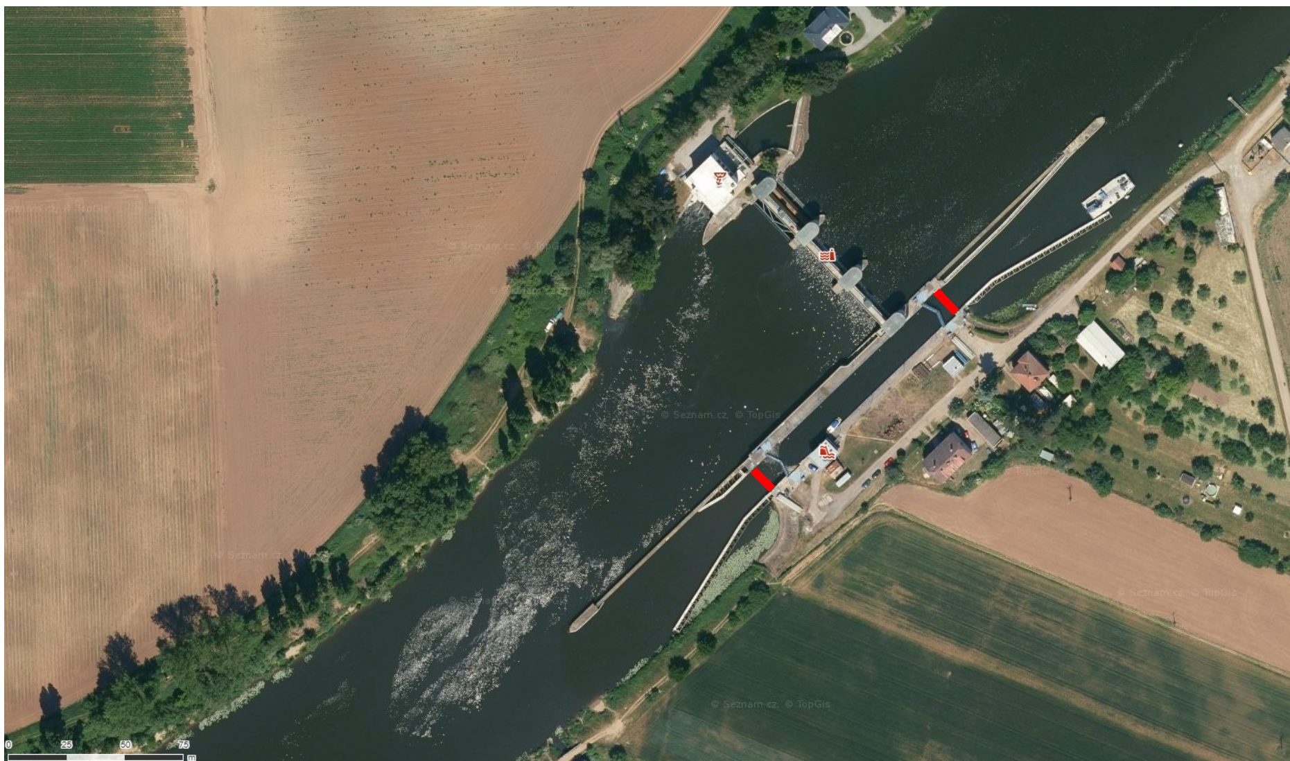
Příloha 14.4 – Rozsah potápěčských prací