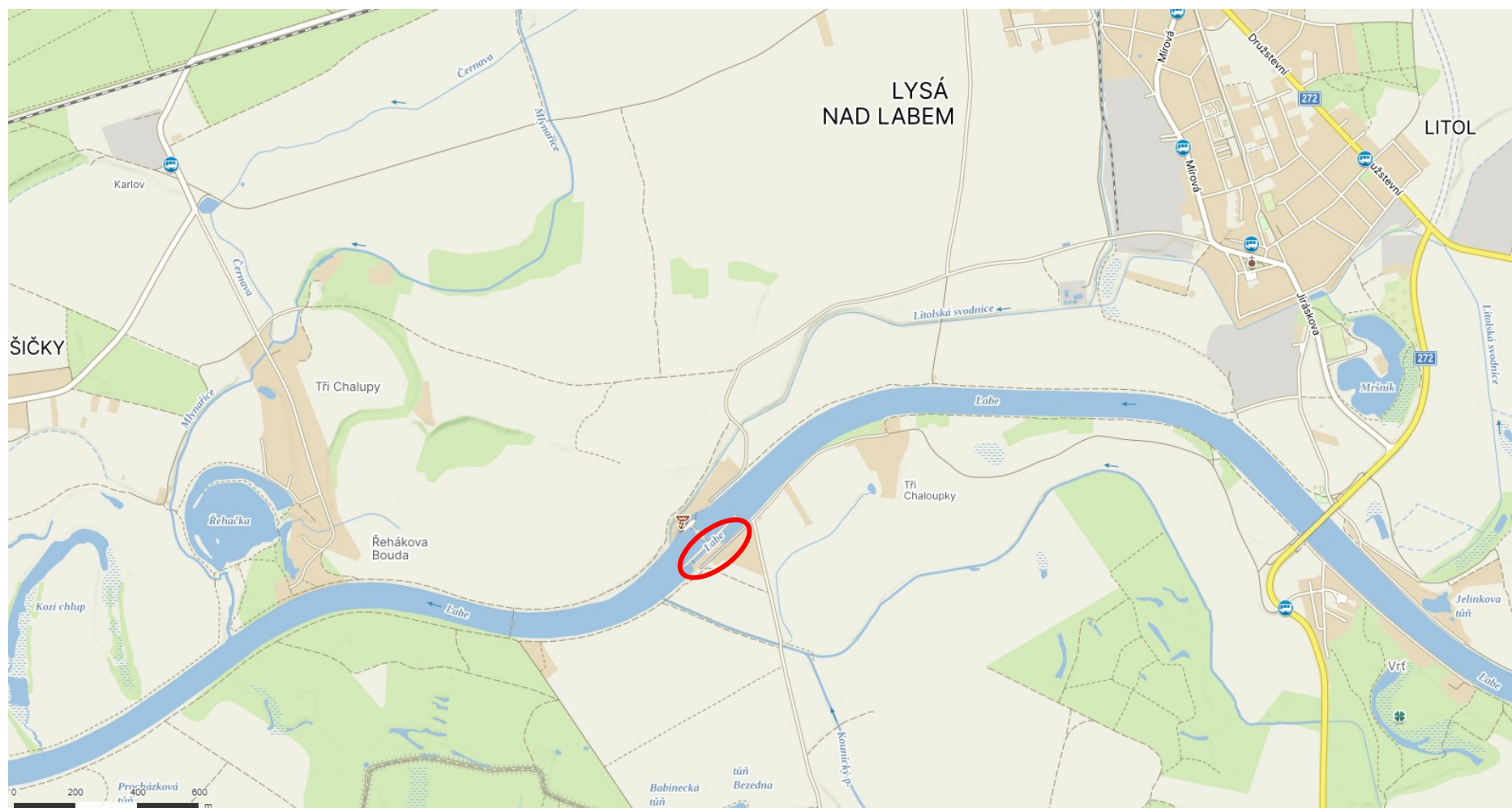
Příloha 14.1 – Situace vodního díla