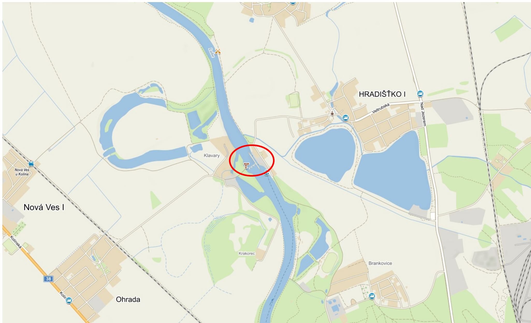
Příloha 9.1 – Situace vodního díla