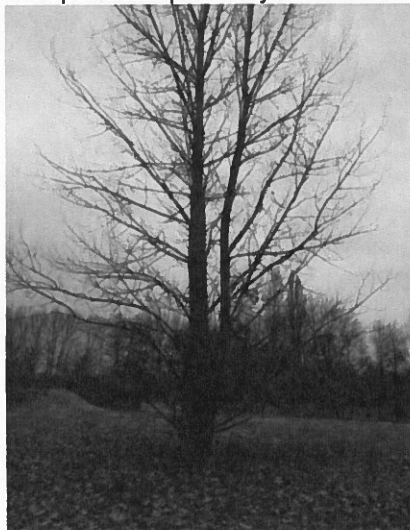
Topol osika povolený ke kácení