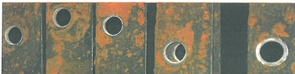
foto č. 7-detail vmezovacího kroužku