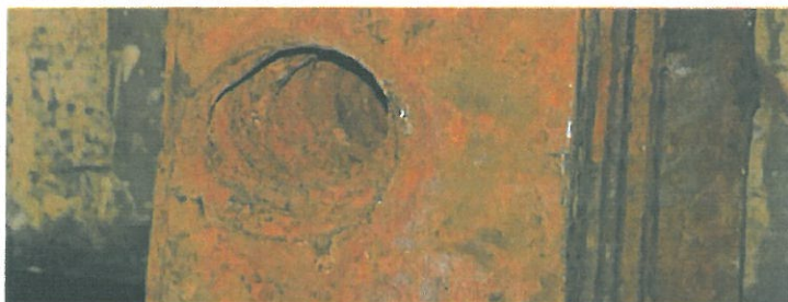
foto č. 6-vrtání česlí nad hladinou