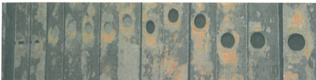
foto č. 5-detail levého dílu česlí