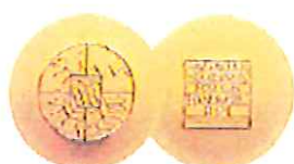
Bayerischer Staatspreis 2003 für technische Innovation