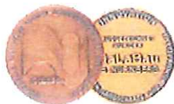
GaLaBau 1998 für Hydro Athlet