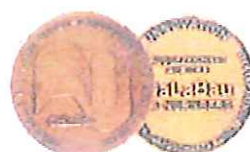
GaLaBau 1991 für 4K 514 LS