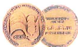
GaLaBau 1992 für KWO/KWA u. KFD