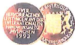
Bayerischer Staatspreis 1993 für technische Innovation