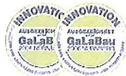
GaLaBau 2004 + GaLaBau 2006 für Aktiv Turmatoumlenkung

ROBERT PREČAN - VPD servis VELKOORCHOD - MALOORCHOD U Beroňky 419, 777 72 Volký Lhovec IČ: 765 33 581, DIČ: CZ7803225375 Tel: 777 105 959, 777 808 491