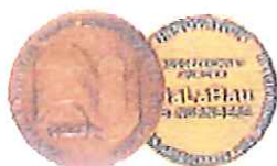
GaLaBau 1998 für Hydro Athlet