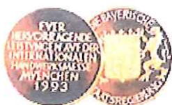
Bayerischer Staatspreis 1993 für technische Innovation