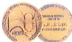
GaLaBau 1992 für KVO/KVA u. KFD