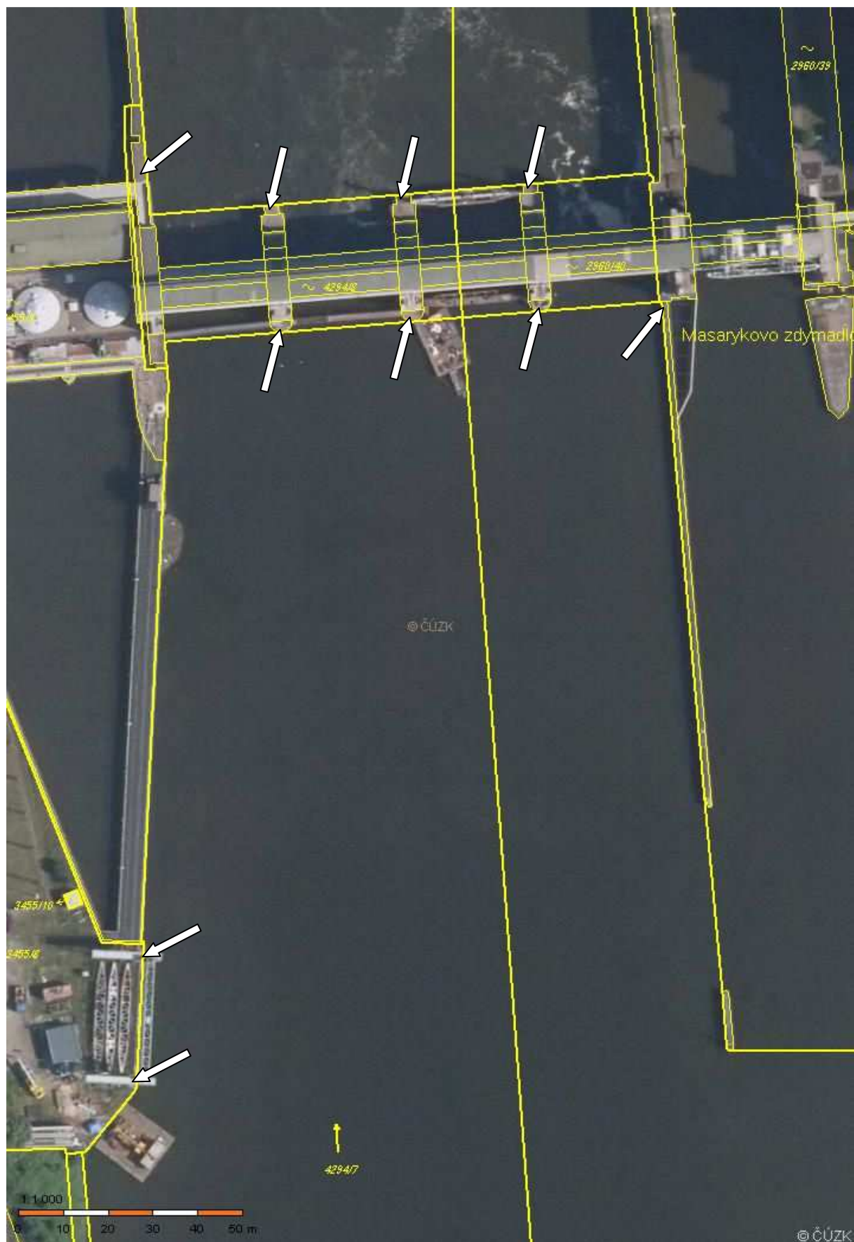
VD Střekov - ortofotomapa (šipky určují místa umístění vázacích kruhů)