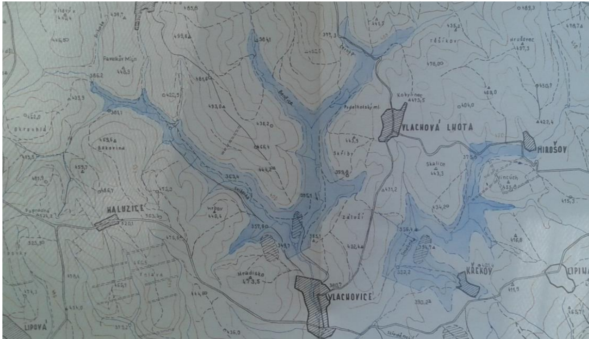
Obr. 02: Dříve zvažovaný rozsah VD Vlachovice [41]