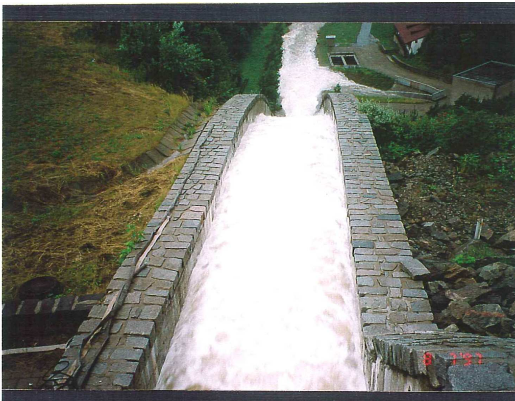
VD Boskovice – bezpečnostní přeliv a skluz při hladině 430,81 m n.m., dne 8.7.1997