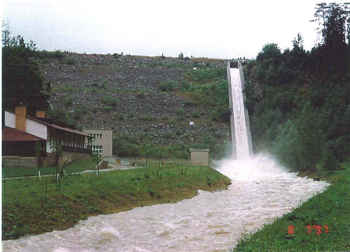
VD Boskovice – skluz a odpadní koryto při hladině 430,81 m n.m., dne 8.7.1997