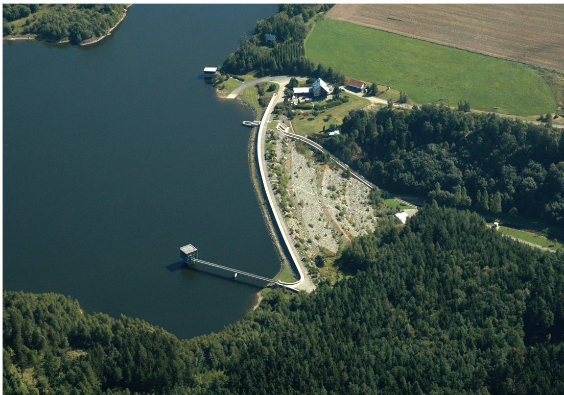
VD Boskovice – letecký pohled na hráz