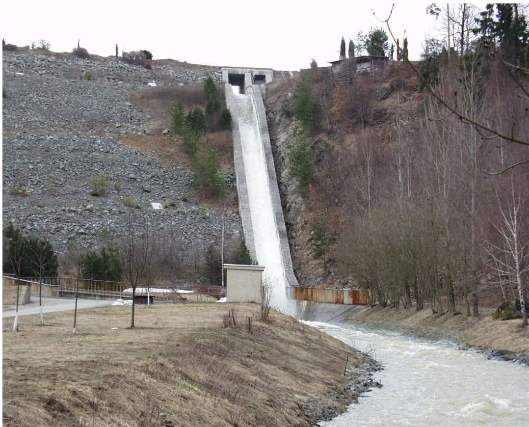
VD Boskovice – skluz