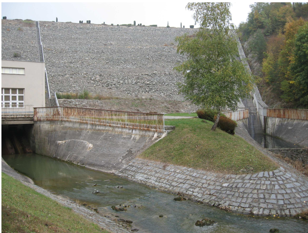
VD Boskovice – strojovna spodních výpustí – odpadní koryto