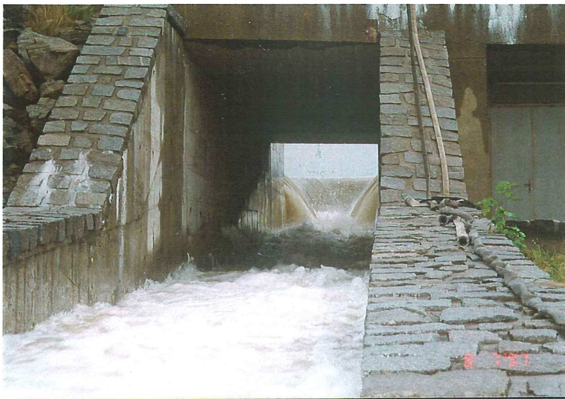
VD Boskovice – bezpečnostní přeliv a skluz při hladině 430,81 m n.m., dne 8.7.1997