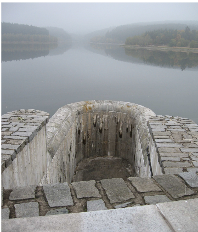
VD Boskovice – bezpečnostní přeliv