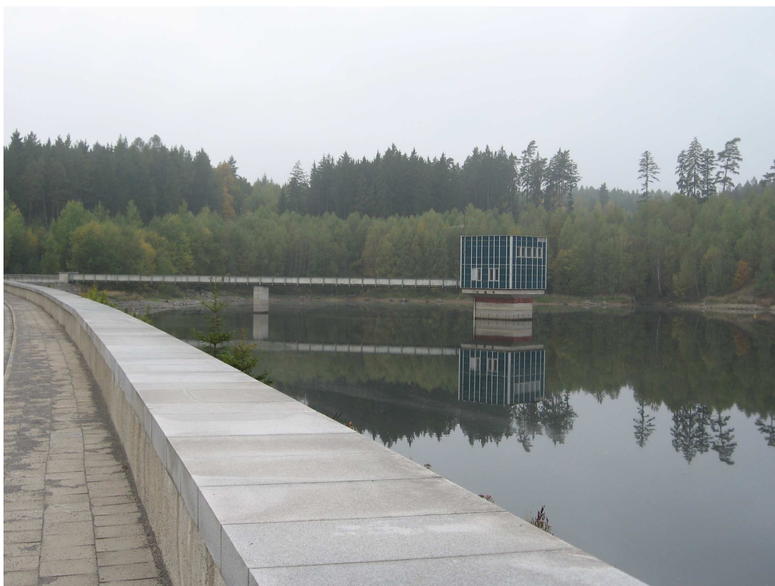
VD Boskovice– odběrná věž