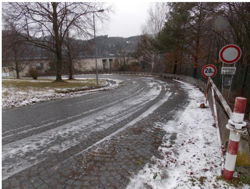
Obr.4 – Příjezd k hrázi – místo zásypů kryté části skluzu a gabionové stěny na rozhraní kryté a otevřené části skluzu (S002 a S003)