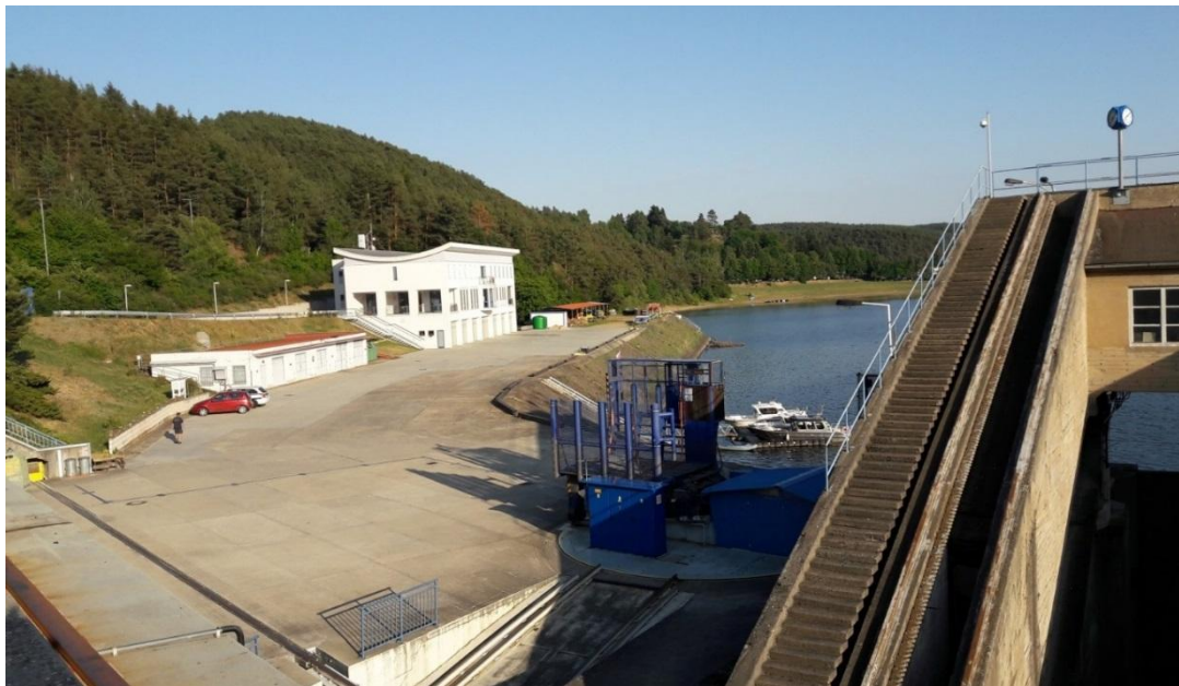
Obr. 1 – Celkový pohled na prostor budoucího vtokového objektu a kryté části skluzu

V ploše staveniště se nachází stávající objekt garáží, který bude v rámci stavby (SO 08) bourán