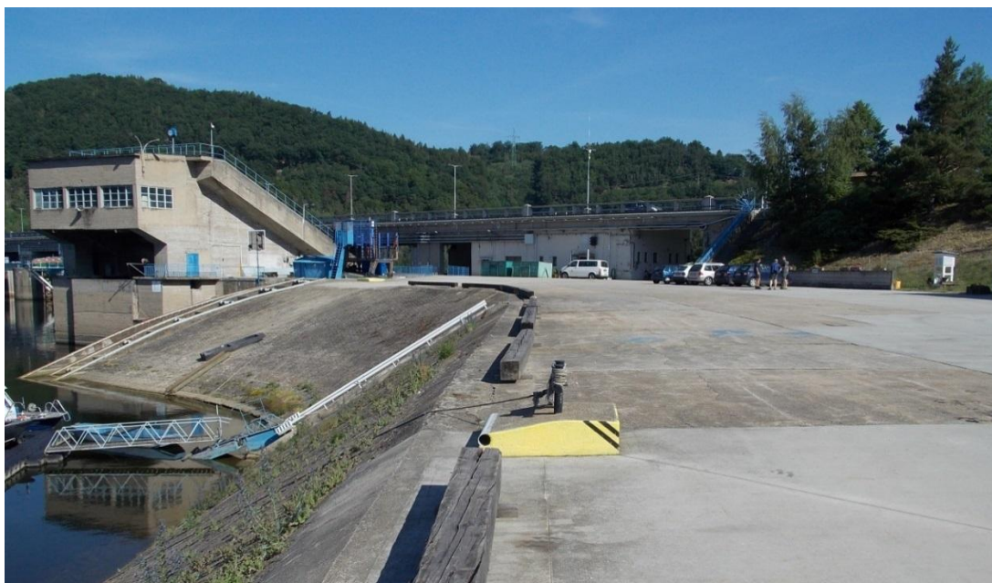
Obr.2 – Oblouk břehu – místo nátoky do vtokového objektu