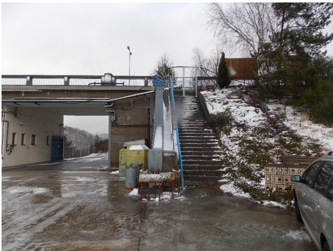
Obr.3 – Průjezd pod hrází – místo skladů pod přemostěním hráze