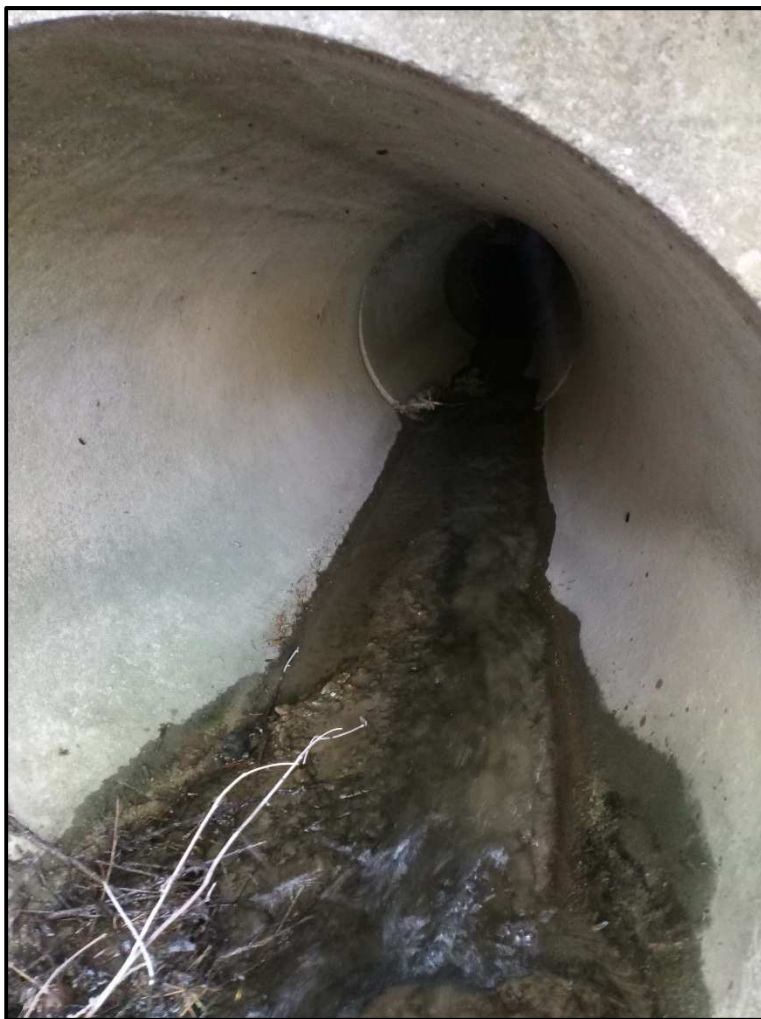
začátek zatrubnění km 0,173, pohled po toku do potrubí DN 800 – (SO02)

Poznámka: Obsah projektové dokumentace je upraven v souladu s vyhláškou 499/2006 Sb. V platném znění a je přizpůsoben druhu, rozsahu a významu stavby. 86/1992 Sb