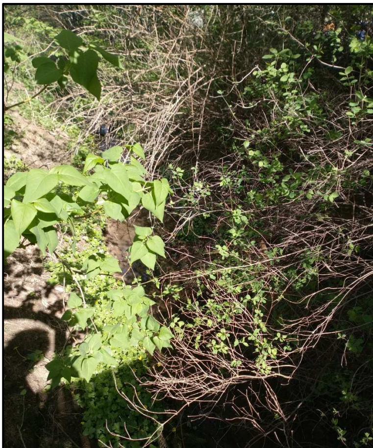
začátek zatrubnění km 0,175, pohled proti toku na zarostlé koryto