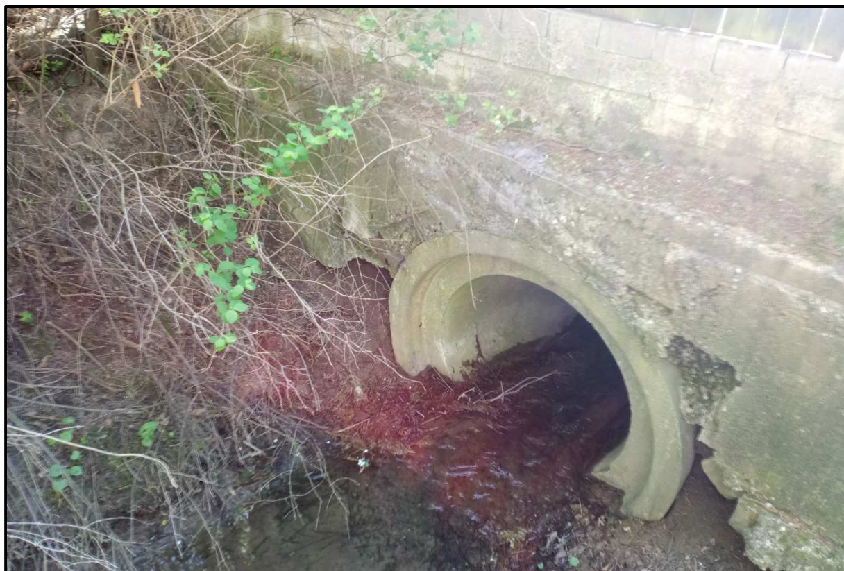
začátek zatrubnění km 0,173, pohled po toku na část potrubí DN 800 – (SO02)