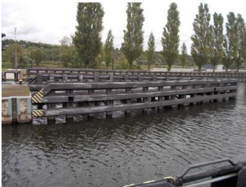
HO středové svodidlo MPK i VPK z LB MPK