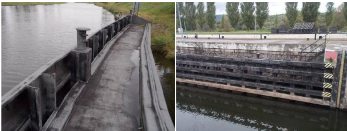
Ilustrační foto stavu OK svodidel

Stav svodidel lze charakterizovat stupněm zkorodování "C" se zbytky původních nátěrů.