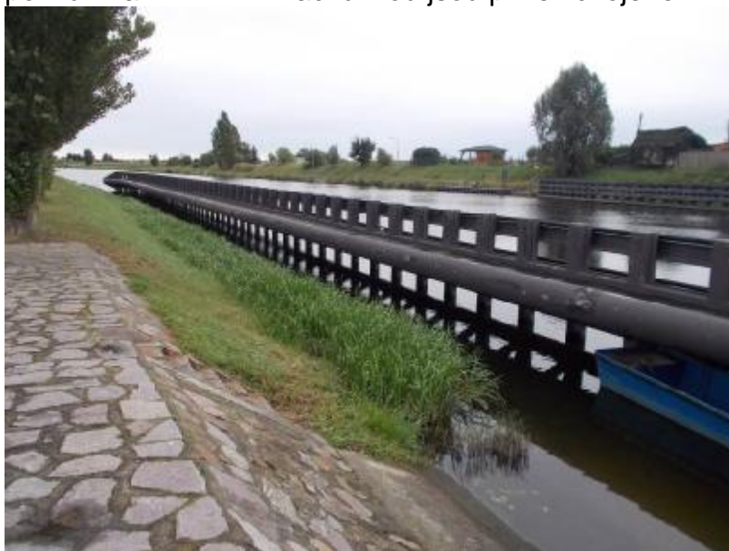
HO VPK pravé svodidlo z břehu proti vodě