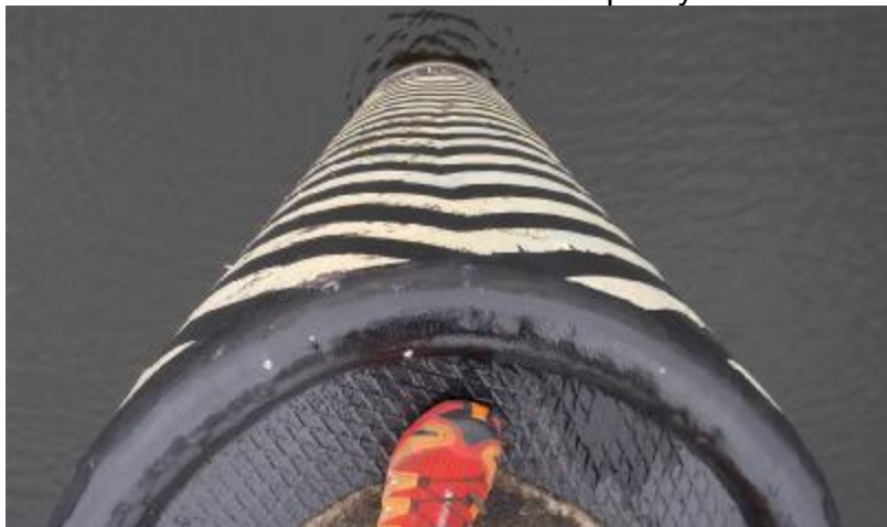
Špice zdi VPK v DO