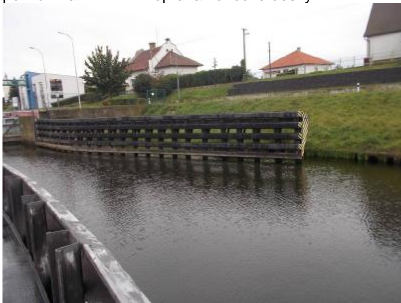
DO MPK LB z PB svodidla