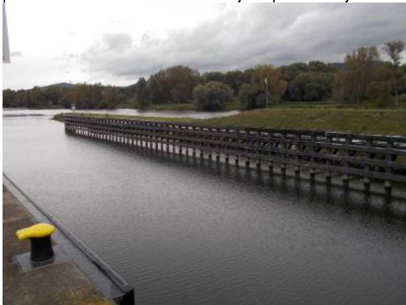
DO VPK pravé svodidlo z dělicí zdi PK