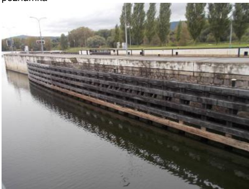
DO MPK pravé svodidlo z LB MPK