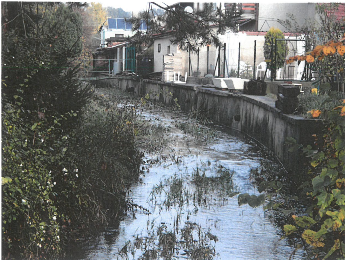
Nánosy podél opěrné zdi