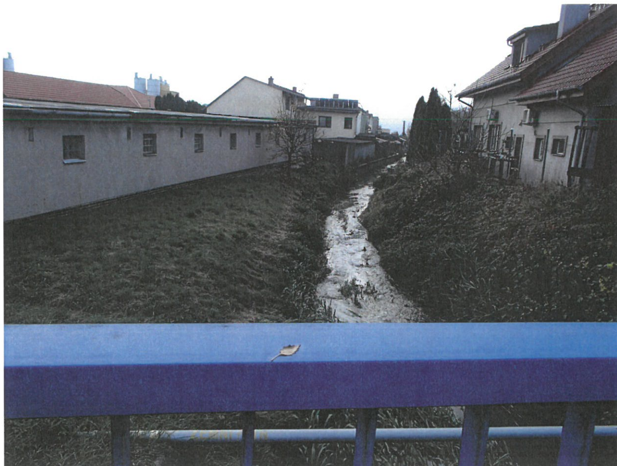
Začátek úseku investice, opevnění ř.km. 2,530 u silničního mostu v Drahotuších