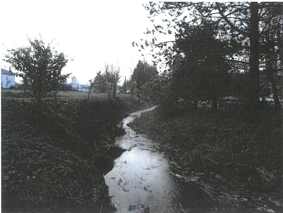
Opevněné vyústění bezpečnostního přepadu z VN Drahotuše