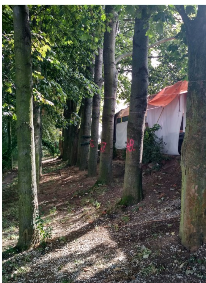
Střední část bez podrostu s přisýpanými bázemi