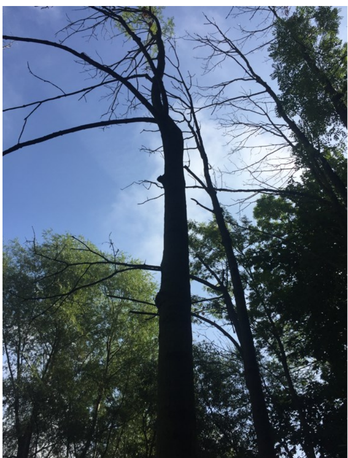
Zbytkové olistění u jasanu s vlajkovitou korunou