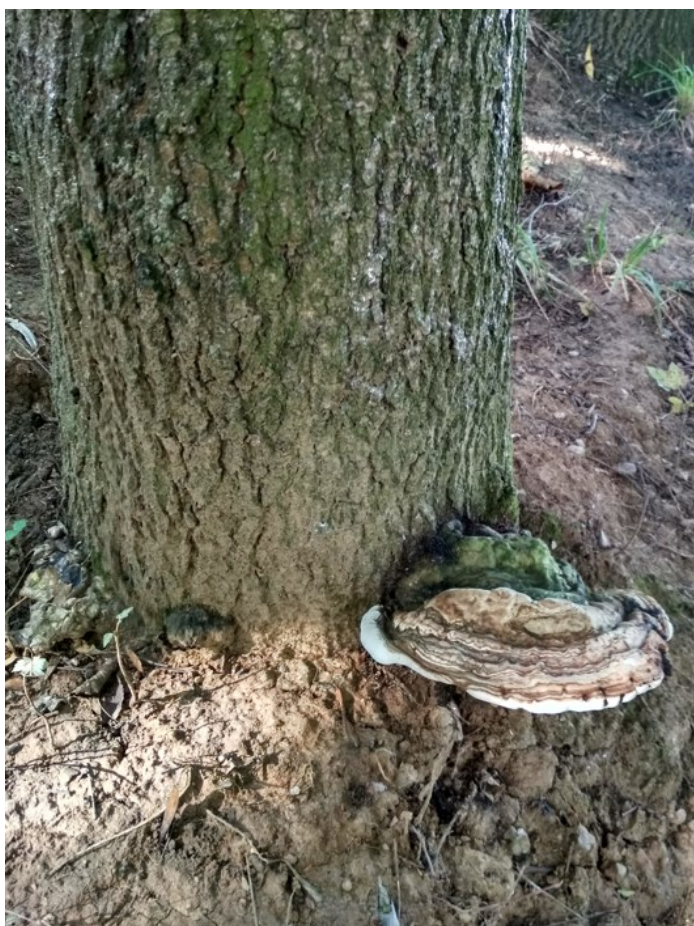
Plodnice u báze kmene a přisypaná báze