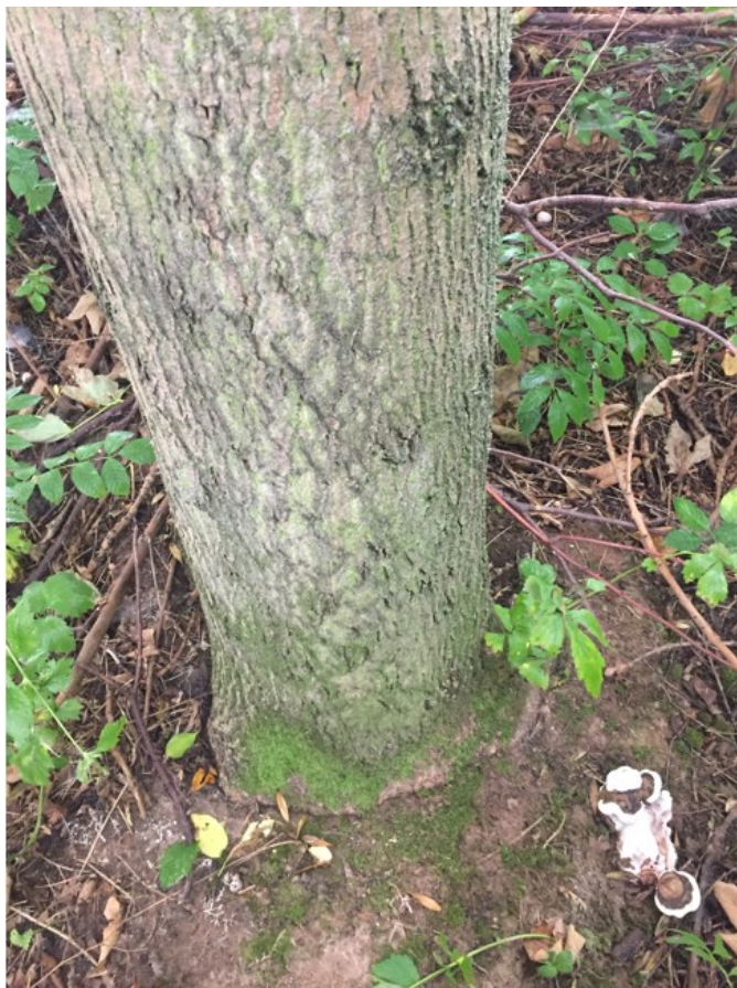
Plodnice dřevokazných hub na kořenových náběžích