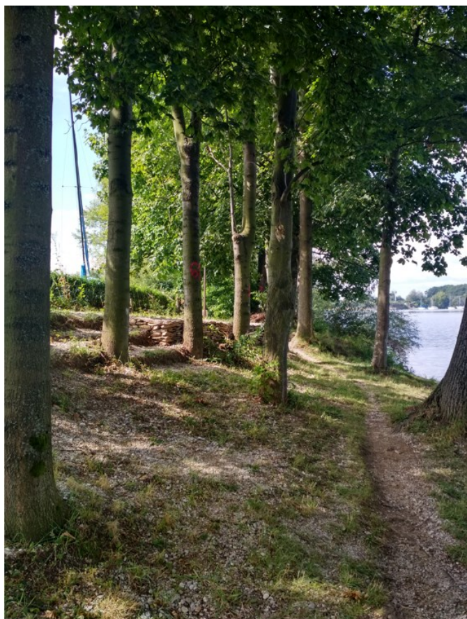
Část bez podrostu s neoprávn. úpravami terénu