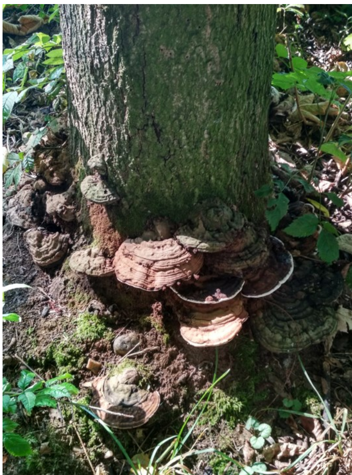
Plodnice dřevokazných hub u báze