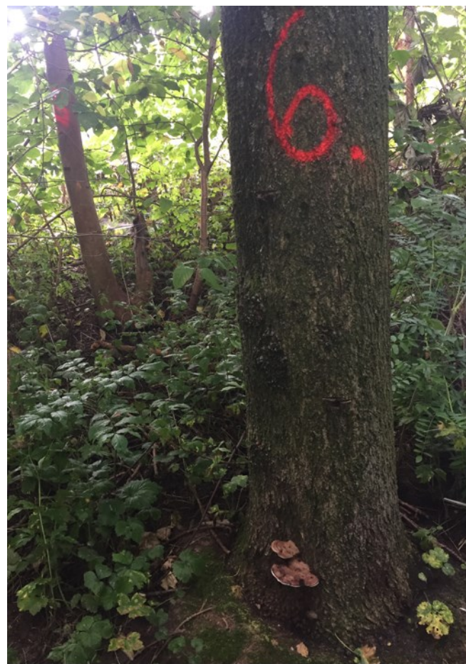
Plodnice dřevokazné houby na bázi kmene