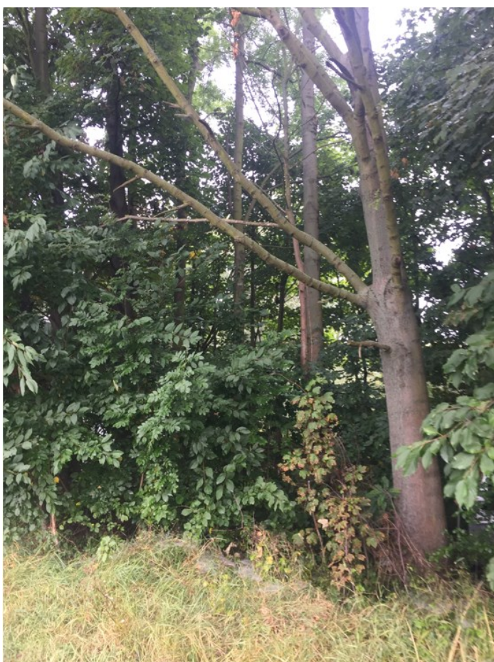
Vlajkovitá a téměř suchá koruna