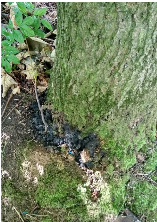
Plodnice dřevomora kořenového u báze