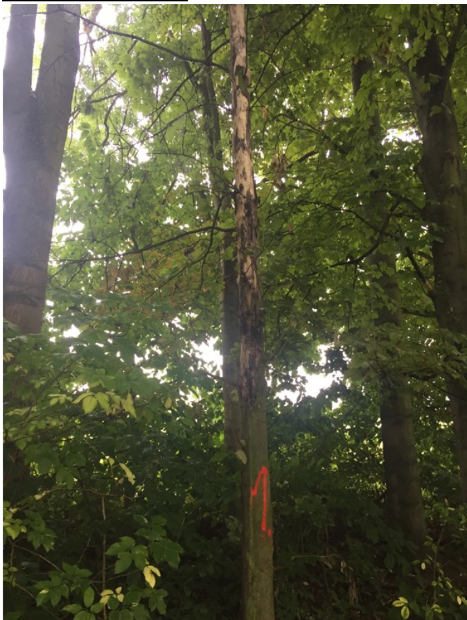
Suchá horní část dřeviny