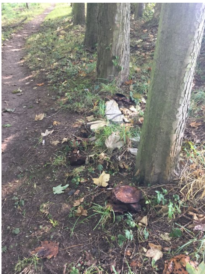
Plodnice václavky či šupinovky na náběžích