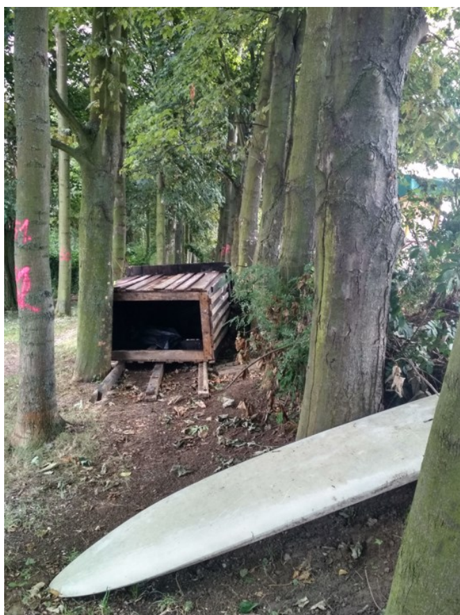
Nepovolené stavby a materiál na pozemku PLa