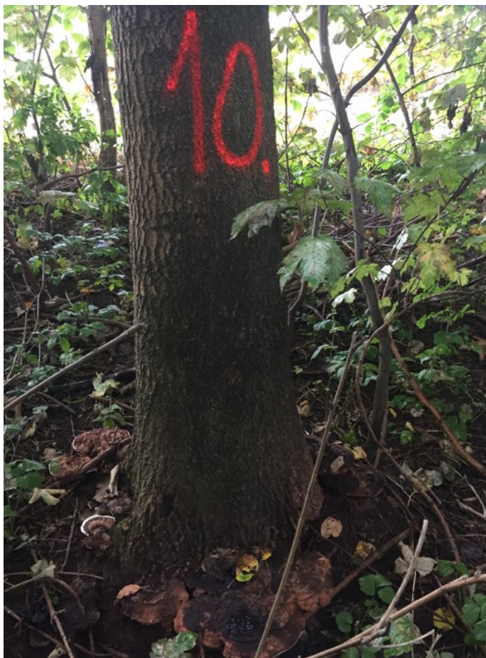
Plodnice dřevokazných hub po obvodu báze