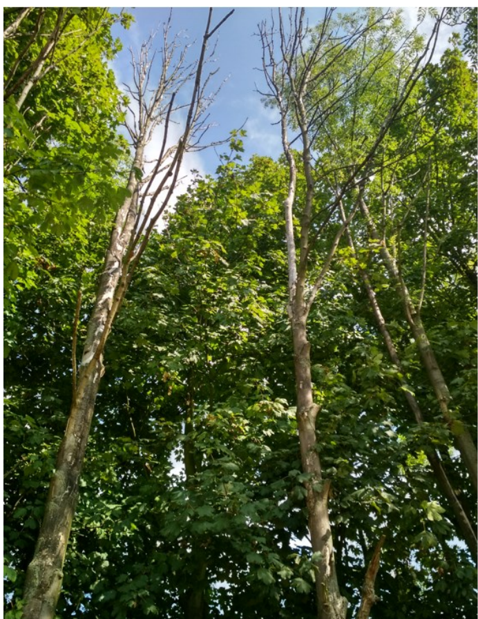
Suché jasaný v porostu s vlajkovitými korunami