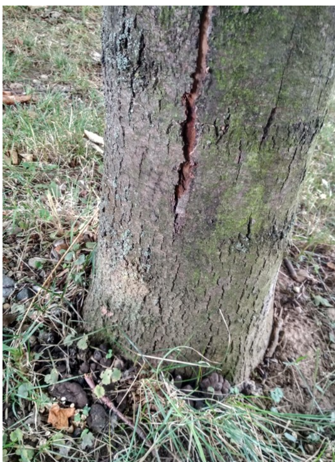
Prasklina kmene a dřevomor kořenový u báze