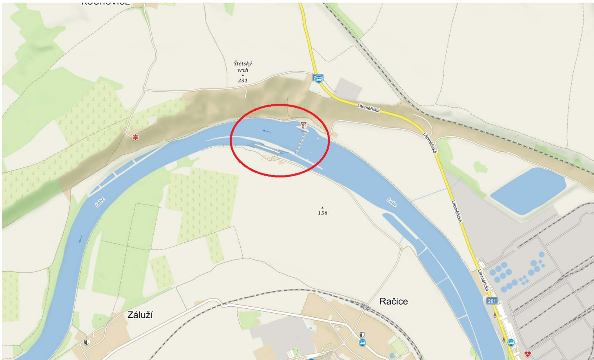
Příloha 7.1 – Situace vodního díla