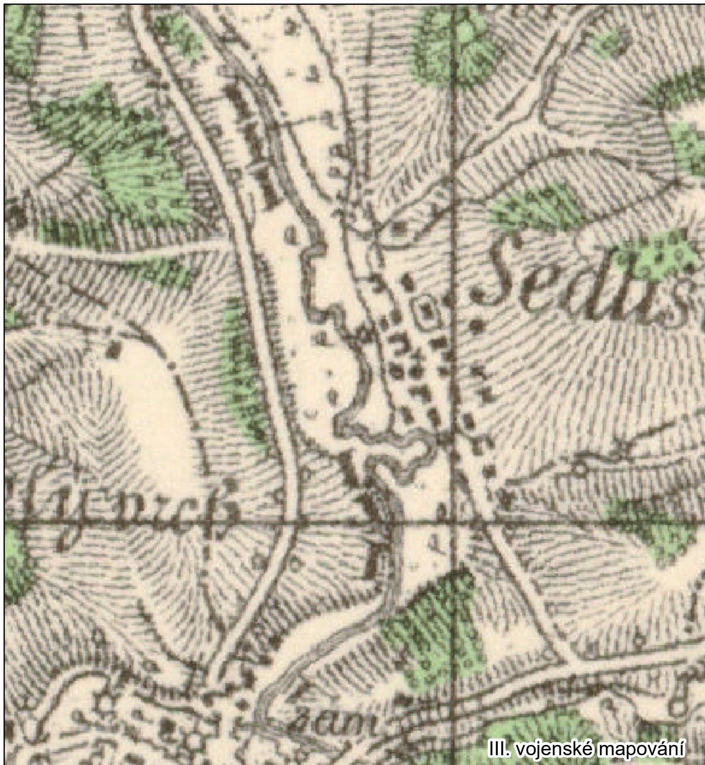
III. vojenské mapování