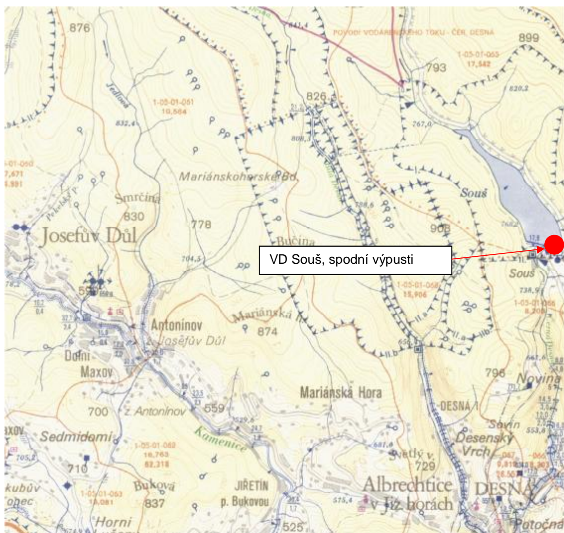
Situace - základní vodohospodářská mapa (03-14)

VD Souš, výměna pohonů povodních šoupat spodních výpustí