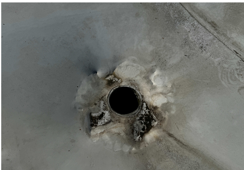
Obr. 12: Střešní vpust