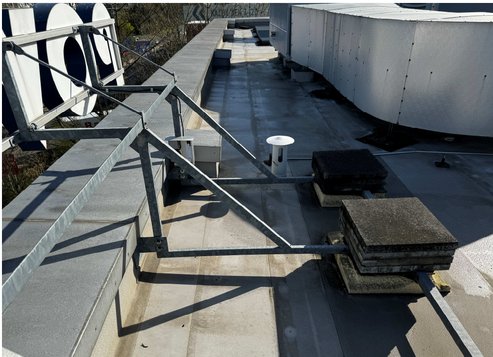
Obr. 9: Uchycení nápisu.