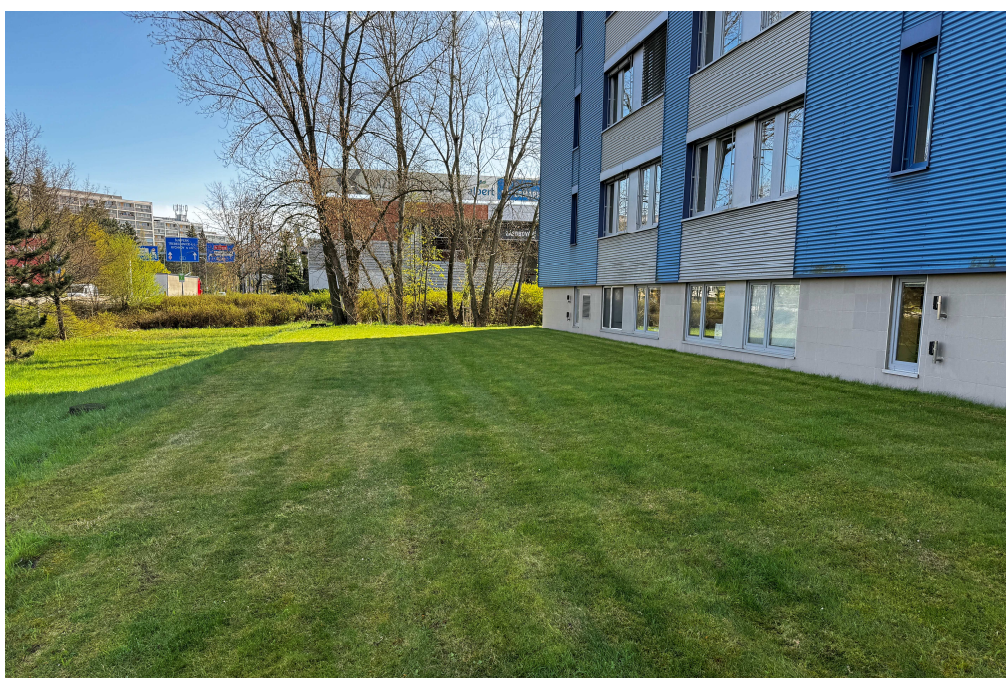
Obr. 14: Nástupní plocha (betonové zatravnovací tvárnice).