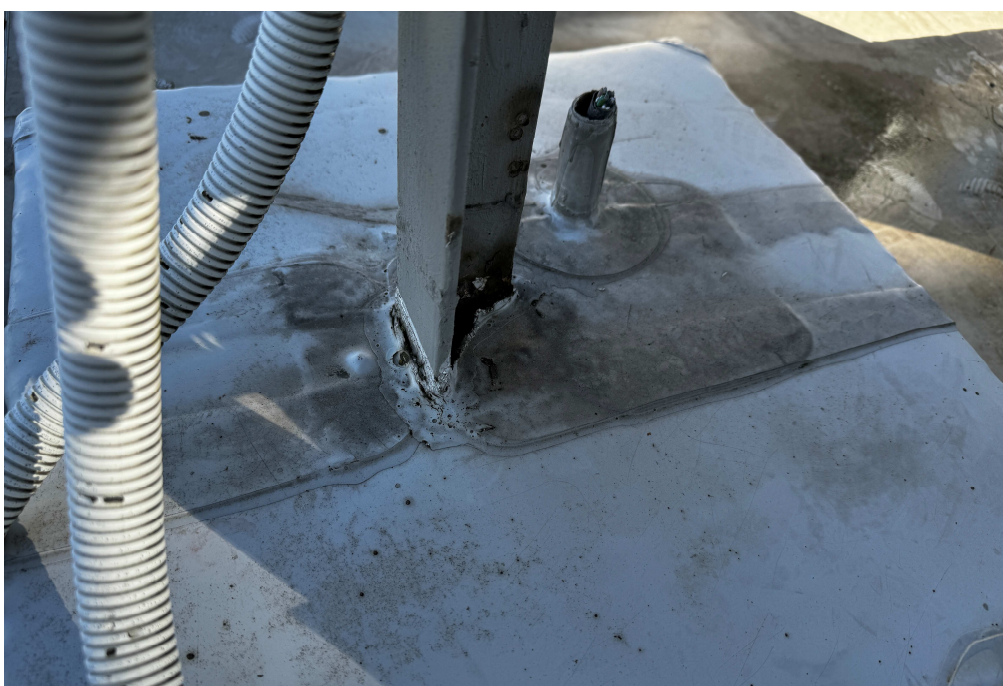
Obr. 8:Detail uchycení technologie č. 2.