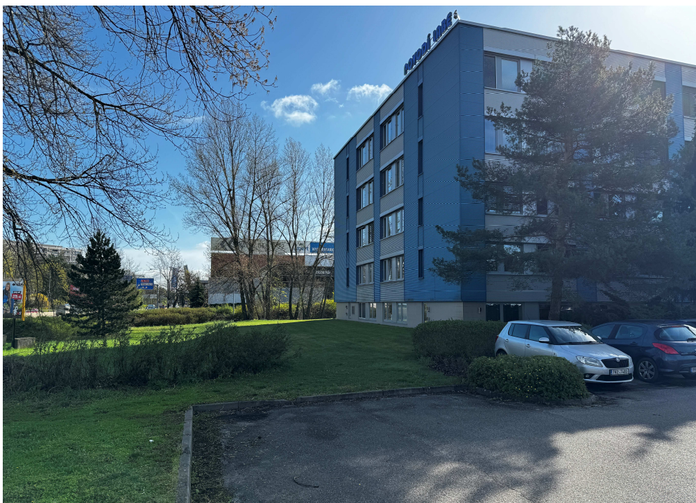
Obr. 13: Přijezd na nástupní plochu požární techniky.