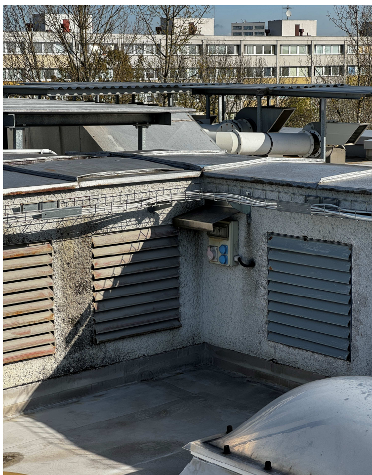
Obr. 2: Přívod elektrické energie.