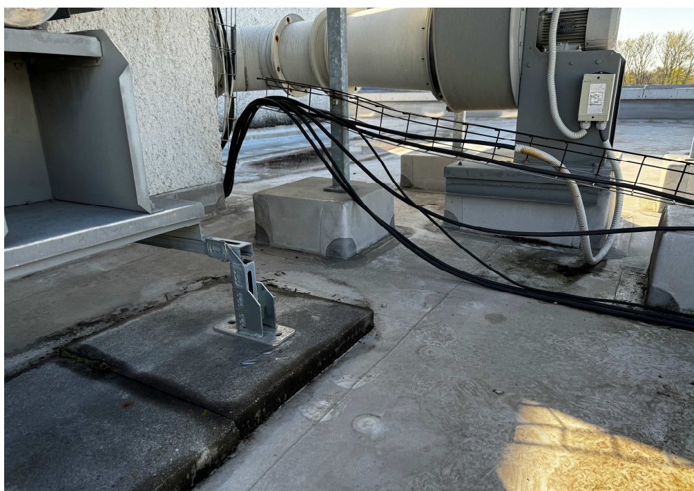
Obr. 4: Uložení technologie.