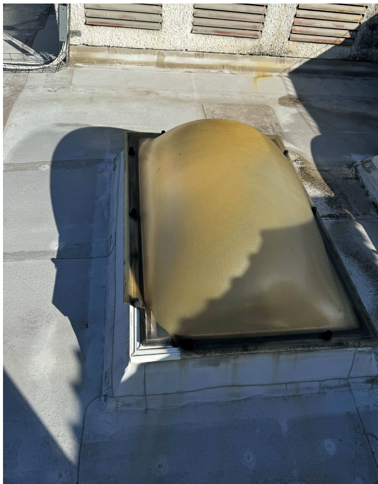
Obr. 3: Střešní světlík.