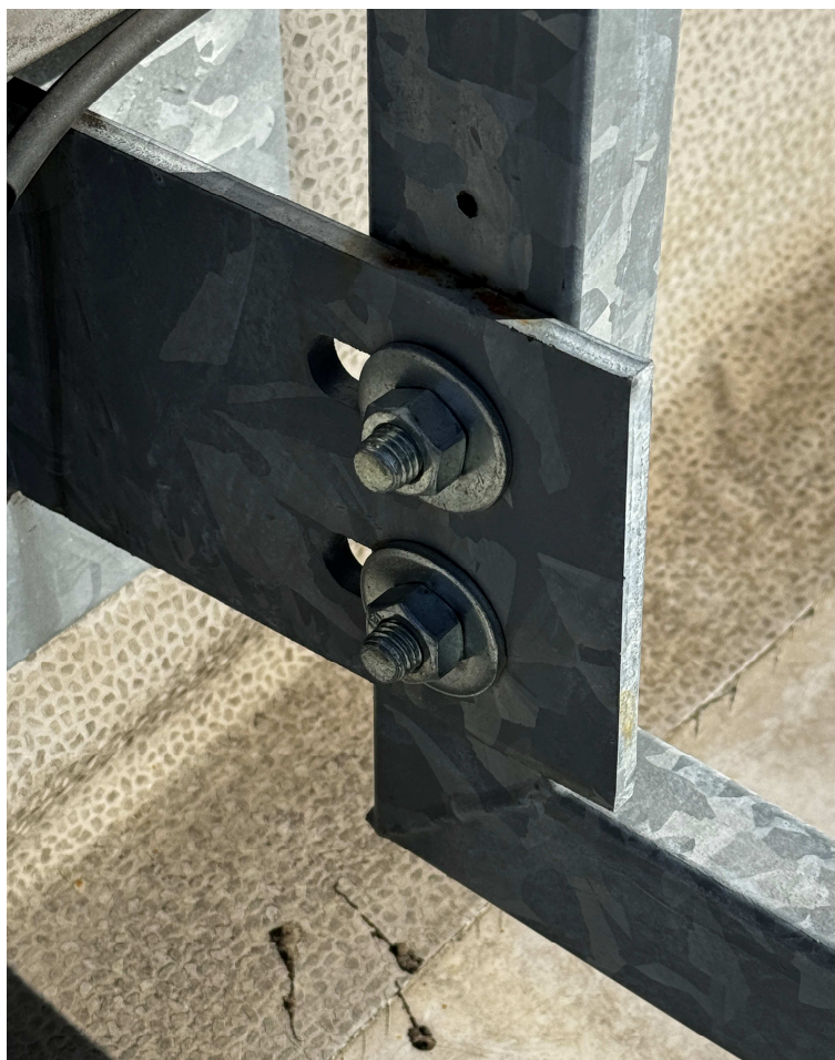
Obr. 10: Detail uchycení nápisu.