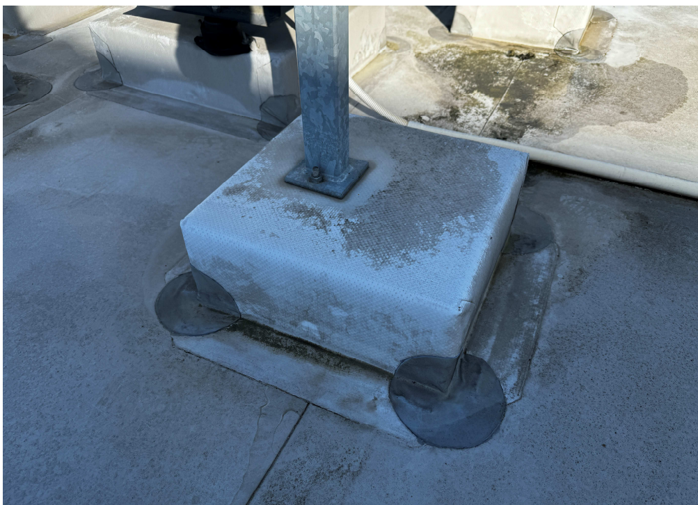
Obr. 7:Detail uchycení technologie č. 1.