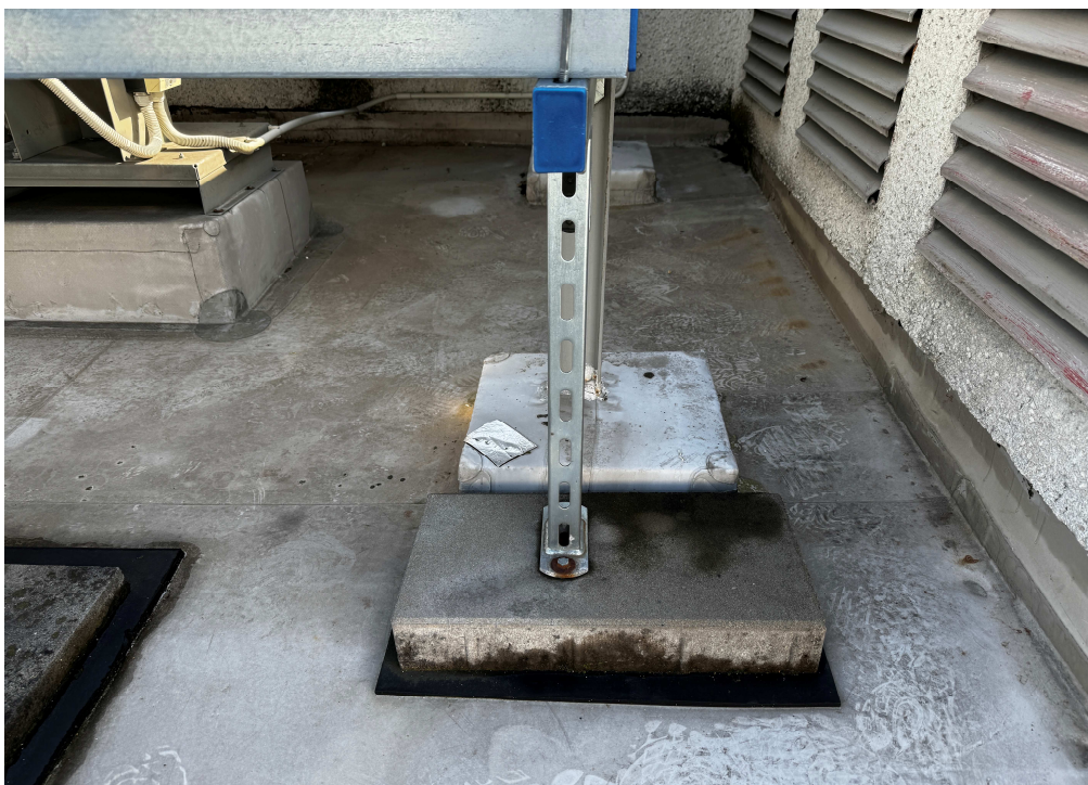
Obr. 11: Detail uchycení technologie.