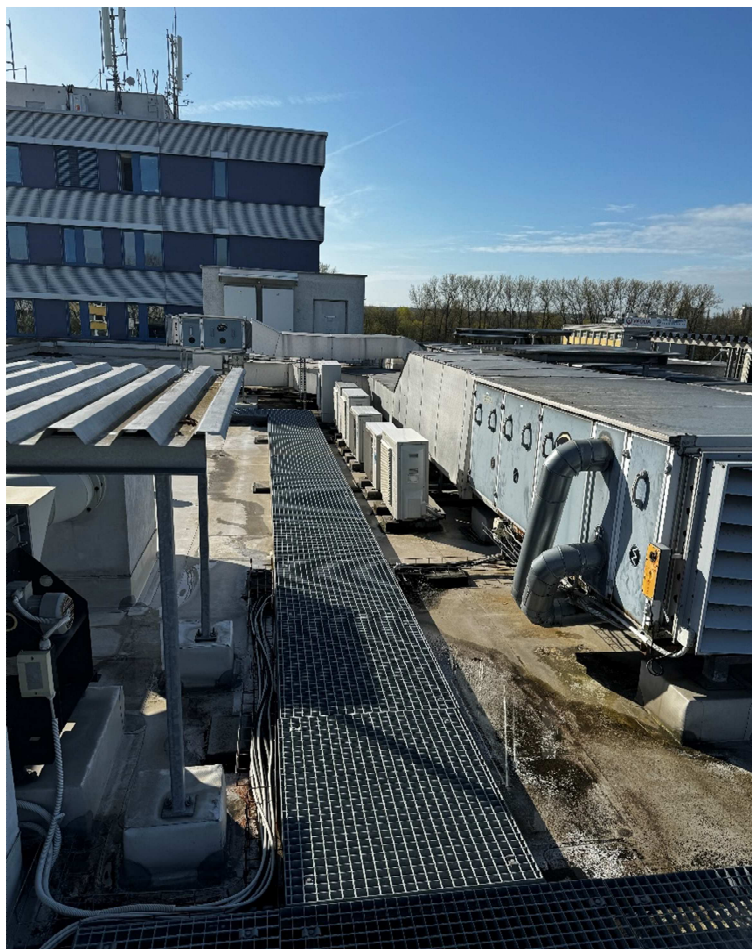
Obr. 6: Pohled na objekty na střeše.