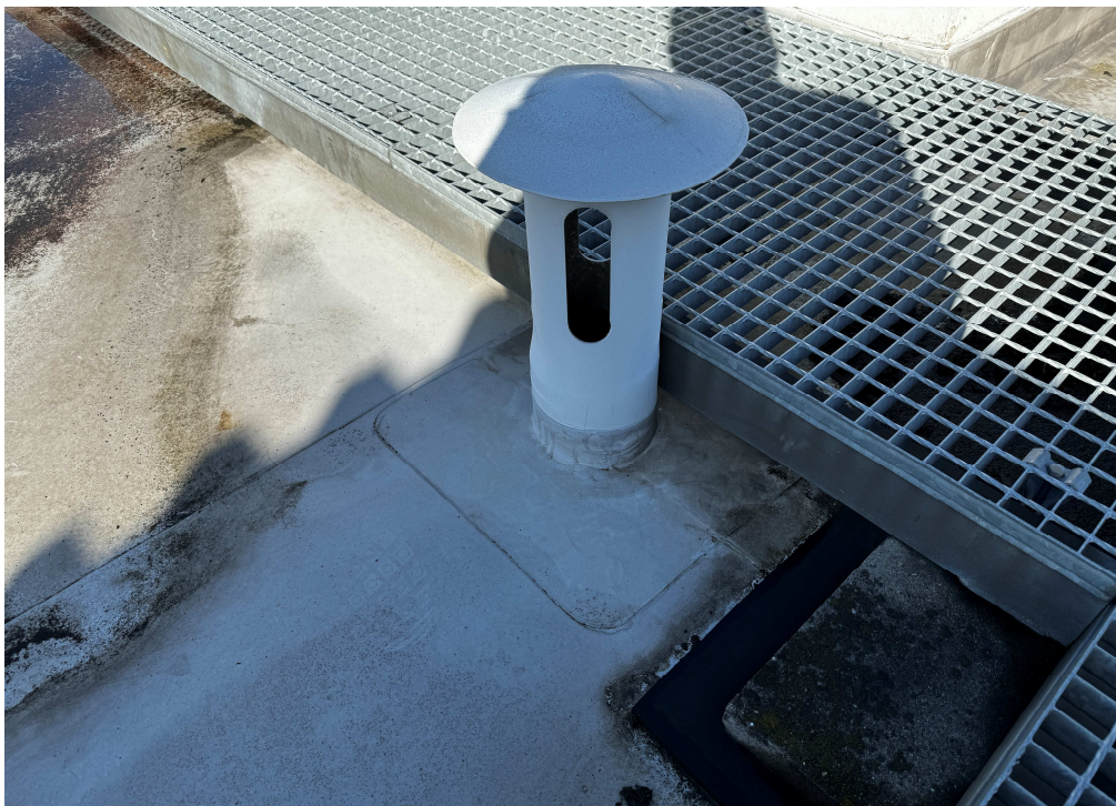
Obr. 5: Odvzdušnění vnitřní kanalizace.