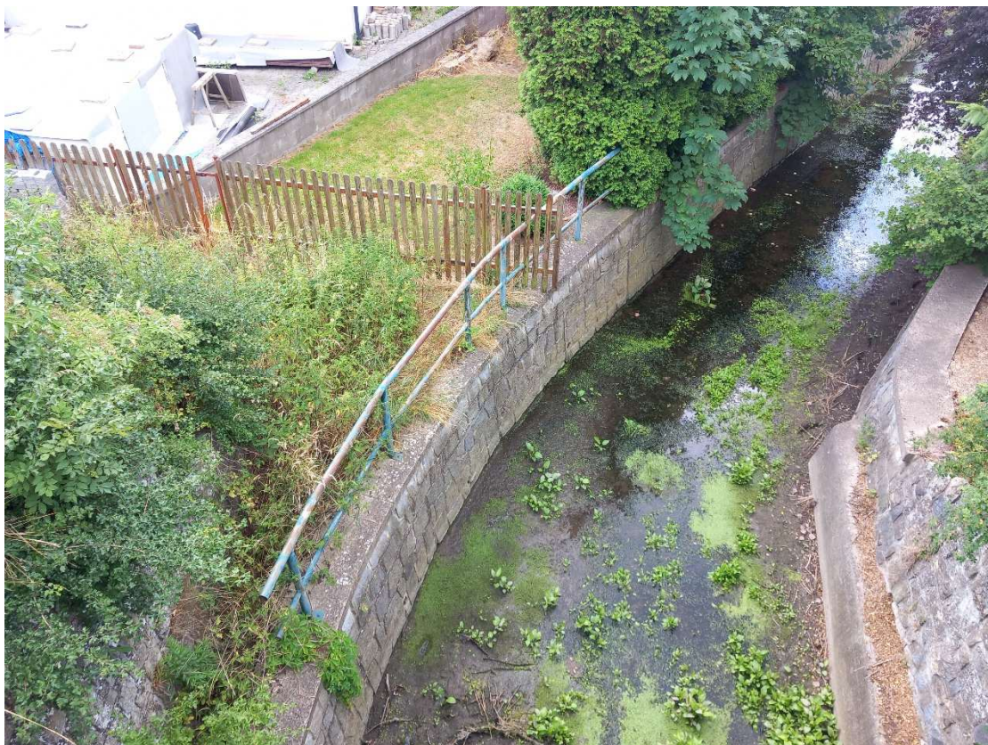
Obr. 3: ř. km 0,355 – pohled po proudu z železničního mostu – odtěžení sedimentu, sanace římsy