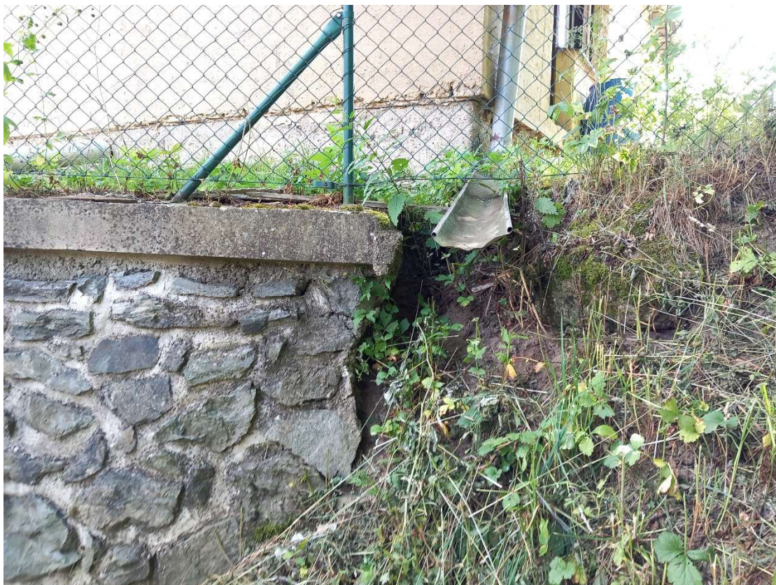
Obr. 9: ř. km 2,278 – oprava výusti, zpevnění kamennou rovnaninou