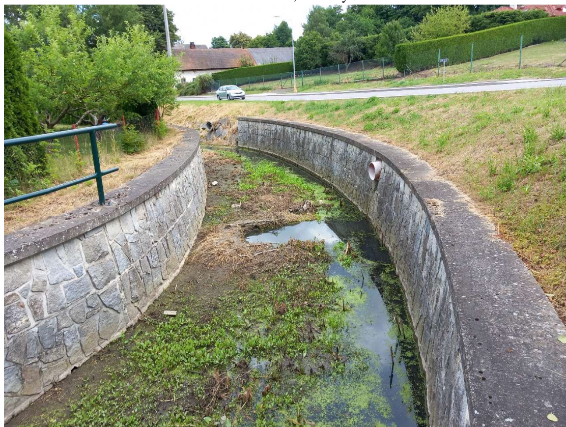
Obr. 6: ř. km 0,835 – pohled proti proudu – odtěžení sedimentu