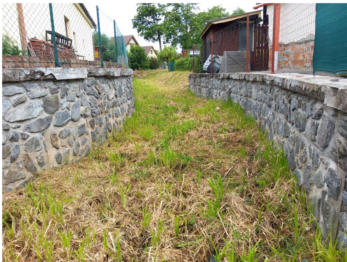
Obr. 7: ř. km 1,489 – pohled proti proudu – oprava římse, odtěžení sedimentu