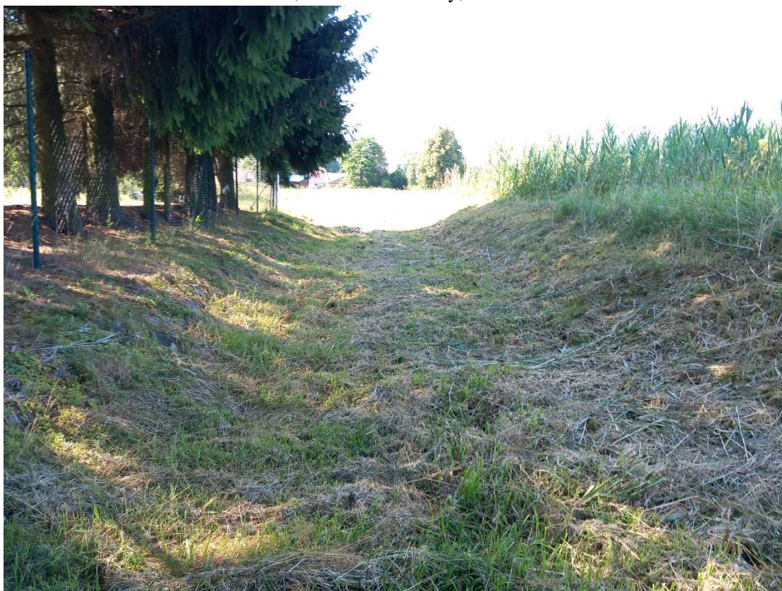
Obr. 12: ř. km 3,149 – pohled po proudu – odtěžení sedimentu, oprava kamenné paty