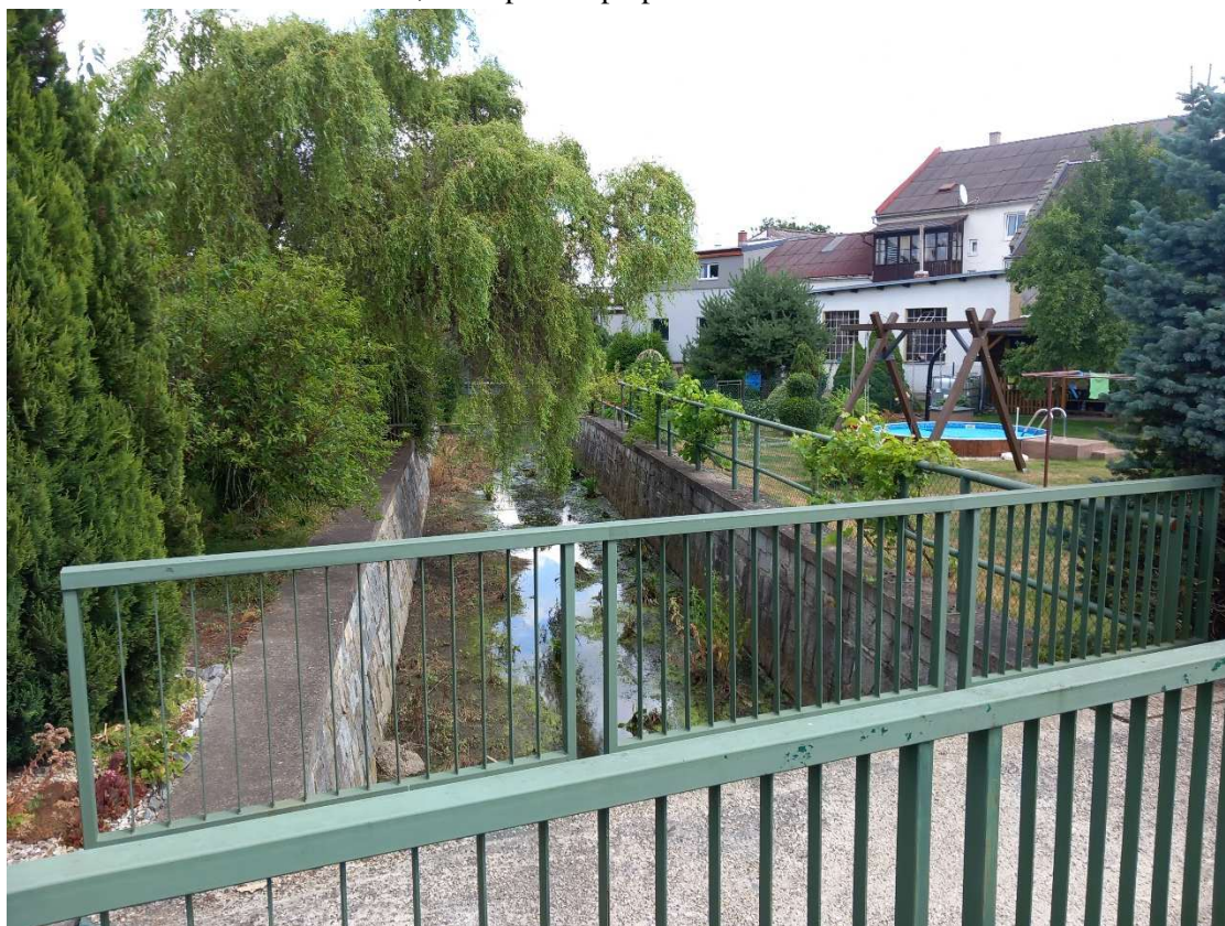
Obr. 2 – ř. km 0,214 – pohled proti proudu – odtěžení sedimentu, sanace římsy, výměna zábradlí