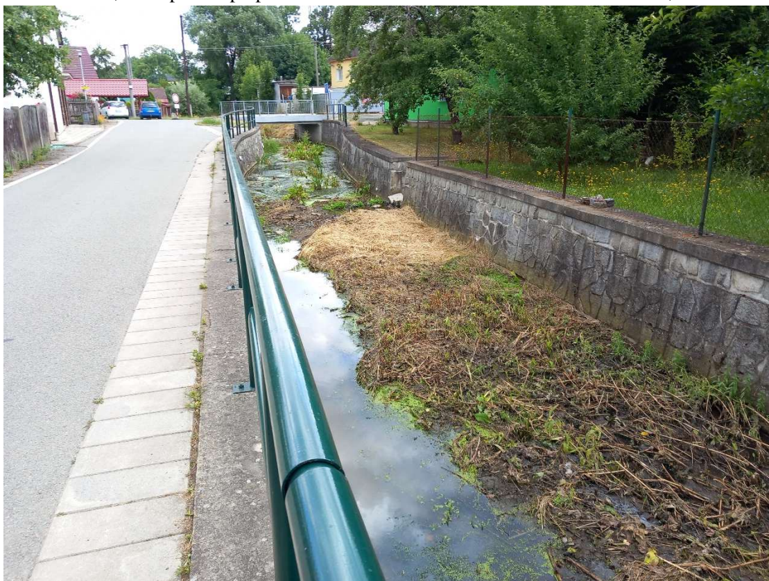
Obr. 4: ř. km 0,495 – pohled proti proudu – odtěžení sedimentu