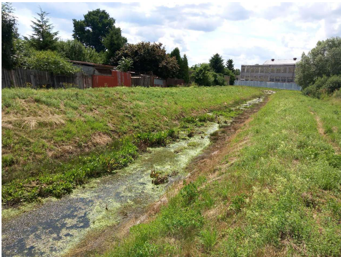
Obr. 1: ř. km 0,165 – pohled po proudu – odtěžení sedimentu