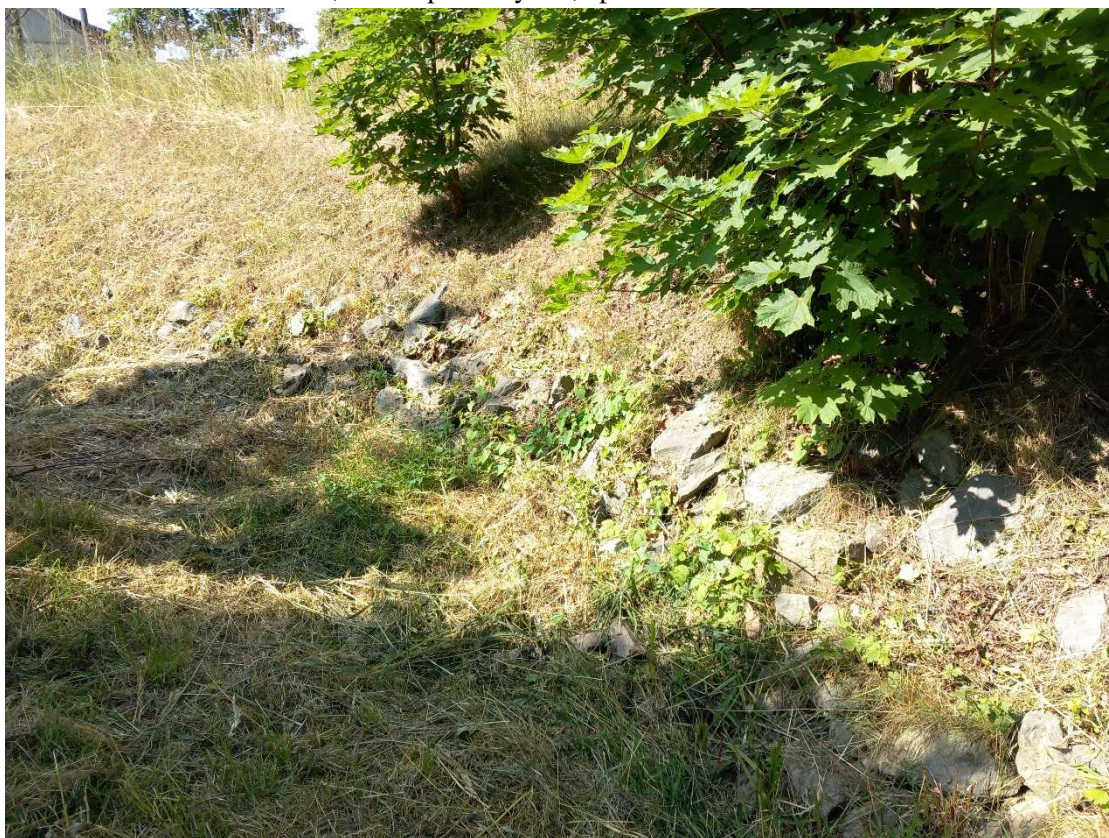
Obr. 10: ř. km 2,680 – pohled po proudu – oprava kamenné rovnaniny