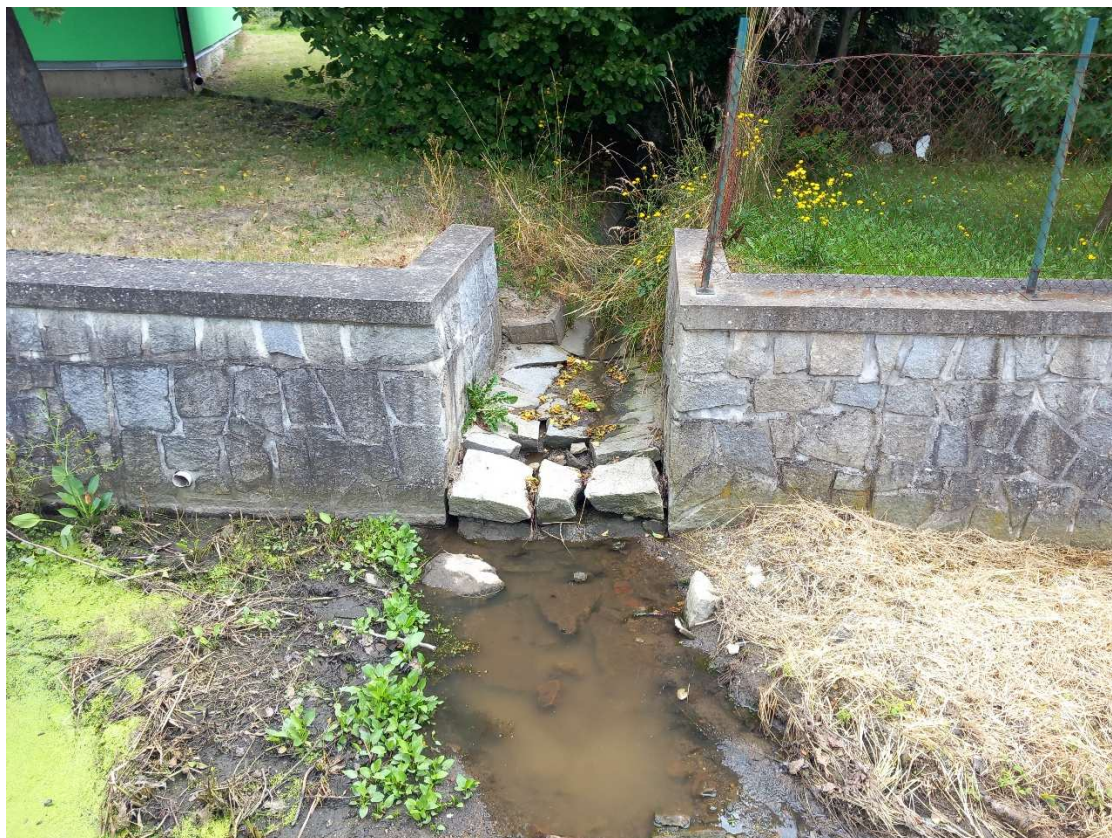
Obr. 5: ř. km 0,518 – výust'