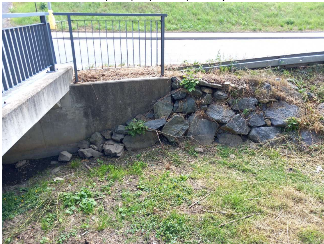
Obr. 8: ř. km 2,093 – 2,096 – uložení kamenné rovnániny do betonu