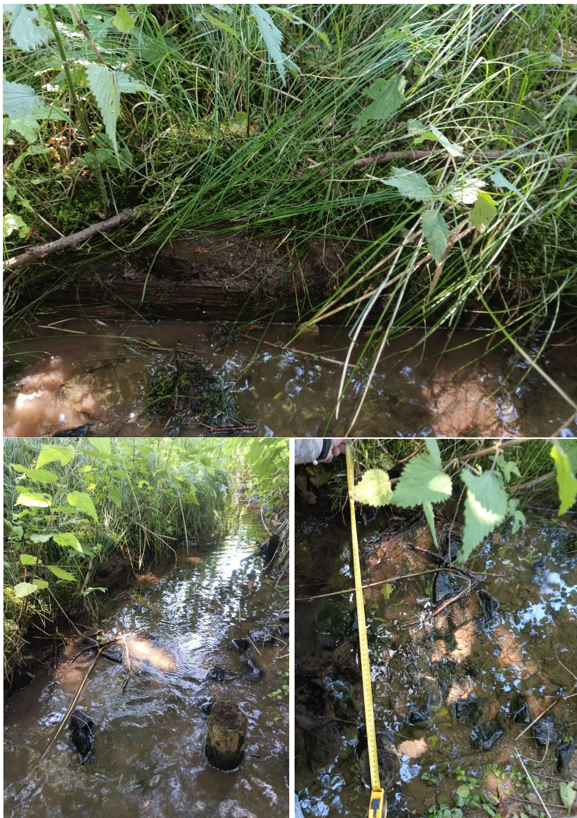
Obr. Opevnění dřevěnými plůtky