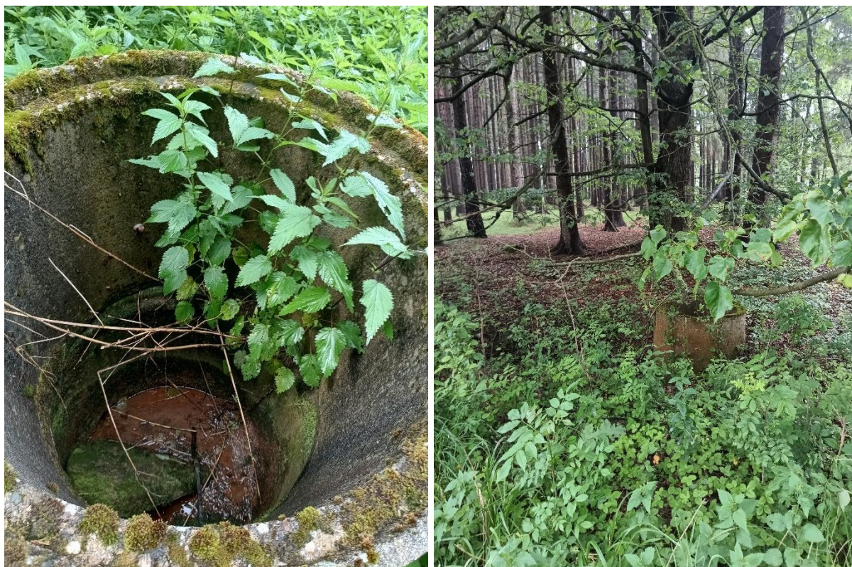
Obr. Šachta napojení svodného drénu před zaústěním do toku (levá), šachta v místě zakončení příkopu podél lesa (pravá)