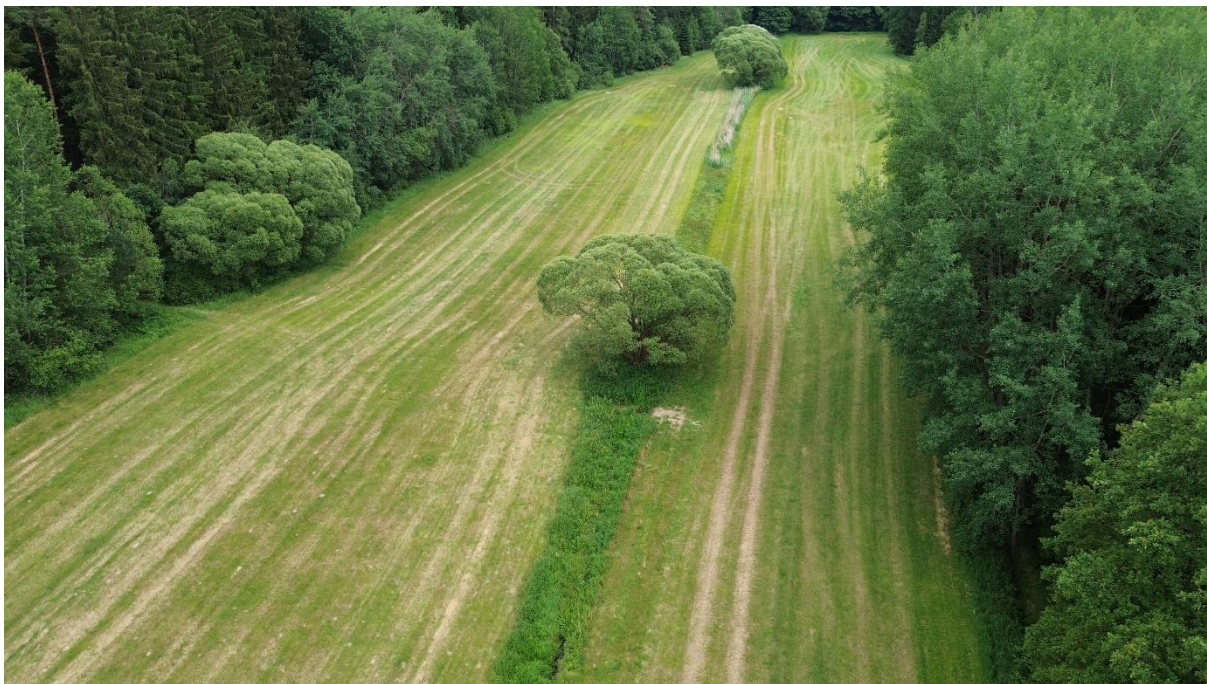
Obr. Pohled na celkovou lokalitu (směr po toku)