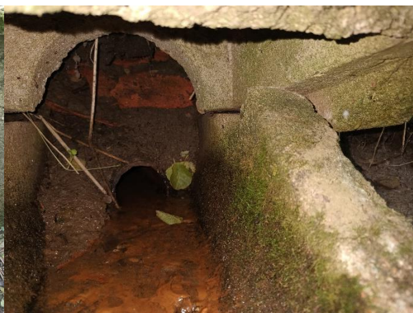
Obr. Propustek pod zájmovým územím DN 1000 (levý), pohled do levobřežního vyústění od šachty.