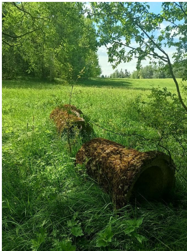
Obr. Levobřežní příkop skrze nivu, který je v části zatrubněn, část potrubí je již vytažená do nivy