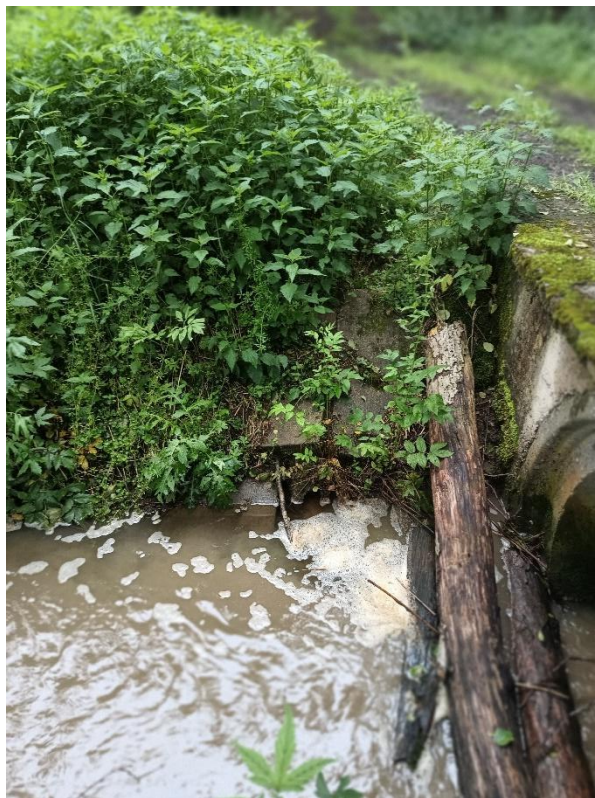
Obr. Vyústění svodného drénu (levá), vyústění příkopu podél lesa nad propustkem (pravá)