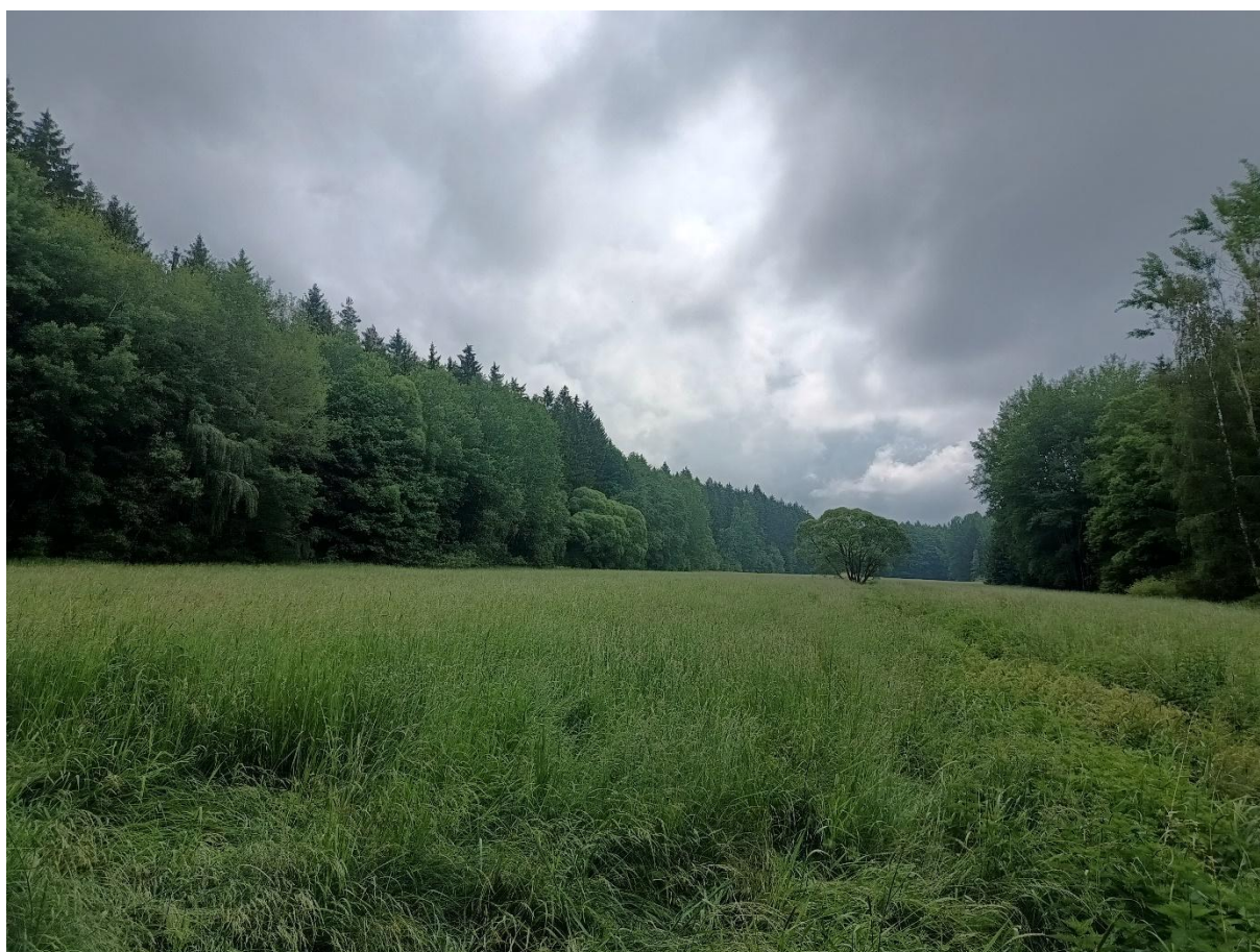
Obr. Pohled do nivy Javornického potoka