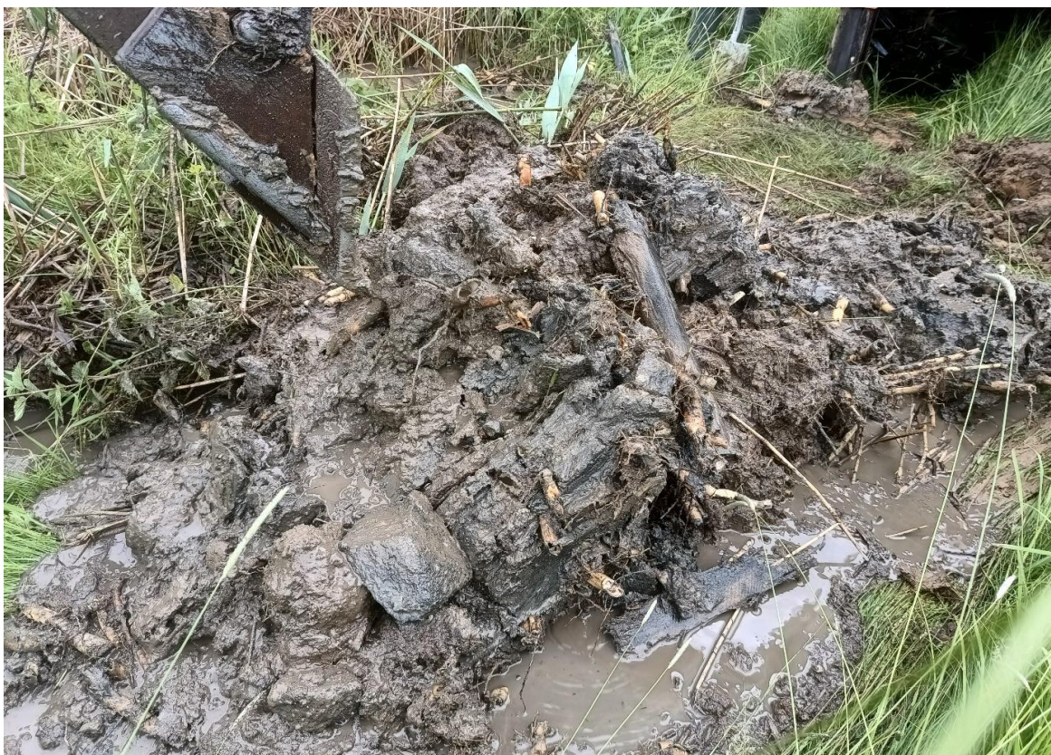
Obr. Sonda č. 1 Výkop z koryta se zbytky organických zbytků (zejména rákos), s patrnými plůtky a kamenným záhozem.