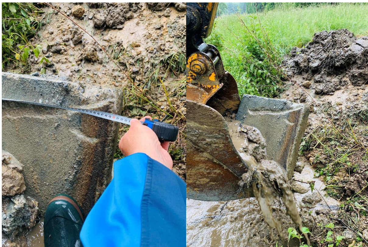
Obr. Sonda č. 4 Nález betonového opevnění v blízkosti intravilánu