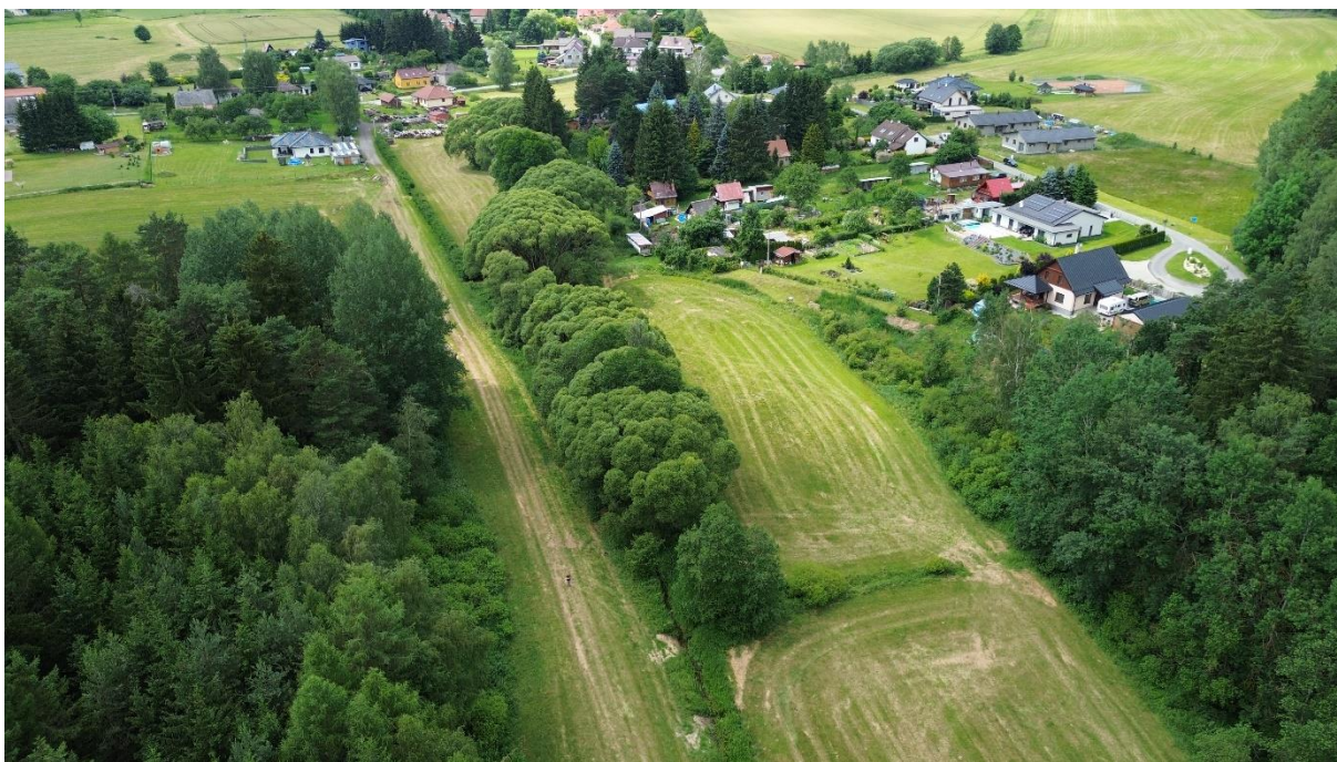
Obr. Pohled na celkovou lokalitu (směr proti toku)