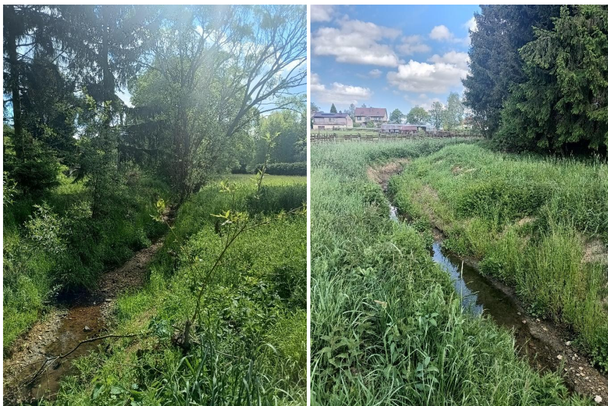
Obr. Pročištěná část pod obcí