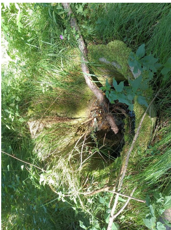
Obr. Skruž před zaústěním do toku na levém a pravém břehu