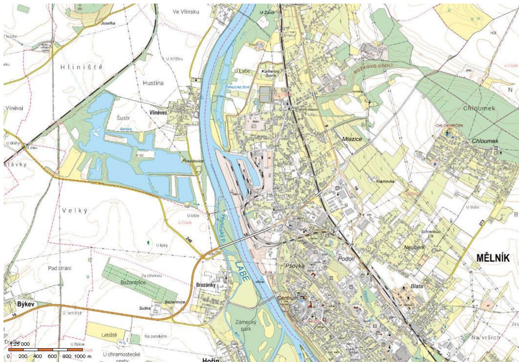
Příloha 17.1 – Situace vodního díla